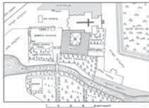
Il. 7. Plan klasztoru w Łądzie mniej więcej z połowy XIX w. według materiałów AGD, rys. L. Fijał (sążeń rosyjski = ok. 2,1336 m)

Fig. 6. Illustration of the Ląd monastery according to Sznerer (wood engraving) [according to: 16]