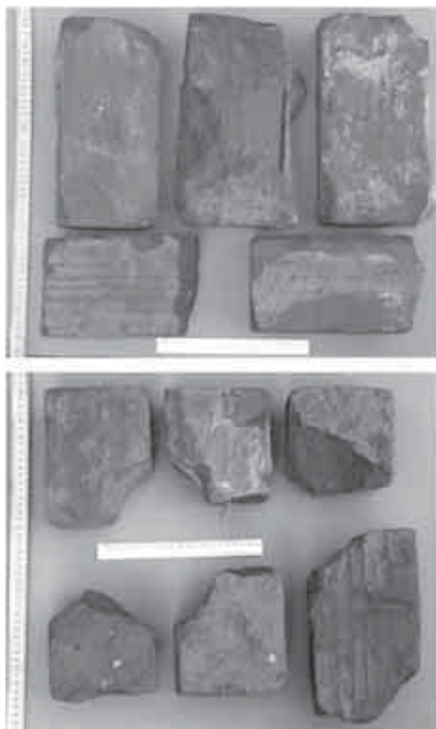
Il. 10. Wybór cegieł z gruzowiska

Fig. 10. Bricks from the rubble