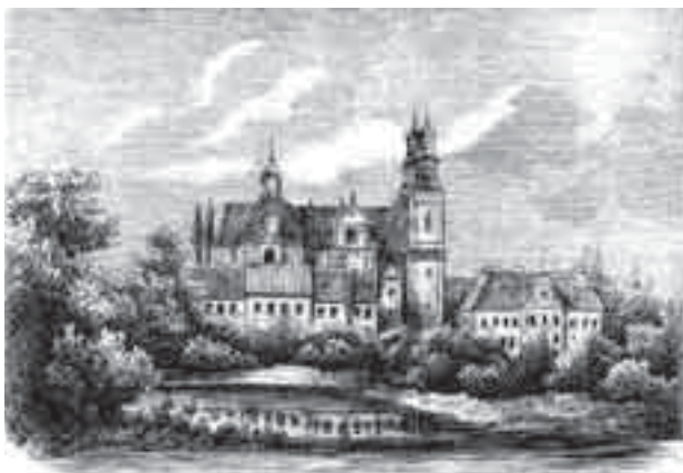
Il. 6. Widok klasztoru w Łądzie według Sznerera (drzeworyt) [za: 16]

Fig. 6. Illustration of the Ląd monastery according to Sznerer (wood engraving) [according to: 16]