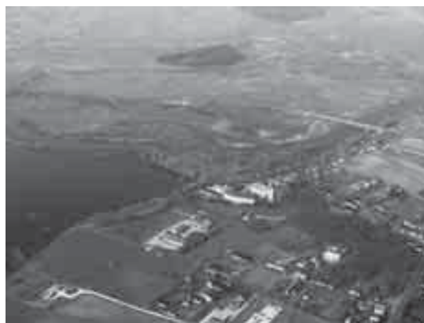
Il. 2. Wiosenne rozlewiska Warty w rejonie klasztoru cystersów w Łądzie w 2006 r.

Pewne jest, że zakonników do Łądu sprowadził książę Mieszko III Stary [11], [31], natomiast data fundacji po dziś