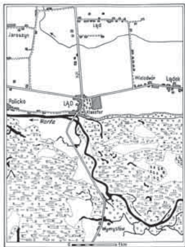
Il. 1. Mapa okolic Łądu (rys. L. Fijał, 1:25 000) Fig. 1. Map of the Ląd environments (1: 25 000 map drawn by L. Fijał)

wcześniejszych, średniowiecznych dziejów, a także kolejnych jego przebudów architektonicznych, szczególnie założenia średniowiecznego.