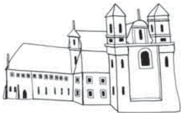
Il. 4. Wygląd opactwa według Adama Swacha z obrazu olejnego w krużgankach klasztornych z 1714 r. (na obrazie prawy dolny róg) (rys. P. Namiota)