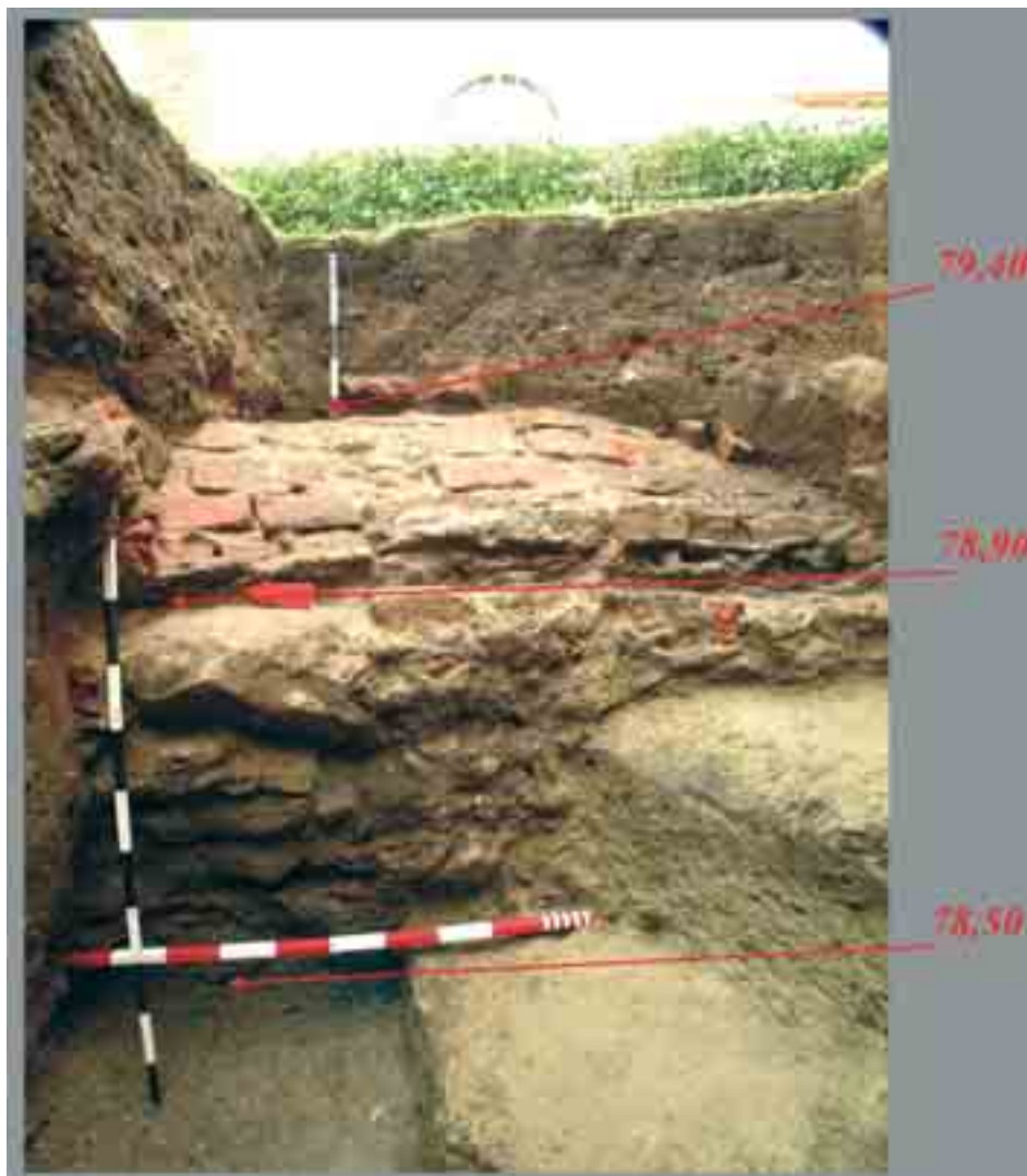
Il. 11. Obiekt „A” odkryty w wykopie I/2006 w wirydarzu klasztornym z zaznaczonymi poziomami wysokościowymi n.p.m. (fot. A.M. Wyrwa, oprac. T. Kasprovicz)