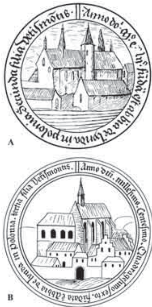
Il. 3. Przedstawienia opactwa łądzkiego z tablic filiacyjnych opactwa w Altenbergu (A – tablica filiacyjna I; B – tablica filiacyjna II), według oryginału rys. L. Fijał