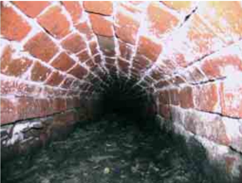
Il. 12. Widok kanału wewnątrz