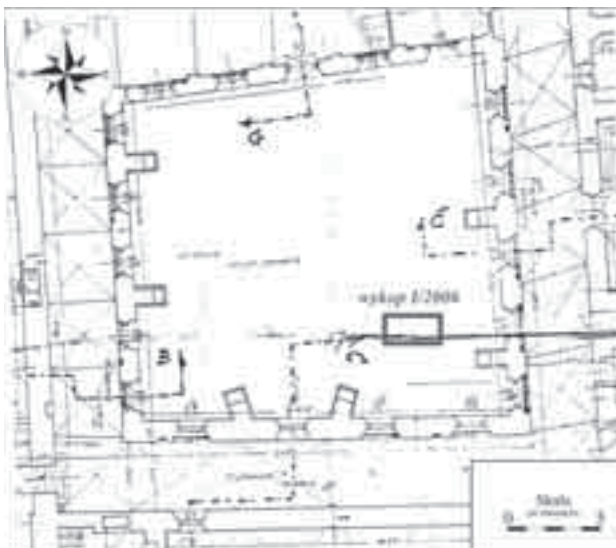
Il. 8. Lokalizacja wykopu archeologicznego I/2006 w wirydarzu klasztornym (rys. T. Kasprowicz)

Fig. 8. Localization of archaeological I/2006 excavations in the monastic cloister (drawn by T. Kasprowicz)