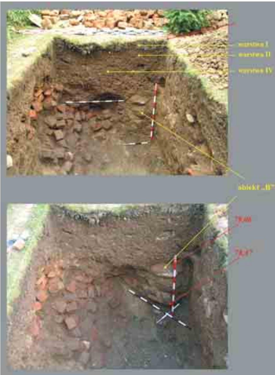
Il. 13. Widok na profil zachodni wykopu I/2006 z widocznym obiektem „B” (oprac. T. Kasproicz)