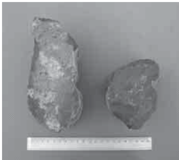
Il. 9. Fragmenty żeber sklepiennych pozyskanych z gruzowiska

Fig. 8. Localization of archaeological I/2006 excavations in the monastic cloister (drawn by T. Kasprowicz)