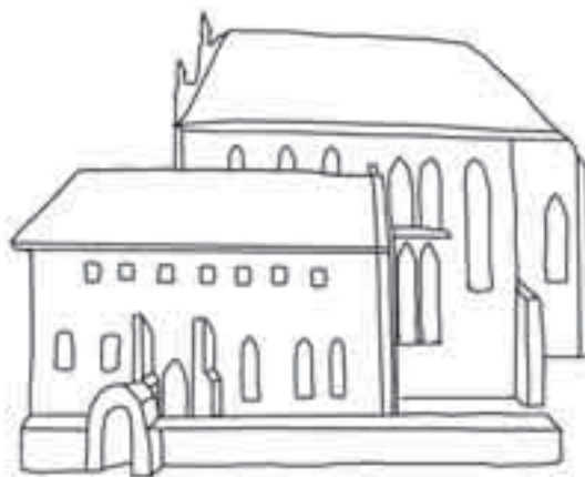
Il. 5. Wygląd opactwa łądzkiego według fresku Adama Swacha w sieni klasztornej (rys. P. Namiota)