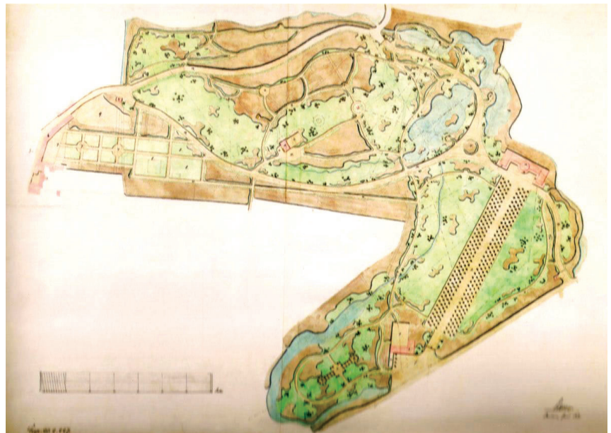
Fig. 4. Szczytnicki Park in Wrocław. Designed by E. Petzold in 1861

lipy, topole białe, buki i klony czerwone oraz platany. Istotną cechą założenia zaprojektowanego przez Petzolda były starannie skomponowane osie widokowe. Głównym punktem widokowym założenia był usytuowany w jego zachodniej części, na wzniesieniu, zamek (tzw. Schwanenschloß). Stamtąd roztaczał się widok na staw i biegnącą wzdłuż jego wschodniej granicy aleję głogową.