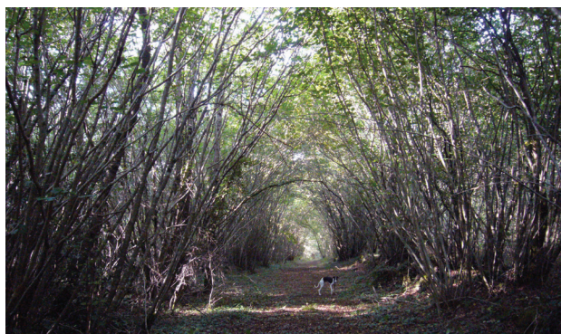
II. 6. Aleja kasztanowców w pobliżu bramy południowej opactwa, 2013