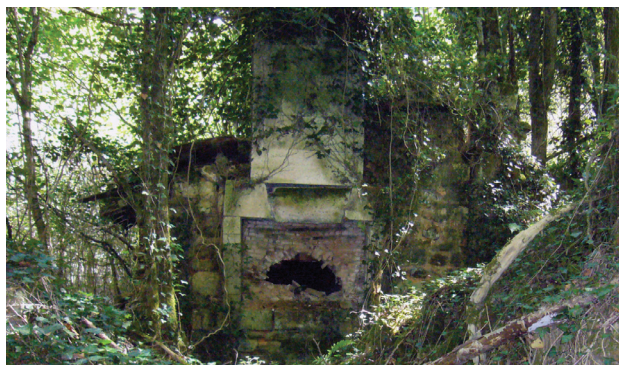
II. 5. Ruiny zabudowań folwarku na południe od opactwa Grosbot, fragment z piecem chlebowym, 2013