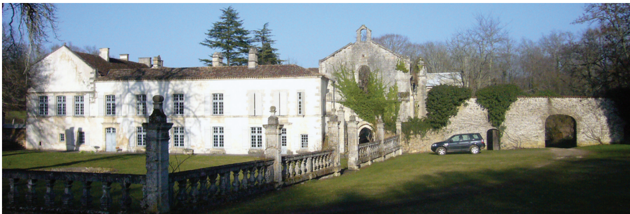
II. 4. Widok na kościół i zachodnie skrzydło klasztoru w Grosbot, 2013