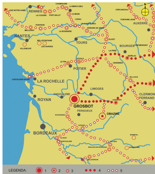
Il. 2. Fragment szlaku Via Equidia Cisterciena w południowo-zachodniej Francji: 1 – opactwo cysterskie Grosbot, 2 – opactwo cysterskie Obazine, 3 – inne opactwo cysterskie, 4 – główny szlak do Europy Wschodniej, 5 – inne trasy szlaku (oprac. J. Furgalska)

Jedną z pierwszych map, na których widnieje opactwo, jest mapa francuskiego kartografa Cassiniego z XVII w. [5, s. I]. Widoczny jest na niej ogromny zespół lasów krainy Horte, który nadał nazwę opactwu Grosbot – „Opactwo