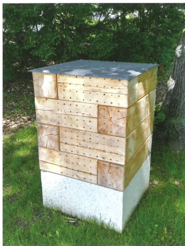
Hotele dla owadów osadzone na cokółkach z betonu architektonicznego

Równie wielkim wyzwaniem było przeprowadzenie samych prac, które wymagały najwyższych standardów wykonawczych oraz interdyscyplinarnego nadzoru. I to już na etapie robót rozbiórkowych. Otworzyły one przestrzeń dla wykreowania nowych nawierzchni alejek i placów – żwirowych przepuszczalnych dla wody. Towarzyszyły temu prace w zieleni (gospodarka drzewostanem, nasadzenia drzew – 10 szt., krzewów – 144 szt., roślin cebulowych – 910 m 2 , pnączy i paproci – 200 m 2 , nowe trawniki – 8500 m 2 ) oraz prace w zakresie przyrodniczym (45 urządzeń: typu hotele dla owadów, karmniki dla ptaków i wiewiórek, skrzynki dla ptaków, skrzynki dla nietoperzy).