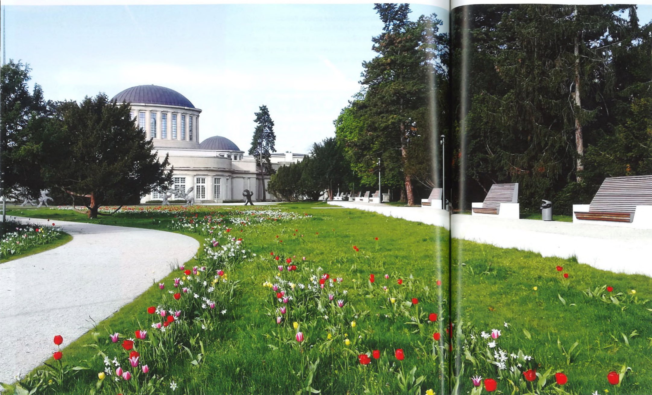
W Pawilonie Czterech Kopuł zlokalizowanym w Parku Szczytnickim znajduje się Muzeum Sztuki Współczesnej – oddział Muzeum Narodowego we Wrocławiu