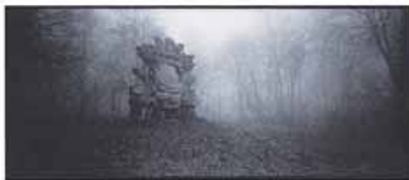
Piotr Chojnacki - Przy okolicy, z cyklu Kontury realności, 2001