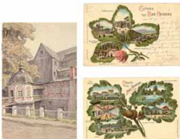
Pocztówki z Dusznik-Zdroju (niem. Bad Reinerz), pocz. XX w.

Zbiory gromadzone od 1999 r. w Dziale Historii Dusznik-Zdroju liczą obecnie około 500 przedmiotów kultury materialnej i duchowej, ilustrujących dorobek miasta i jego mieszkańców. Znalazły się w nich zarówno wyroby konwisarskie (naczynia z cyny), medalierskie, meblarskie, jak i obrazy olejne oraz grafika użytkowa, którą reprezentuje bogata kolekcja wydanych przed 1939 r. pocztówek z Dusznik-Zdroju i okolic.