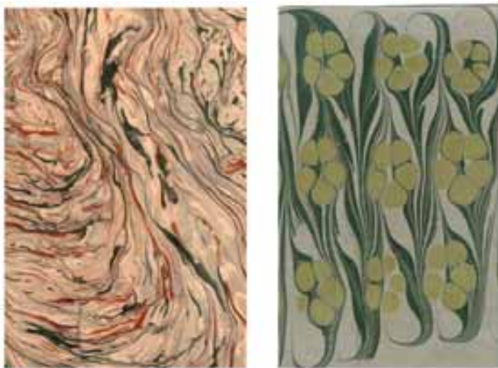
Papiery wzorzyste, S.Szczerbiński, Kraków 1910