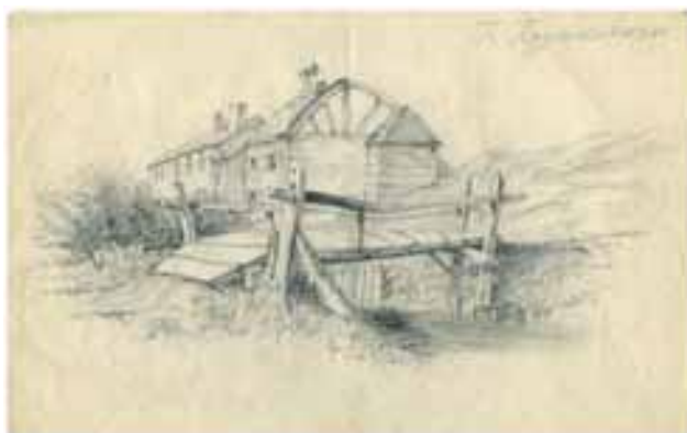
Kolekcja Królikowskich 2 poł. XIX w. – rysunek ołówkiem