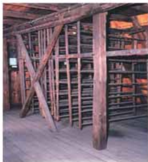
Wieszaki do suszenia papieru XIX/XX w.

W tym miejscu należy wspomnieć o innym zachowanym elemencie wystroju papierni, mianowicie o unikatowych malowidłach z XVII–XIX w., dekorujących stropy i ściany dwóch pomieszczeń na kondygnacji strychowej, pełniących niegdyś funkcje mieszkalne. Niespójną chronologicznie i stylistycznie polichromię, wykonaną farbami klejowymi przez nieznaną twórców, pokryto w latach 30. XX w. warstwami pobiał. Malowidła, przedstawiające motywy roślinne, sceny rodzajowe i alegoryczne, odsłonięto około 1960 r., a w latach 1985–1987 odrestaurowano 3 .