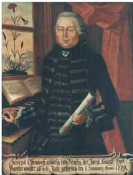
Portret Josepha Ossendorffa (1733–1779)

Zgromadzone muzealia podzielono na historyczne, artystyczne i techniczne. Ta podstawowa klasyfikacja