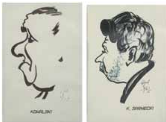
Karykatury papierników polskich, W. Żur 1967, tusz / piórko

Wart odnotowania jest także zbiór ekslibrisów (ponad 200 sztuk) wykonanych w latach 1963–1970 techniką drzeworytu, linorytu i cynkografii przez uznanych (Zygmunt Acedański) i mniej znanych twórców (Czesław Kudła).