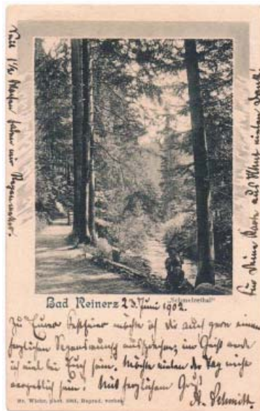
13. Poczтівka ze zdjęciem Brunona Wiehra