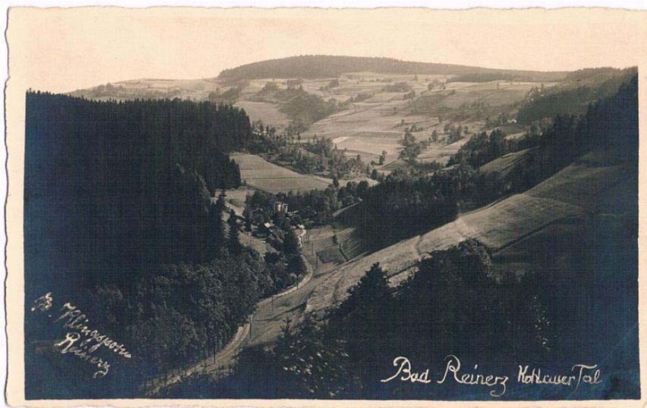
12. Max Klingsporn – Duszniki-Podgórze (fotografia w formie pocztówkowym)