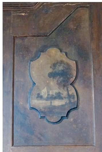
6. Joseph Nöpel (?), polichromia szafy – fragment, plebania parafii rzymskokatolickiej pw. Wniebowzięcia NMP, Lubawka, 2. poł. XVIII w.