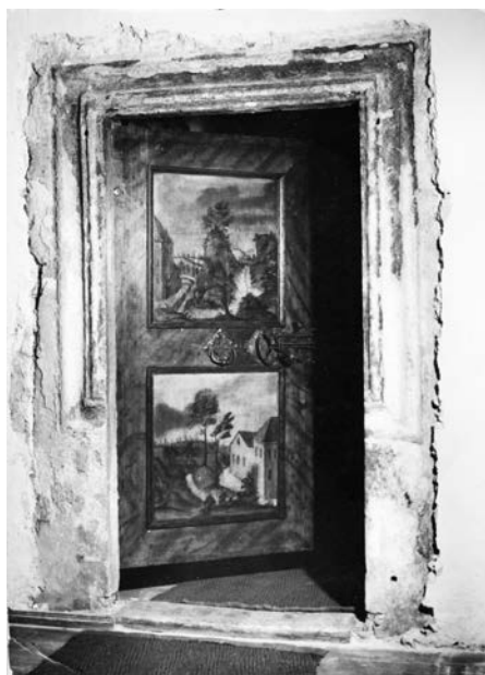
3. Portal renesansowy wewnątrz papierni, pocz. XVII w.

Polichromowane drzwi pierwotnie były wmontowane w późnorenesansowy fasciowy portal, który wykonano z piaskowca najprawdopodobniej na początku XVII wieku. Znajduje się on na drugiej kondygnacji w najstarszej, zachodniej części budynku młyna papierniczego, w tej partii pomieszczeń, które pełniły funkcje mieszkalne. Został on osadzony w ceglanej ścianie, która