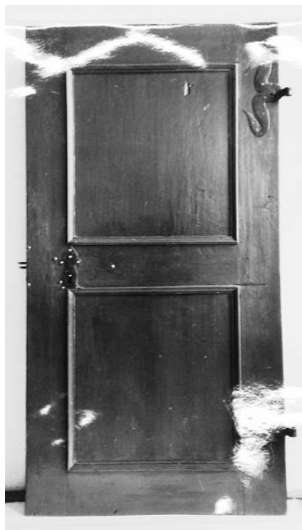
1. Polichromowane drzwi, strona wewnętrzna, stan w 1965 r., dawniej Muzeum Papiernictwa w Dusznikach Zdroju, obecnie zaginione, pocz. XVII i 4. ćwierć XVIII w.