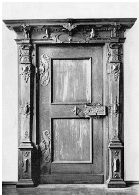
4. Drzwi w Sali Rycerskiej, zamek Aschaffenburg, ok. 1616 r.