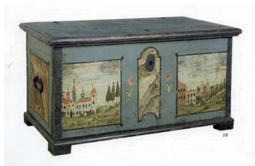
7. Polichromowana skrzynia z Walimia, Muzeum Narodowe we Wrocławiu, XVIII–XIX w.

Czas powstania malarskiej dekoracji drzwi z dusznickiej papierni jest zatem zbliżony z latami, w których najprawdopodobniej zostały wykonane architektoniczne iluzjonistyczne malowidła w Sali Józefa i w Sali pod Kopułą. Czyżby więc autorem polichromii zaginionych drzwi był także wspomniany już Caspar Rathsmann? Mając do dyspozycji jedynie archiwalne czarno-białe fotografie malowanych drzwi, nie