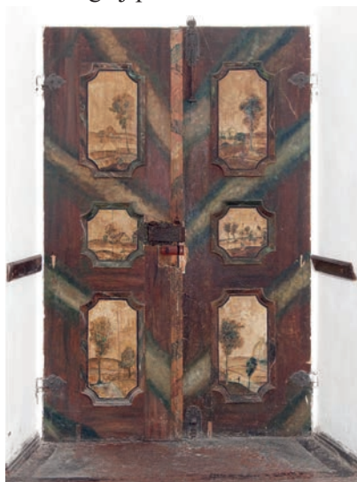
5. Joseph Nöpel (?), polichromia drzwi, plebania parafii rzymskokatolickiej pw. Wniebowzięcia NMP, Lubawka, 2. poł. XVIII w.

Z podobnym traktowaniem pejzażowych przedstawień jako elementu dekoracyjnego dla dzieł sztuki użytkowej mamy do czynienia w kilku zachowanych obiektach z terenu Śląska. Najlepsze pod względem artystycznym są dekoracje malarskie, jakie w drugiej połowie XVIII wieku wykonano na meblach znajdujących się w bu-