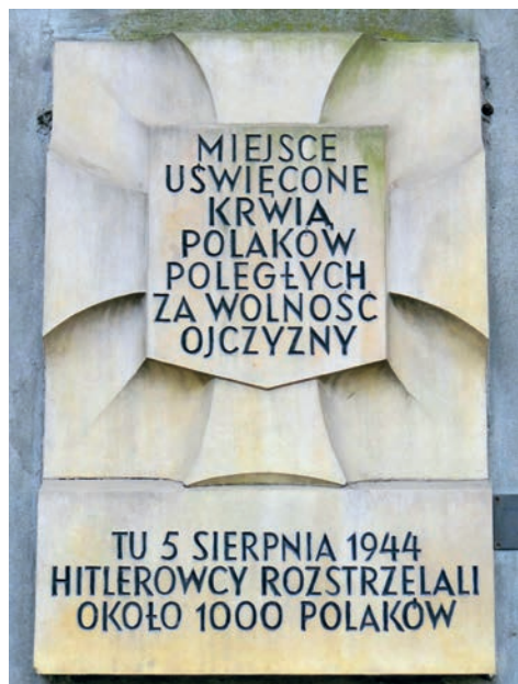
4. Tablica pamiątkowa umieszczona na jednym z murów dawnej Fabryki Obić Papierowych i Papierów Kolorowych „J. Franaszek S.A.”