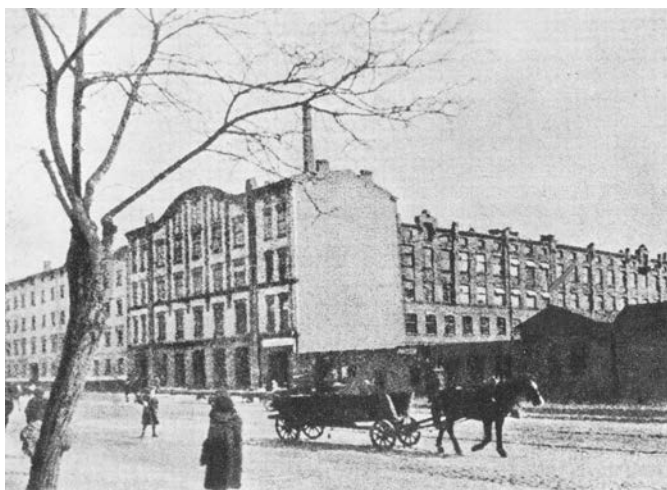
2. Widok na zabudowania Fabryki Obić i Papierów Kolorowych „J. Franaszek S.A.” – okres międzywojenny

Ocalałe produkty, głównie kolorowe papiery, z braku innych materiałów, były wykorzystywane do druku warszawskich gazet 18 .