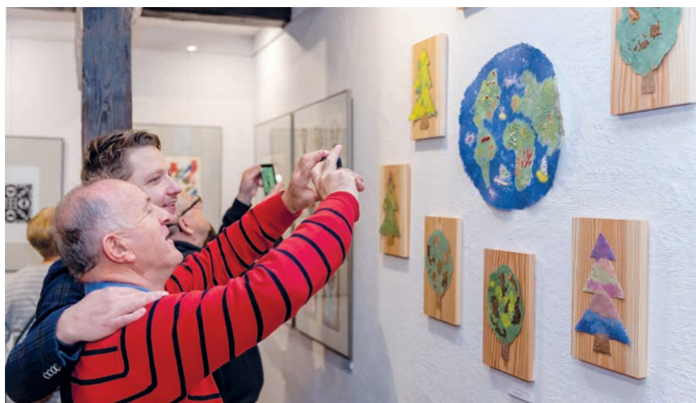
Oprac. na podst. materiałów Muzeum Papiernictwa Fot.: K. Jankowski