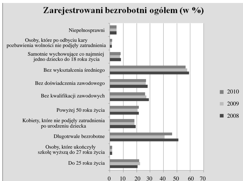
Rys. 1. Zestawienie struktury bezrobocia osób będących w szczególnej sytuacji na rynku pracy, zarejestrowanych ogółem z prawem do zasiłku w latach 2008-2010

Analizując tab. 1, stwierdza się, że w latach 2008-2010 zarówno wśród bezrobotnych zarejestrowanych ogółem, jak i bezrobotnych zarejestrowanych z prawem do zasiłku najwyższą stopę bezrobocia zanotowano w grupie osób bez wykształcenia średniego. Najniższa stopa bezrobocia wystąpiła w grupie osób, które po odbyciu kary pozbawienia wolności nie podjęły zatrudnienia.