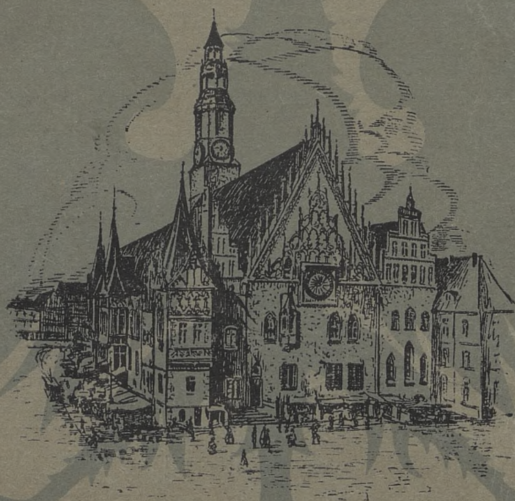
Ratusz wrocławski z r. 1299