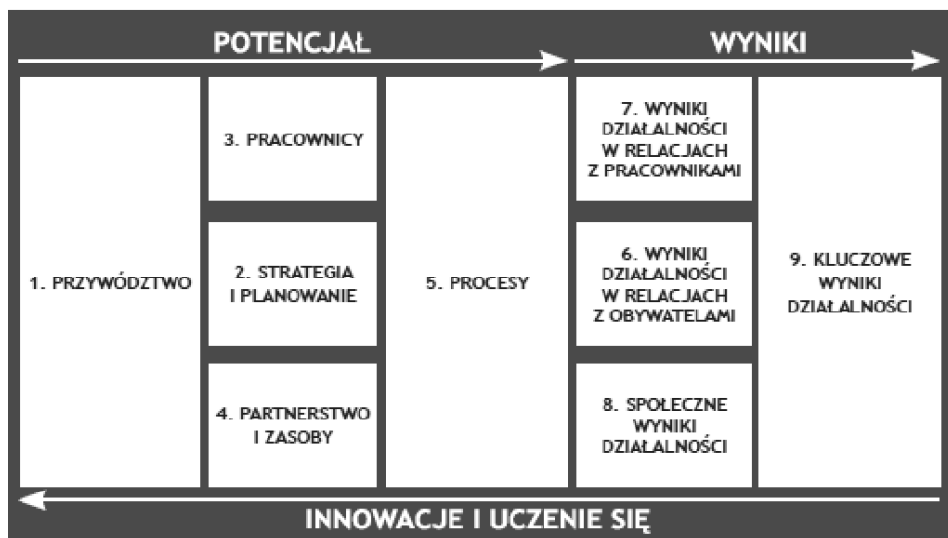
Rys. 2. Powszechny Model Oceny – kryteria oceny oraz wzajemne relacje

EIPA) w Maastricht. W 2000 r., podczas Europejskiej Konferencji Zarządzania Jakością w Administracji Publicznej w Lizbonie – dyrektorzy generalni administracji publicznej oficjalnie zalecili CAF do stosowania przez organizacje administracyjne krajów Unii. W latach 2000–2005, jak podano w [ Wspólna metoda... 2008], ok. 900 instytucji w krajach członkowskich UE stosowało tę metodę w celu doskonalenia organizacji.