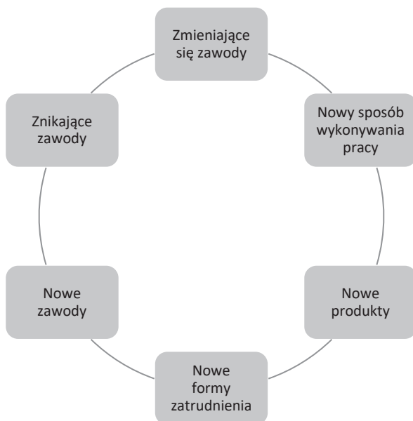
Rys. 1. Schematyczne przedstawienie przyszłości pracy

innowacyjnych rozwiązań (PARP Grupa PFR, 2021). Cały system edukacyjno-szkoleniowy powinien śledzić wymienione zjawiska, aby oferty udostępniane przez uczelnie oraz szkoły były dopasowane do potrzeb społeczeństwa i rynku.