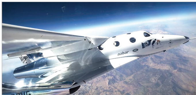
Fot. 24.3. Raketoplan Virgin Galactic Photo 24.3. Virgin Galactic rocket plane