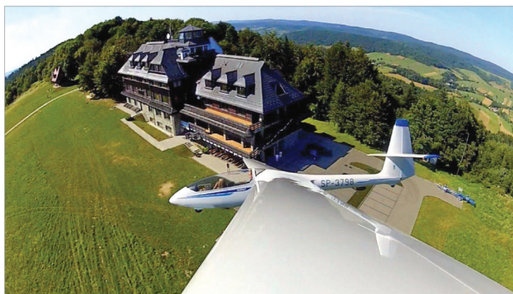
Fot. 24.2. Szybowiec na tle Akademickiego Ośrodka Szybowcowego Politechniki Rzeszowskiej w Bezmiechowej

Latanie rekreacyjne ( pleasure flying ) oznacza korzystanie ze statku powietrznego w jakimkolwiek innym celu, który nie jest bezpośrednio komercyjny lub biznesowy, w tym korzystanie ze statku powietrznego wynajętego specjalnie do takiego celu (Internet 4). Jest ono częścią lotnictwa ogólnego i może być traktowane jako szczególny przypadek turystyki sportowej. Usługi zwiedzania drogą lotniczą (które obejmują również loty widokowe), wyraźnie zapewniające doświadczenie turystyczne, są objęte kodem 5110 Międzynarodowej Standardowej Klasyfikacji Przemysłowej (ISIC), który odnosi się ogólnie do usług pasażerskiego transportu lotniczego. Kod ten jest używany do opisywania regularnych i czarterowych komercyjnych usług transportu lotniczego pasażerów, ale jest również używany do lotów rekreacyjnych w dalszej części działalności sportowej (kod ISIC 9319) (Papatheodorou, 2021, s. 227).