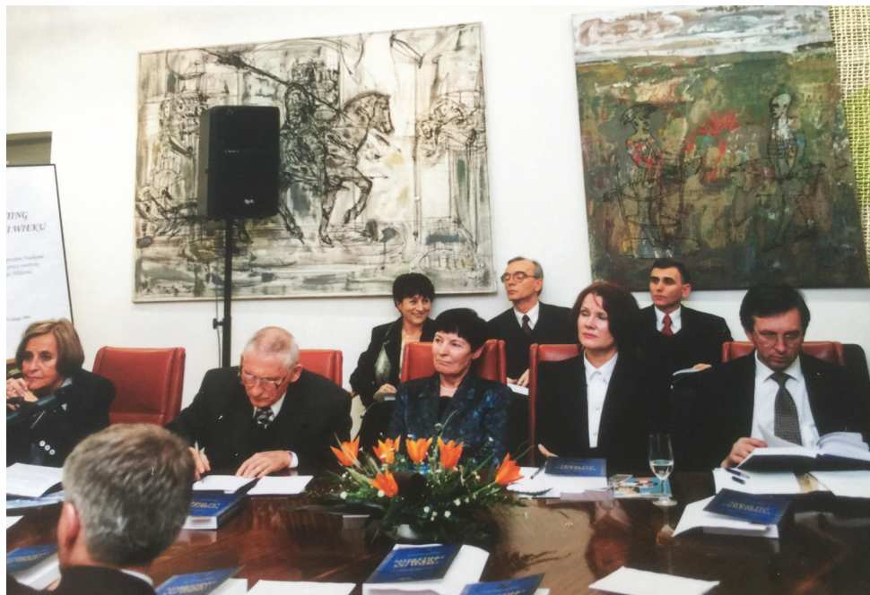
Fot. 11. Profesor Krystyna Mazurek-Łopacińska na konferencji na Wawelu w 2001 r.

konferencji organizowanych przez wiodące uczelnie ekonomiczne, a także wydziały ekonomiczne i zarządzania uniwersytetów oraz politechnik z całej Polski i aktywnie w nich uczestniczyła (fot. 11).