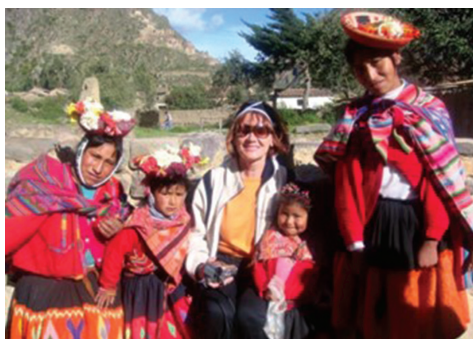
Fot. 14b-f. Zdjęcia z podróży