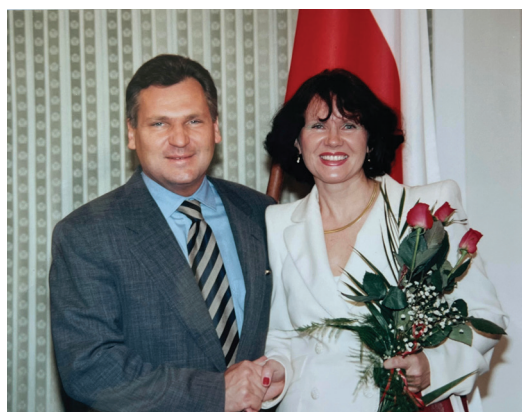
Fot. 2b. Nominacja w Pałacu Prezydenckim

Profesor Krystyna Mazurek-Łopacińska prowadzi badania w obszarze nauk ekonomicznych ze specjalizacją w zakresie marketingu, badań marketingowych, badań konsumpcji, zachowań nabywców oraz ekonomiki kultury i turystyki. Dorobek ten jest bardzo bogaty i wysoko ceniony w środowisku naukowym. Obejmuje on ponad 300 autorskich i współautorskich pozycji, w tym monografie autorskie wydane przez Polskie Wydawnictwo Ekonomiczne oraz przez Wydawnictwo Akademii Ekonomicznej we Wrocławiu, wiele rozdziałów w monografiach, podręczniki opublikowane przez Wydawnictwo macierzystej Uczelni oraz przez Wydawnictwo Naukowe PWN, a także liczne artykuły i referaty, które ukazały się na łamach znaczących polskich i zagranicznych czasopism naukowych. Jakość tych publikacji wyrażona oryginalnymi pomysłami, nowymi tezami i otwarciem nowych ścieżek badawczych jest w tym dorobku bardzo wysoka. Doniosłość i trwałość osiągnięć naukowych Profesor Krystyny Mazurek-Łopacińskiej wynikają m.in. z umiejętności ukazywania badanych problemów w sposób szeroki i pogłębiony, a także niejednokrotnie wykraczający poza ramy uprawianej dyscypliny naukowej.