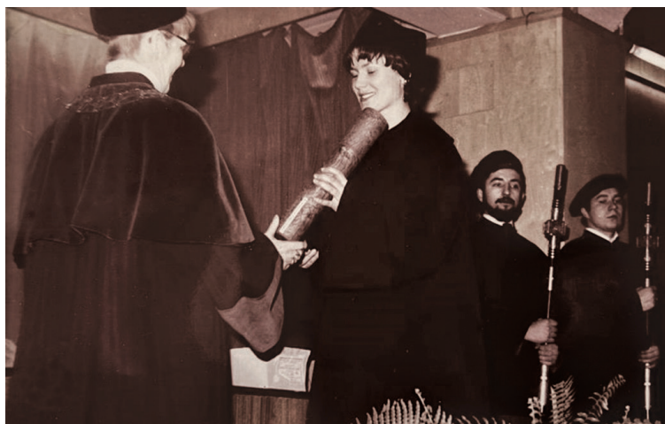
Fot. 1. Promocja doktorska