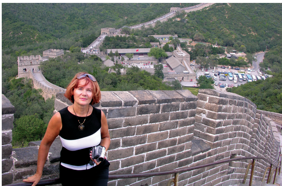
Fot. 14a. Zdjęcie z podróży

Dopełnieniem obrazu oraz osiągnięć w pracy zawodowej Profesor Krystyny Mazurek-Łopacińskiej są Jej podróże od wielu lat realizowane z pasją w czasie wolnym, które przekładają się na poznawanie świata i różnych kultur (fot. 14a–g).