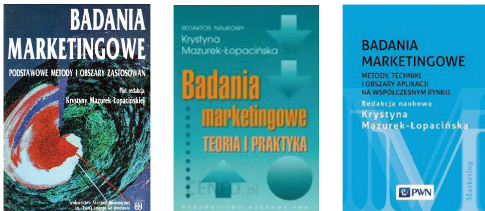
Fot. 6. Podręczniki poświęcone badaniom marketingowym

Niezwykle cenione i wartościowe są podręczniki poświęcone problematyce badań, których Pani Profesor jest redaktorką naukową oraz autorką wielu rozdziałów, a w tym: Badania marketingowe. Podstawowe metody i obszary zastosowań (Wydawnictwo Akademii Ekonomicznej we Wrocławiu, 1996) oraz Badania marketingowe. Teoria i praktyka (Wydawnictwo Naukowe PWN, 2005) i Badania marketingowe. Metody, techniki i obszary aplikacji na współczesnym rynku (Wydawnictwo Naukowe PWN, 2016) (fot. 6).