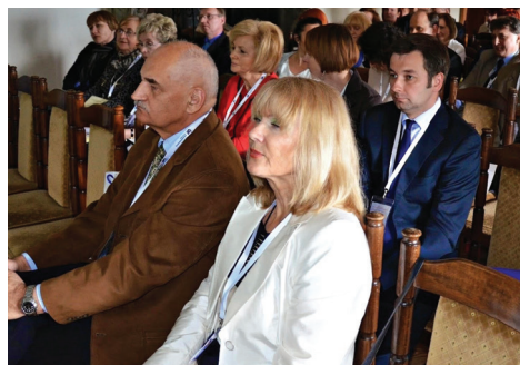
Fot. 12a-h. Uczestnicy wrocławskich konferencji z cyklu „Badania marketingowe”