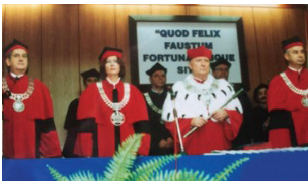
Fot. 9b. Inauguracja roku akademickiego 2003/2004

Do znaczących osiągnięć Profesor Krystyny Mazurek-Łopacińskiej należą również działania na rzecz rozwoju akredytacji środowiskowej w Polsce. Od 2002 r. była członkiem Komisji Akredytacyjnej Fundacji Promocji i Akredytacji Kierunków Ekonomicznych (FPAKE), a w latach 2006–2016 pełniła funkcję Przewodniczącej tej Komisji Akredytacyjnej, dokonując analizy jakości kształcenia kilkudziesięciu uczelni z całej Polski i przyznając w tym czasie 27 akredytacji (fot. 10).