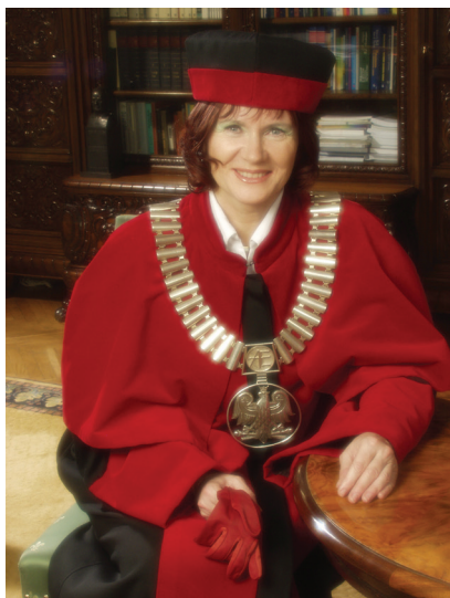
Fot. 9a. Prorektor ds. Dydaktyki

(w latach 2002–2005; fot. 9a–b) akredytację środowiskową uzyskały wszystkie kierunki prowadzone na uczelni.