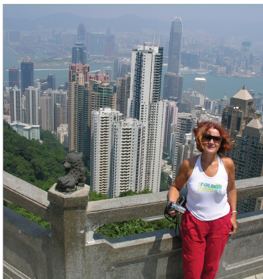
Fot. 14g. Hongkong, 2007 r.