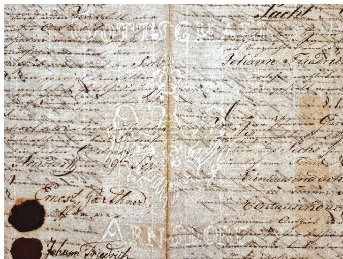
1. Znak wodny dokumentu nr 2

Format: arkusz złożony na 2 karty o wymiarach 36,1 × 23,8 cm, znak wodny z napisami: na górze „Gottschalk”, pośrodku orzeł pruski z literami FR (Friedrich Rex) na piersi, na dole „Arnsdorf”. Przy podpisach pieczęcie lakowe. Sygnatura dokumentu w zbiorach Muzeum Papiernictwa: MD 1863 AH.