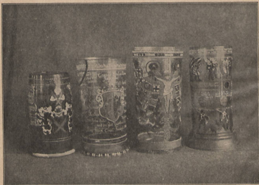
Im Eigentum der Neumarkter Kretschmerzeche befindliche altertümliche Bläser