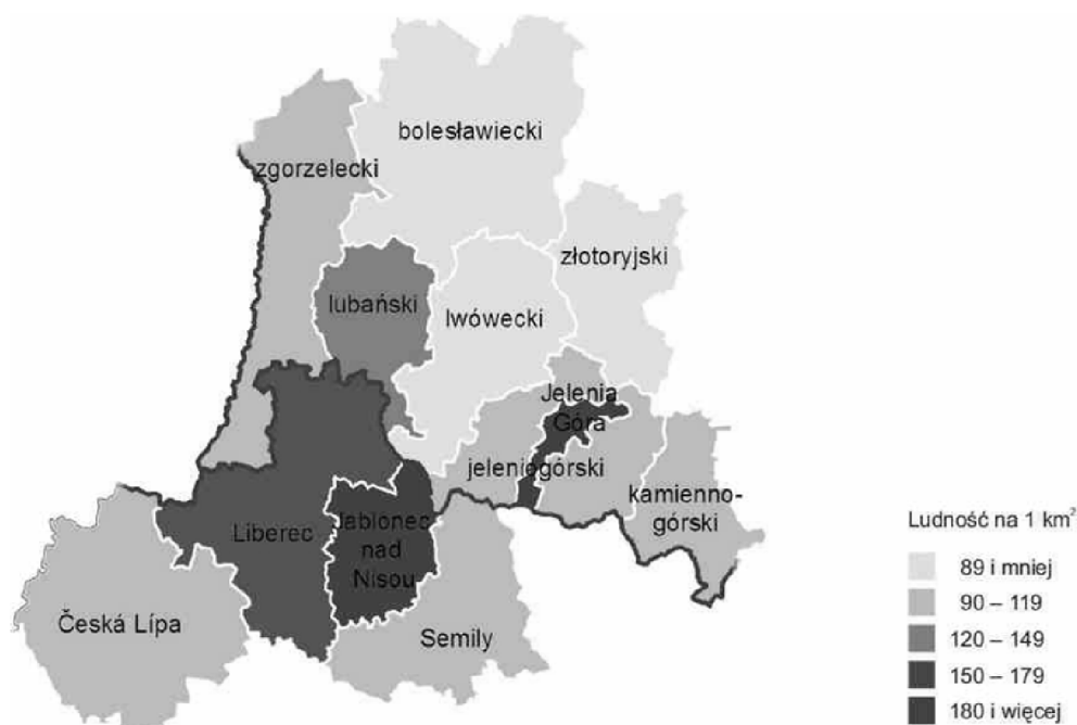
Rys. 2. Gęstość zaludnienia (stan na 31.12.2010).

Potencjał ludnościowy badanego obszaru jest niejednorodny. Z jednej strony mamy do czynienia z dużym zagęszczeniem ludności na terenie Jeleniej Góry oraz po czeskiej stronie w powiecie Jablonec nad Nisou, z drugiej zaś powiaty bolesławiecki, złotoryjski i lwówecki charakteryzują się najmniejszym współczynnikiem zaludnienia (89 i mniej osób na 1 km 2 ) w tym obszarze. Stosunkowo duże zagęszczenie ludności występuje na terenie przylegającym do pasm górskich (zob. rys. 2), dzięki temu zapewniona jest obsługa ruchu turystycznego. Struktura wiekowa społeczeństwa zamieszkującego omawiany obszar może stanowić w odległej przyszłości barierę jego rozwoju. Nie jest to odosobniony przypadek, gdyż w Europie pogłębiają się procesy starzenia społeczeństw. W częściach polskiej i czeskiej w okresie 1991-2010 zmniej-