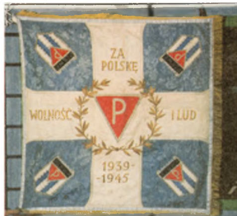
Sztandar Koła Wałbrzych