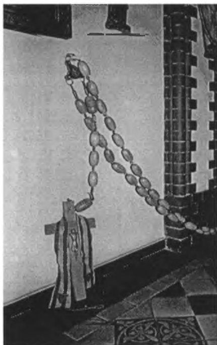
Różaniec wotyczny b. więźniów obozów koncentracyjnych (Muzeum Archidiecezjalne Wrocław)

Na Krzyżu zawieszona jest stuła wykonana z materiału ubrania więźnia obozu koncentracyjnego. Czerwony trójkąt oznaczał więźnia politycznego. Litera na trójkącie oznacza narodowość (P – Polak).