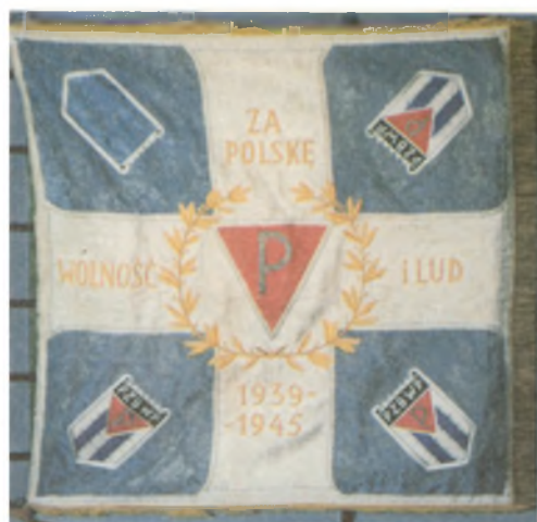
Sztandar Koła Jawor