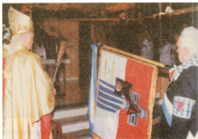
Sztandar Koła Zielona Góra