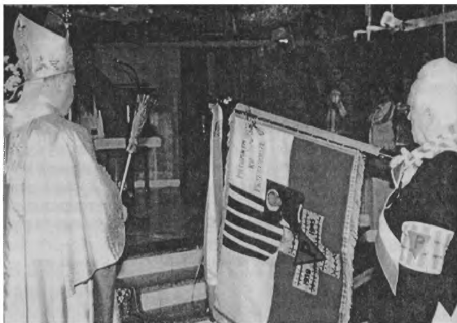
Poświęcenie sztandaru w 1995 r. Zielona Góra