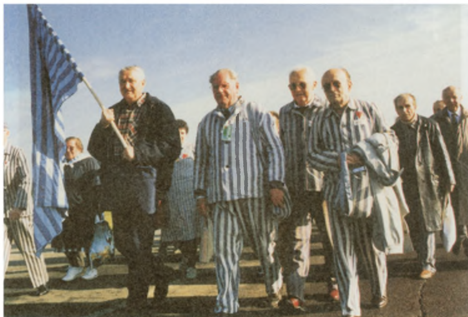
Pielgrzymka Ojca Świętego Jana Pawła II. Legnica 2.06.1997