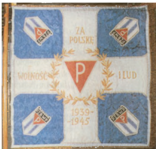
Sztandar Okręgu Dolnośląskiego