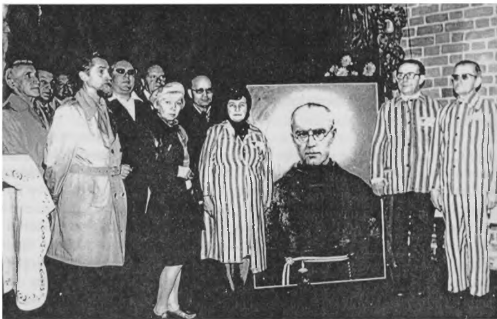
Pielgrzymka do miejsca urodzenia Maksymiliana Kolbego

Opieki nad Majdankiem. Powstanie Oddziału w jakiś sposób zrekompensowało istniejący stan rzeczy i przyczyniło się do zintegrowania ciągle jeszcze licznej rzeszy byłych więźniów hitlerowskich różnych więzień i obozów zagłady. Można było propagować pokój na świecie, protestować przeciw nowym wojnom i broni nuklearnej, przeciw ruchom neofaszystowskim, a także upamiętniać martyrologię narodu polskiego i innych narodów – ofiar zbrodniczej działalności okupanta. To tylko kilka haseł podstawowych spośród innych wymienionych w statucie. Do pracy stanęli wszyscy byli więźniowie i członkowie Oddziału, nie szczędząc wysiłku ani czasu. Wkrótce wyniki tej działalności potwierdziły, że słowo tytaniczne nie jest gołosłowne.