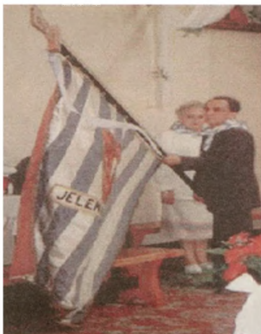
Sztandar Koła Jelenia Góra