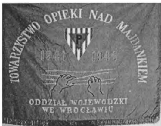
Sztandar Wrocławskiego Towarzystwa Opieki nad Majdankiem