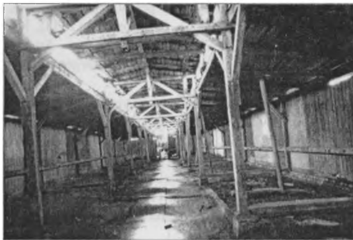
Obóz Auschwitz- -Birkenau. Wnętrze baraku. Stan w roku 1981

Znamienne były powitalne przemówienia komendanta obozu koncentracyjnego Auschwitz do przybywających więźniów: Przyjechaliście tutaj nie do sanatorium, lecz do obozu koncentracyjnego, w którym więzień żyje przeciętnie 3 miesiące. Żydzi i księża krócej. Nie jesteście ludźmi, jesteście numerami. Jeżeli komuś uda się przeżyć obóz, niech nie sądzi, że po wojnie zostanie zwolniony. Stąd możecie wyjść tylko przez komin krematorium.