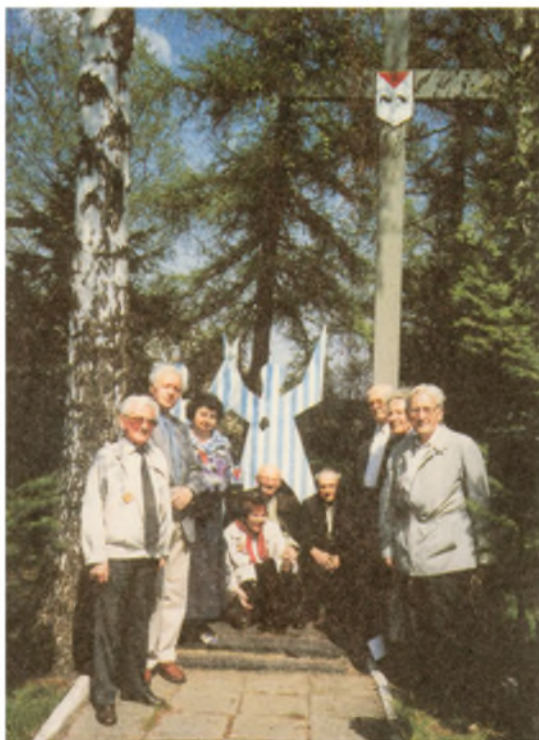
Podobóz KL Gross-Rosen – Fünfteichen (Jelcz) 19.04.2000