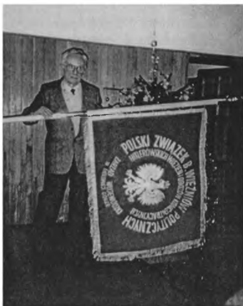
Sztandar BZBWPiOK w Zielonej Górze. Pierwsza strona sztandaru