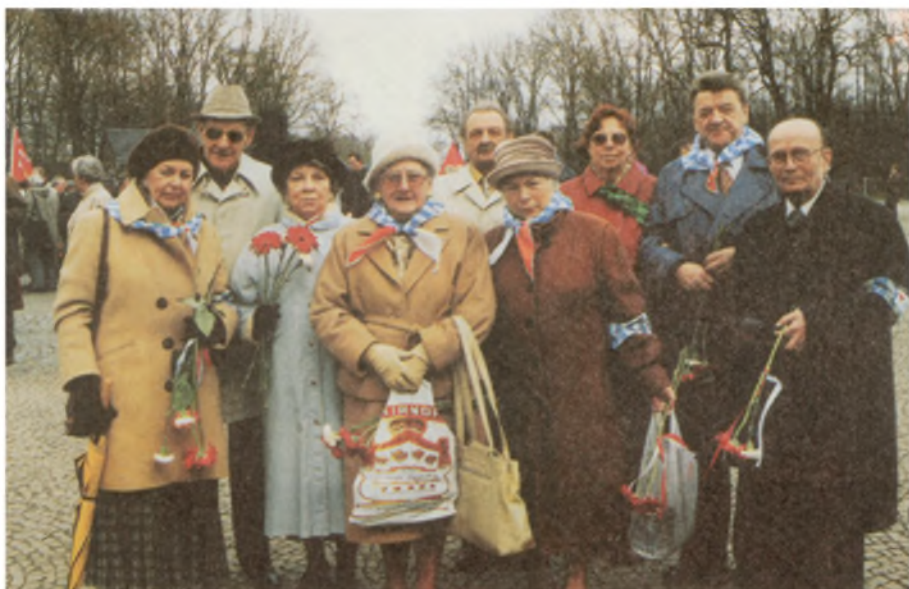
53. rocznica oswobodzenia obozu KL Buchenwald 10–14.04.1998