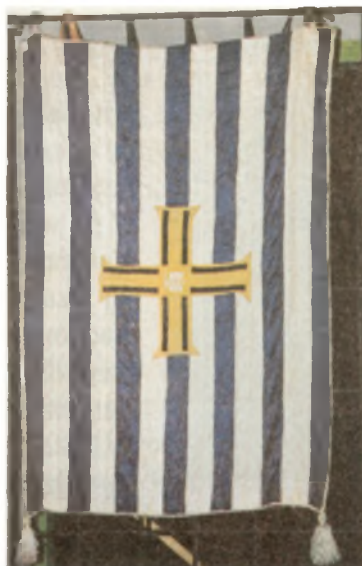
Sztandar Koła Dzierżoniów