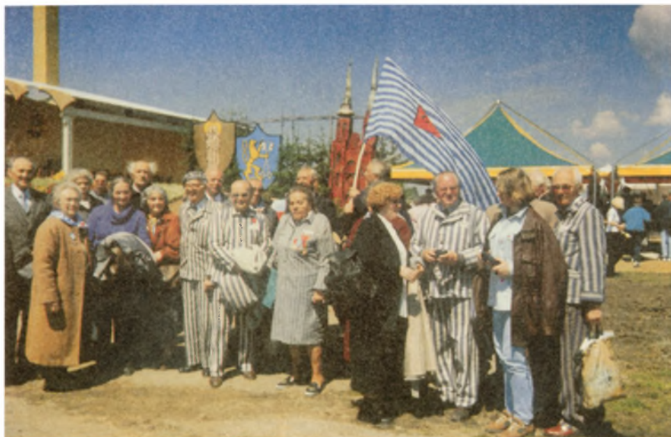
Pielgrzymka Ojca Świętego Jana Pawła II. Legnica 2.06.1997