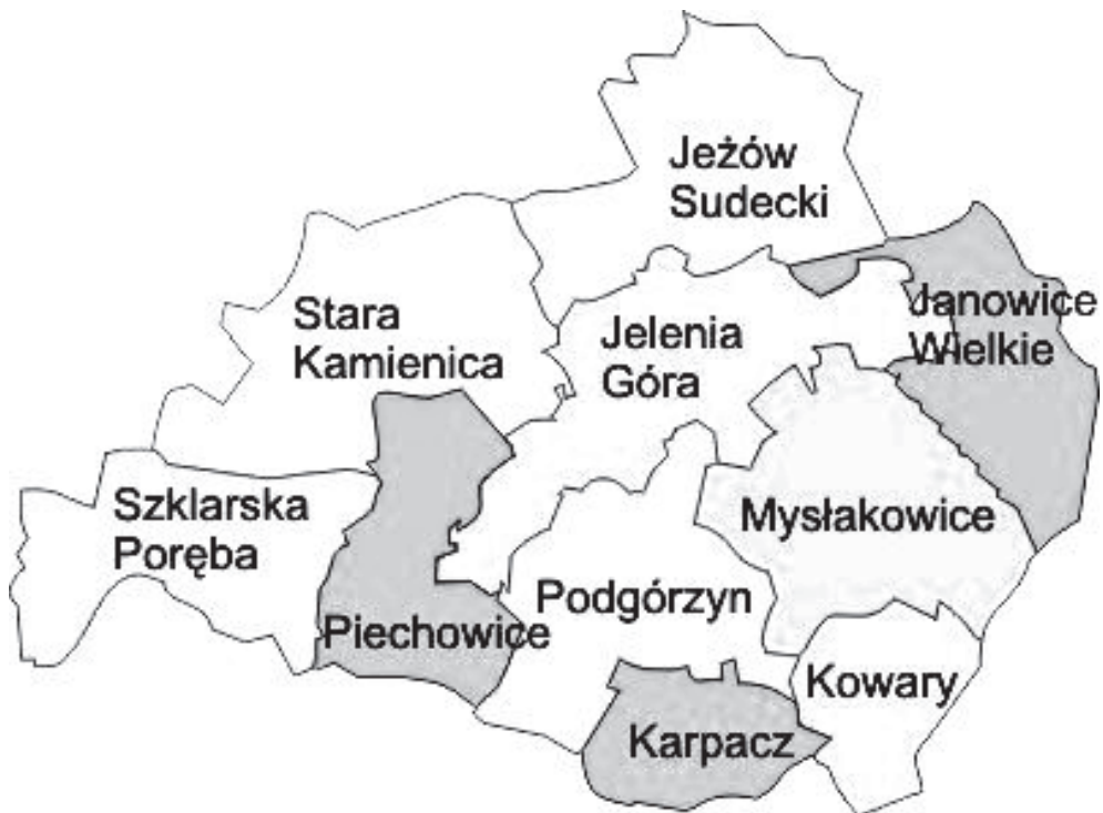
Rys. 1. Podział administracyjny powiatu jeleniogórskiego