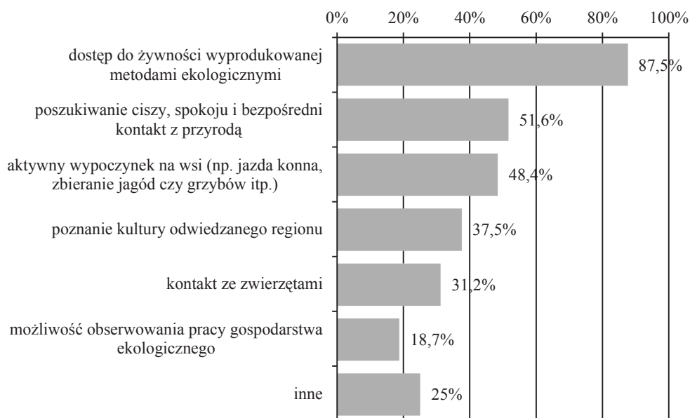
Rys. 1. Motywy wyboru wypoczynku w gospodarstwie ekoagroturystycznym