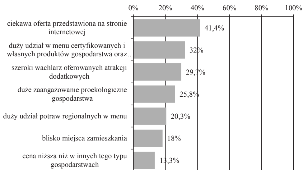
Rys. 2. Motywy wyboru konkretnego gospodarstwa ekoagroturystycznego