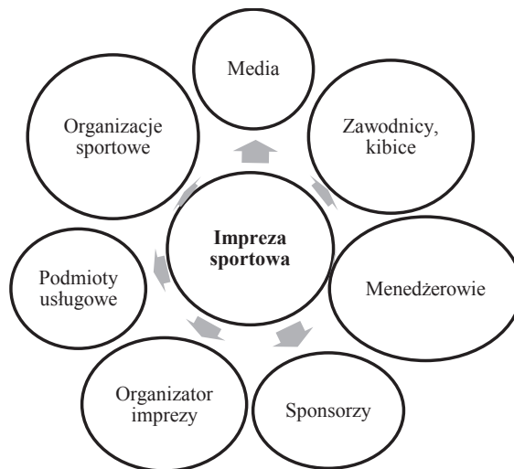
Rys. 2. Podmioty imprezy sportowej

Na rysunku 2 przedstawiono podmioty imprezy sportowej, które wymagają zabezpieczenia logistycznego.