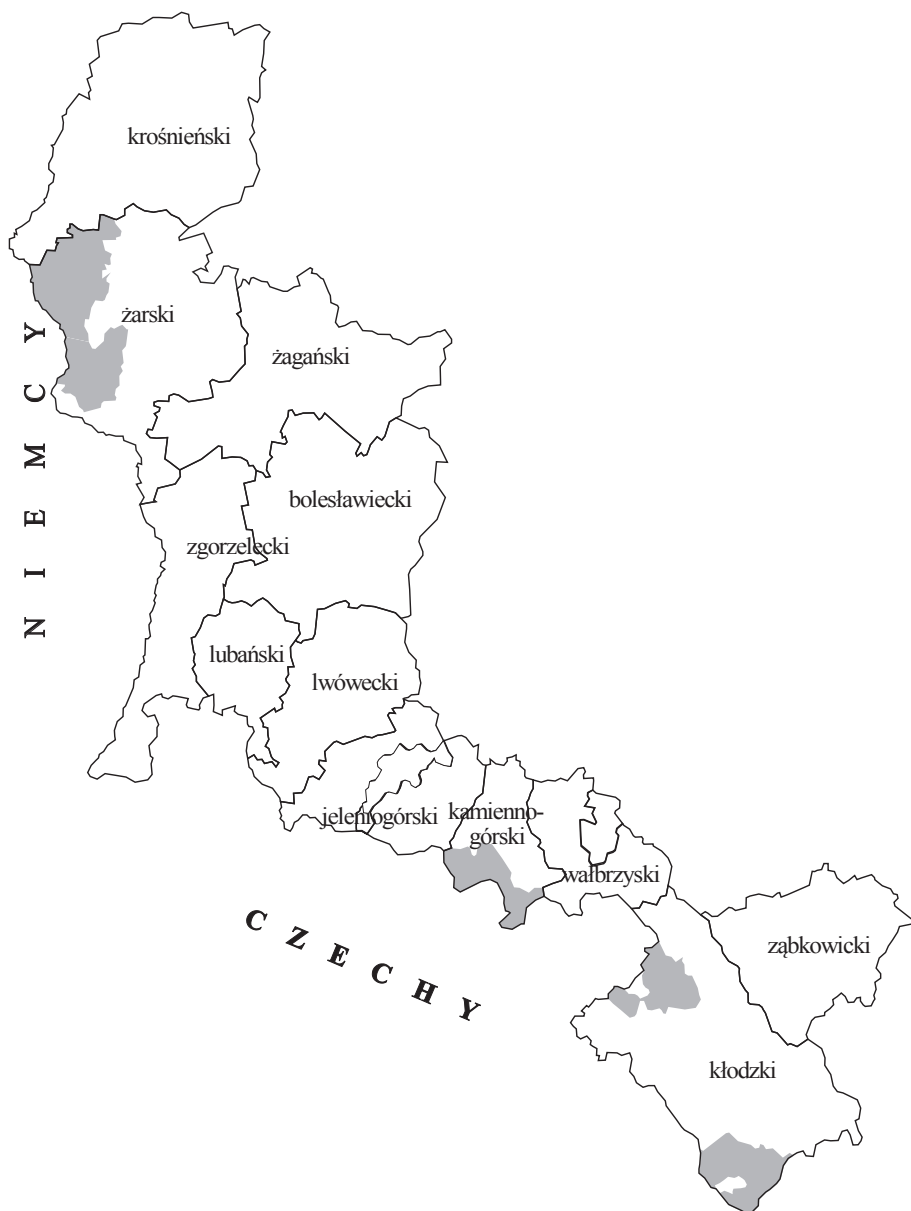
Rys. 1. Przygranicze według powiatów z lokalizacją badanych gmin