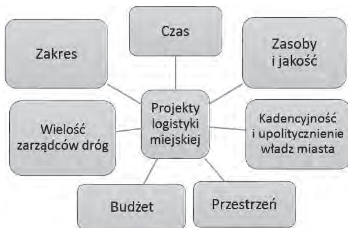
Rys. 1. Czynniki ograniczające projekty logistyki miejskiej