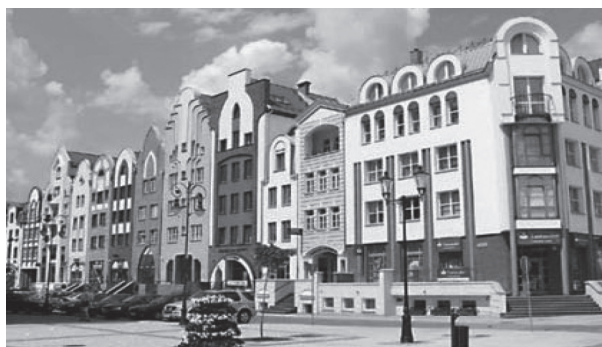
Rys. 6. Dzielnica Stare Miasto – po renowacji