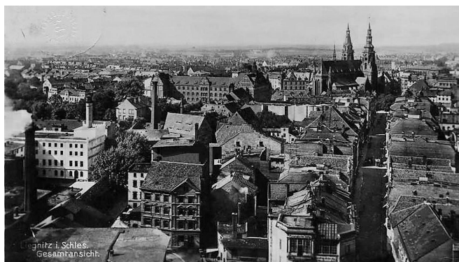
Rys. 3. Dzielnica Stare Miasto – przed wojną

Oceniając odbudowę legnickiej starówki, warto się zastanowić, czy obecna architektura, która powstała w miejsce wyburzonej zabudowy historycznej, oddaje prawdziwy charakter tego miasta, czy być może nadaje mu nowy wyraz [Haisig 1997; Lubocka-Hoffmann 2004].