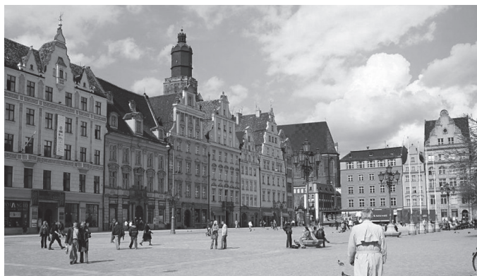
Rys. 2. Zachodnia pierzeja Rynku – po renowacji