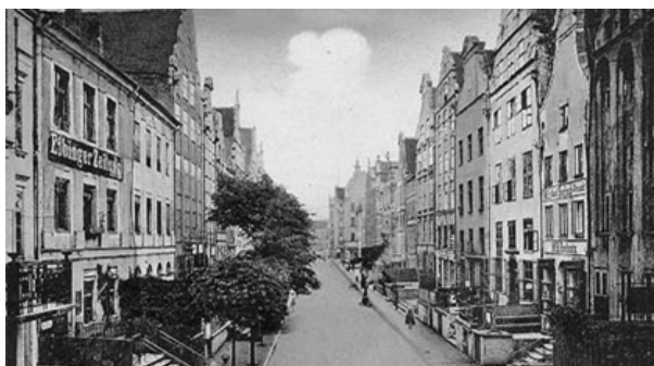
Rys. 5. Dzielnica Stare Miasto – przed wojną

Przywrócono Staremu Miastu funkcję reprezentacyjną. Do nowego Ratusza powróciła siedziba władz miejskich, a dzielnica stała się centrum kulturalnym miasta. Retrowersją została objęta cała dzielnica Stare Miasto, stopniowo obejmowano kolejne fragmenty. Zalecenia konserwatora dotyczyły zarówno szerszych aspektów (układ komunikacyjny), jak i mniejszych zagadnień (wygląd oficyn, rodzaj przedproży, typ nawierzchni i aranżacja zieleni) [Lubocka-Hoffmann 2004].