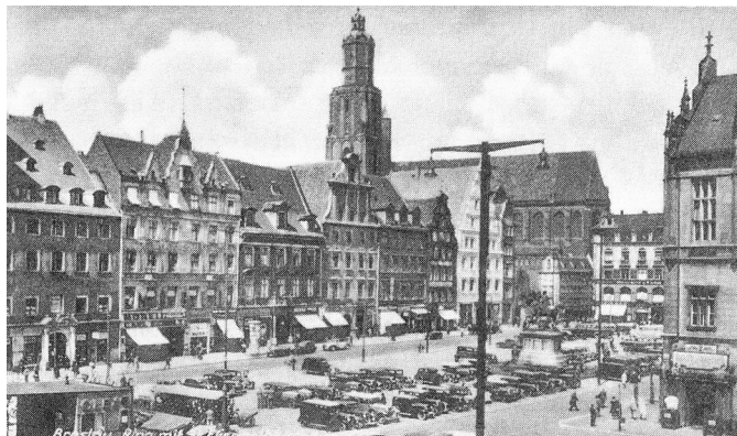
Rys. 1. Zachodnia pierzeja Rynku – przed wojną

Nadal jednak wyróżniającą cechą odbudowy wrocławskiej starówki pozostaje skuteczność ochrony autentycznej zabytkowej substancji. Należy też docenić zachowanie detalu we wnętrzach parteru kamienic przyrynkowych [Lubocka-Hoffmann 2004; Dudek 2013].