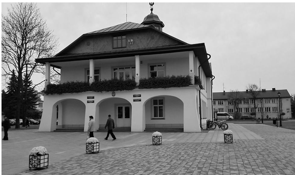
Fot. 1. Zrewitalizowany budynek, w którym mieści się siedziba Urzędu Gminy Narol, wraz z fragmentem placu (przestrzeń publiczna)