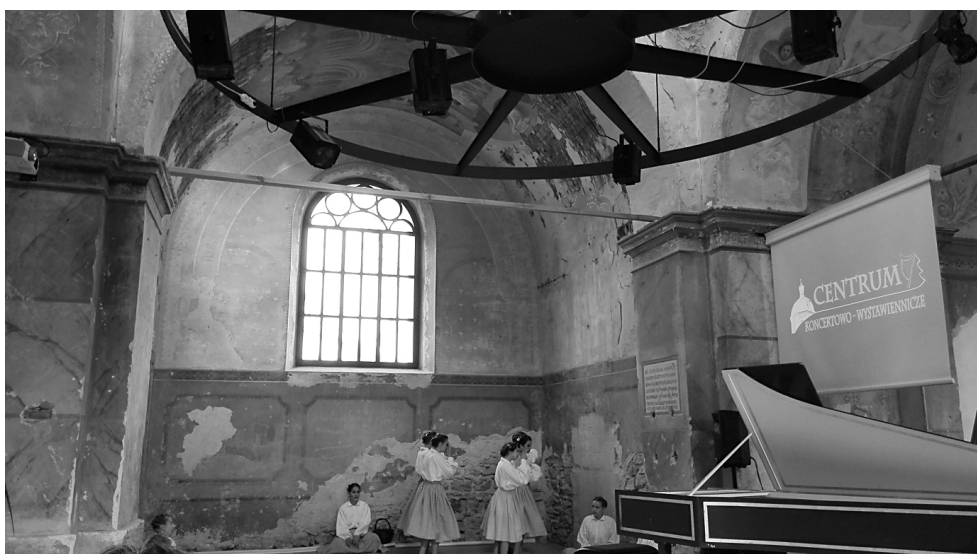
Fot. 2. Centrum Koncertowo-Wystawiennicze w dawnej cerkwi w Krupcu. Występ dla uczestników projektu DoM, w czasie wizyty studyjnej