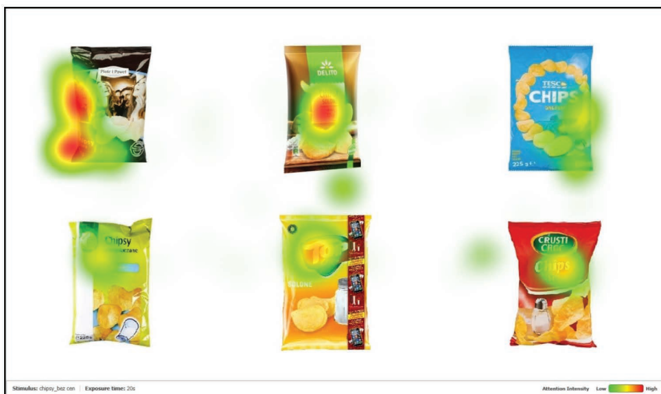
Rys. 1. Mapa cieplna dla kategorii „chipsy”

sze skupienie wzroku w jednym punkcie jest oznaczane intensywną ciepłą barwą, a chłodne kolory oznaczają krótszy czas skupienia uwagi. Miejsca niezakolorowane symbolizują fragmenty, które zostały całkowicie pominięte przez respondenta. Nie musi to oznaczać, że nic w tych obszarach nie widział (mógł spojrzeć na nie przez bardzo krótki czas albo też ruch gałek ocznych mógł nie zostać wykryty przez eye tracker ). Na jej podstawie nie można zatem wnioskować o tym, czy prezentowane materiały zostały przez badanego zrozumiane [Schall, Bergstrom 2014, s. 15-16]. Szczególnym przypadkiem mapy cieplnej jest jej wersja odwrócona, ukazująca wyłącznie te miejsca, na których osoby badane skupiły swój wzrok (pozostałe obszary są zaciemnione).