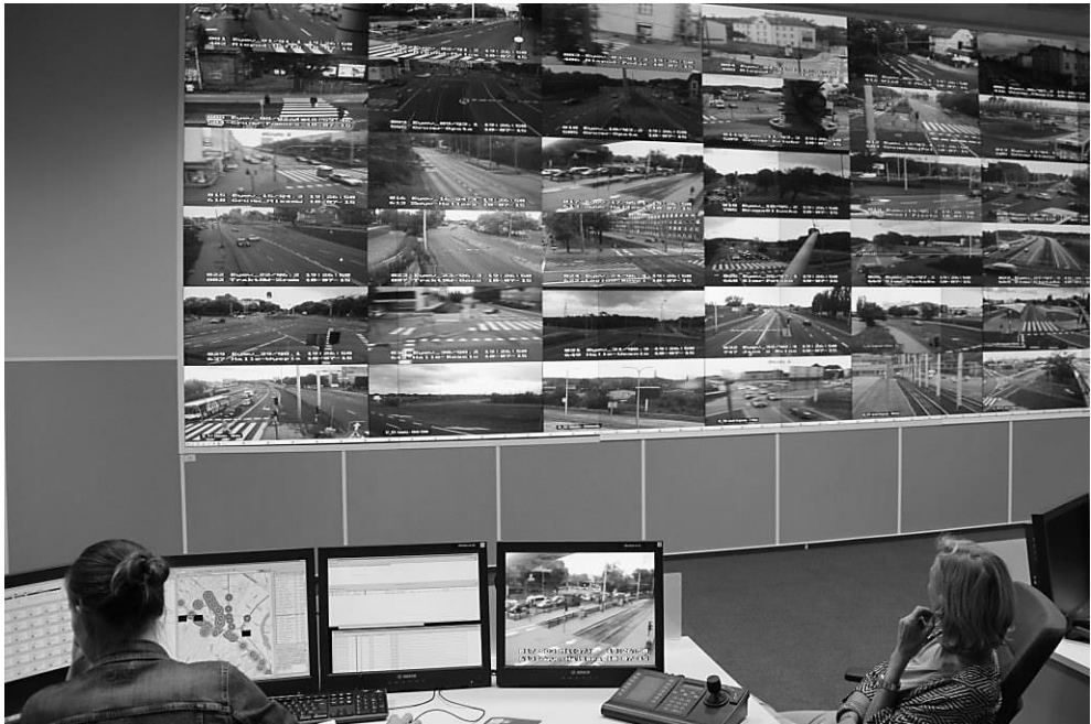
Fot. 1. Sala operatorska w Centrum Zarządzania Ruchem Systemu TRISTAR w Gdańsku

System TRISTAR jest obsługiwany przez dwa obszarowe centra zarządzania, połączone szybkim łączem światłowodowym: centrum w Gdyni obejmuje Gdynię, a centrum w Gdańsku – Sopot i Gdańsk (por. fot. 1). Zarządzanie ruchem na obszarze Trójmiasta z każdego centrum jest zależnie od kompetencji określonego operatora. Dane o ruchu dotyczące całego Trójmiasta są gromadzone w centralnej bazie danych – tzw. hurtowni danych.