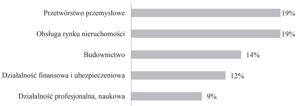
Rys. 3. Nakłady inwestycyjne według sekcji PKD w 2014 r.

Najwyższą wartość nakładów inwestycyjnych zgodnie z podziałem na sekcje PKD ponoszą przedsiębiorstwa działające w sekcji Przetwórstwo przemysłowe (19% ogółu nakładów inwestycyjnych), Obsługa rynku nieruchomości (19%), Budownictwo (14%), Działalność finansowa i ubezpieczeniowa (12%) oraz Działalność profesjonalna (9%). Przedsiębiorstwa działające w tych pięciu sekcjach ponoszą łącznie blisko 75% całości nakładów inwestycyjnych w małych i średnich przedsiębiorstwach z kapitałem zagranicznym (rys. 3).