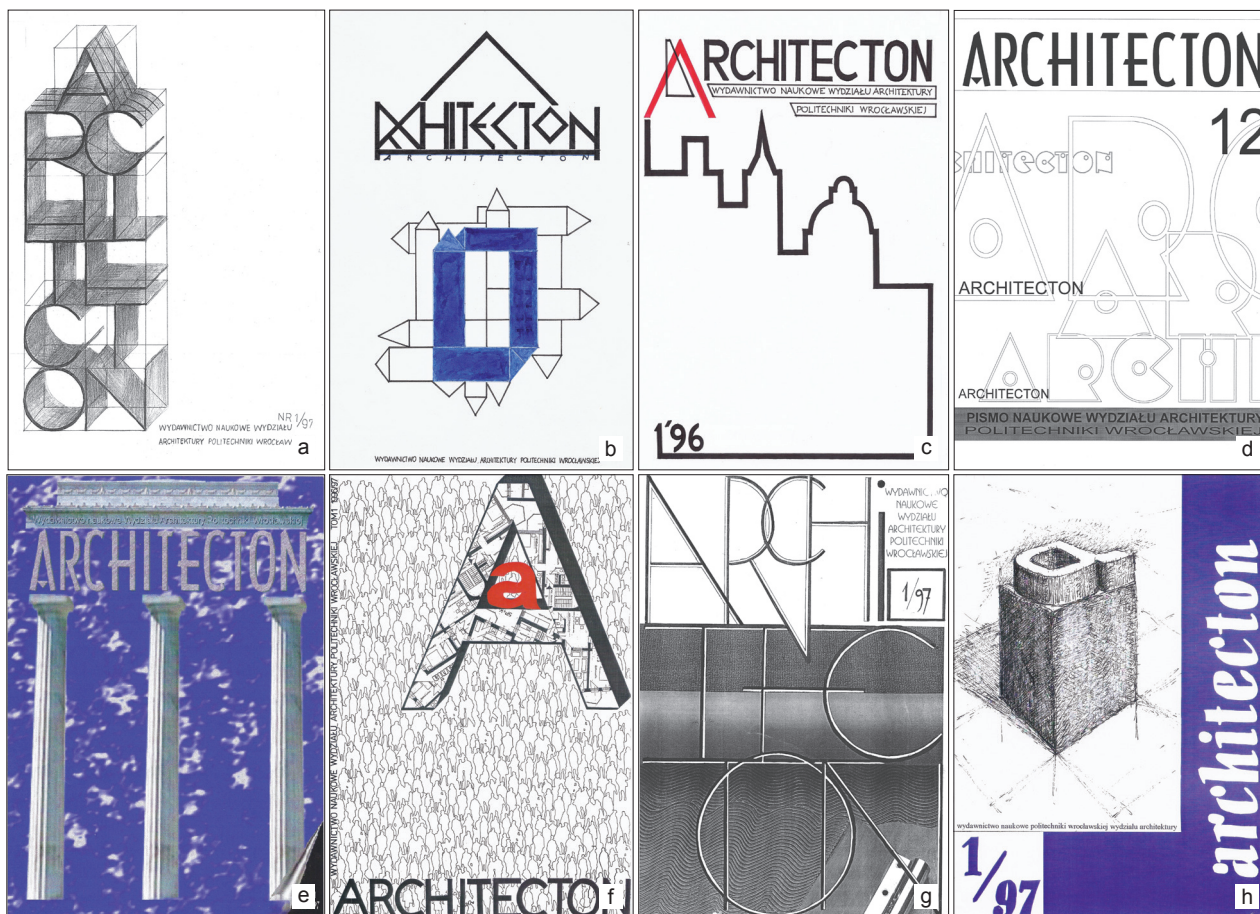
II. 1. Prace studenckie zgłoszone do konkursu