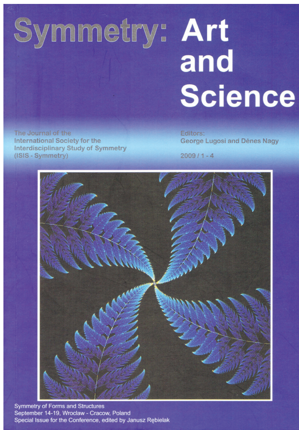
Il. 1. Okładka publikacji prezentującej materiały z konferencji „Symmetry of Forms and Structures”