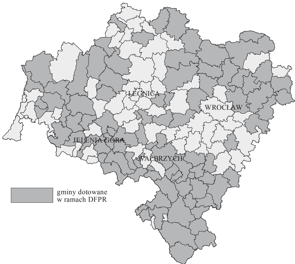
Rys. 1. Rozmieszczenie gmin dotowanych w ramach Dolnośląskiego Funduszu Pomocy Rozwojowej w latach 2009-2016