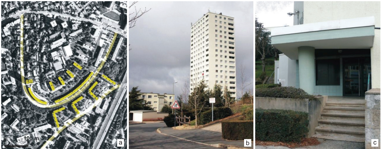
Il. 1. Saint-Étienne, osiedle Beaulieu – Le Rond-Point: a) plan sytuacyjny (fragment; opracowanie własne na podstawie Google Maps; data dostępu: 20.08.2014); b) wysokościowiec; c) detal wejścia