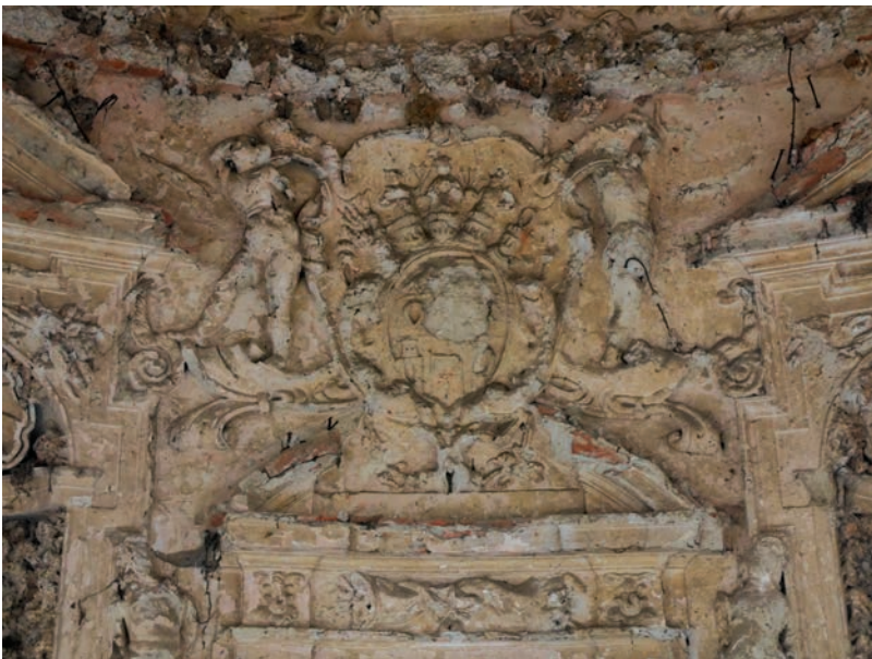
Herb rodziny Herbersteinów z wnętrza grotty w Gorzanowie

Coat of arms of Herberstein family from the Gorzanów grotto interior