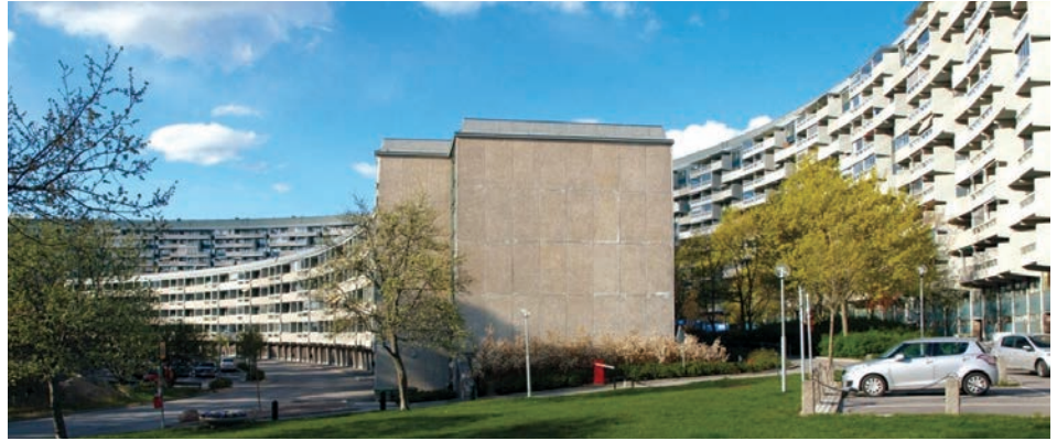
Il. 4. Täby, zespół Grindtorp