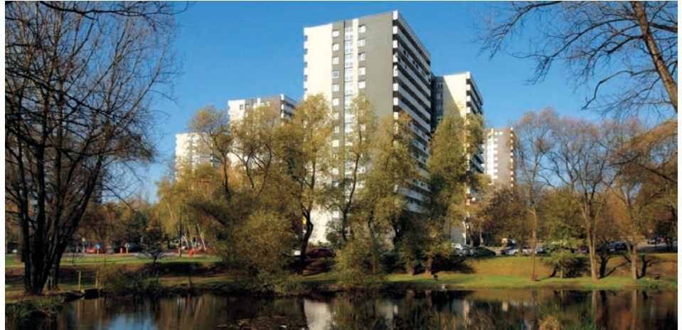
Fig. 6. Katowice, Tysiąclecie housing estate

ziomych linii płyt ograniczających balkony. Białe, gładkie wykończenie balkonów kontrastuje z ciemnymi pasami okien (il. 5b). Podobna zasada zastosowana została przy realizacji dominujących nad całym osiedlem pięciu wysokościowców. Znane jako „kukurydze” 18–26-kondygnacyjne budynki powstały na styku Tysiąclecia Dolnego i Górnego. Ich charakterystyczne bryły 13 są wynikiem zastosowania rzutu zbliżonego do 8-ramiennego gwiazdy i balkonów założonych na wycinku koła (il. 5c). Jasne pasy pełnych płyt balustrad tworzą regularny rytm wyraźnych poziomych podziałów. W ten sposób ukształtowana została jedna z ważniejszych cech wpływających na charakter osiedla (il. 6) [11, s. 181–187], [14, s. 409–410].