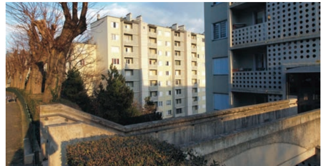
Il. 2. Saint-Étienne, osiedle Beaulieu – Le Rond-Point

Täby to miasto satelitarne Sztokholmu, które zachowało niezależność administracyjną. Położone jest w odległości około 17 km na północ od centrum stolicy Szwecji. Współcześnie obejmuje powierzchnię 61 km 2 i zamieszkiwane jest przez 67 tysięcy osób 8 . Täby doświadczyło gwałtownego rozwoju struktury miejskiej w latach 60. i 70. XX w. Wiązało się to z zapoczątkowaną w latach 40. XX w. realizacją planu deglomracji Sztokholmu i budowy nowych jednostek satelitarnych. Podobnie jak ośrodki kształtowane według koncepcji ABC powstało wzdłuż linii kolejowej prowadzącej do stolicy, a lokalizacja dworca stała się załącznikiem nowego centrum miasta. Jednak struktura ośrodka, ze względu na brak zaplecza zapewniającego zatrudnienie mieszkańcom, nie w pełni