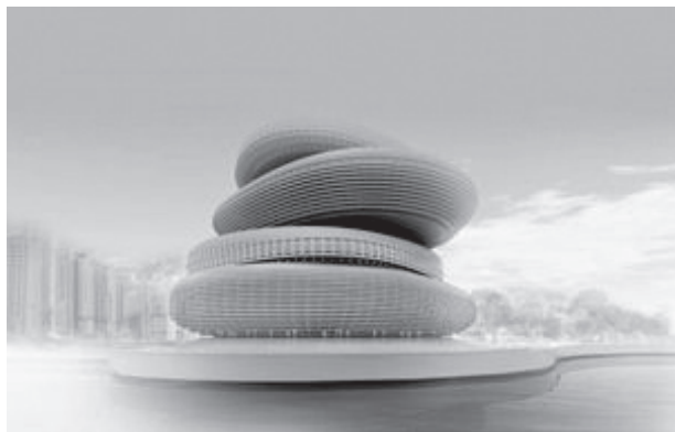
Il. 3. Praca konkursowa, autor: PRAUD

Fig. 4. Competition entry; author: Peter Ruge Architekten [14]