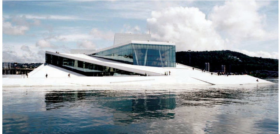
Fig. 1. Opera house in Oslo by architectural studio Snøhetta as the city square (Snøhetta Archive, photo © Jens Passoth)

Współcześnie liczne programy rewitalizacji terenów poprzemysłowych starają się powtórzyć „efekt Bilbao” 4 . Projekt Muzeum Guggenheima wprowadził nowe wartości kulturowe mające wpływ na życie społeczne i ekonomiczne miasta. Spektakularna, ekstrawagancka architektura budynku stała się jednym z najczęstszych powodów licznych wizyt turystów [5]. Muzeum zostało wykorzystane jako narzędzie rewitalizacji zdegradowanej przestrzeni. Po dekadzie od jego otwarcia miasta na całym świecie budują muzea w nadziei na powtórzenie sukcesu Guggenheima jako motoru rozwoju turystyki, rewitalizacji i lokalnej dumy [7].