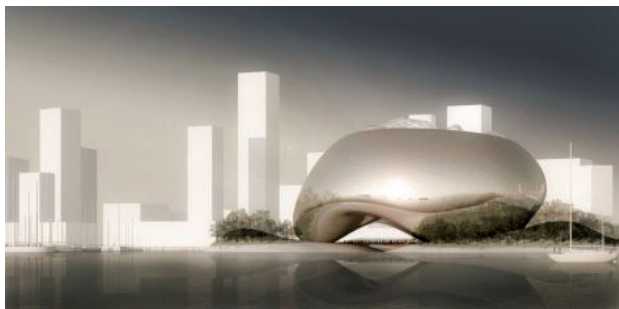
Il. 2. Praca konkursowa, autor: Volgemut Architects

Fig. 2. Competition entry; author: Volgemut Architects