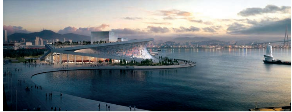
Fig. 5. The winning competition entry; author: Snøhetta and Tegmark (Snøhetta Archive, © Snøhetta and Tegmark)

Il. 5. Zwycięska praca konkursowa, autor: Snøhetta and Tegmark (Snøhetta Archive, © Snøhetta and Tegmark)