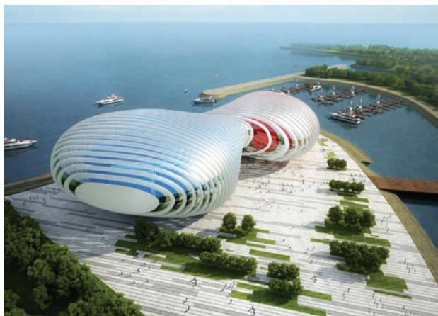
Il. 4. Praca konkursowa, autor: Peter Ruge Architekten [14]

Dużo mniej popularne są kompozycje geometryczne (14 z 45 analizowanych prac konkursowych). W całym konkursie rzadko występują wartości takie, jak symetria, ortogonalność, monotonia, które są charakterystyczne