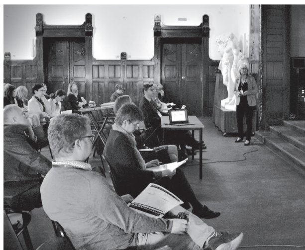
Il. 4. Polsko-brytyjska konferencja poświęcona BPE na Wydziale Architektury Politechniki Wrocławskiej, maj 2016

Polish housing is likely to change significantly over the years to 2030. Both changing standards and regula-