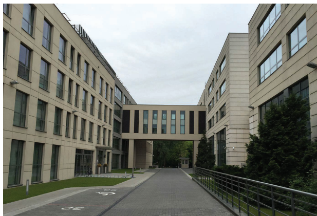
Il. 5. Sąd Gospodarczy przy ul. Czerniakowskiej w Warszawie