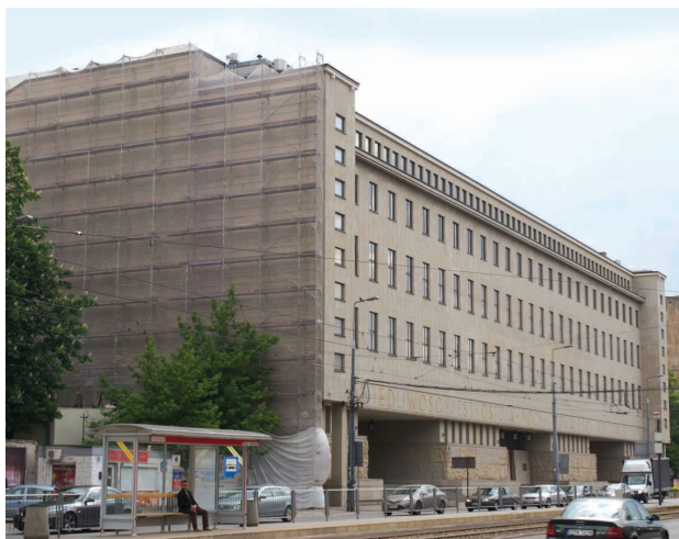
Il. 2. Sąd przy al. Solidarności w Warszawie