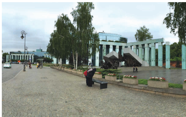
Il. 8. Pomnik Powstania Warszawskiego został podkreślony przez zastosowanie kolumnady. Warto zwrócić uwagę na kontrast kolorystyczny między budynkiem sądu a rzeźbą