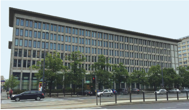
Il. 4. Budynek sądu przy ul. Marszałkowskiej 82 (fot. K. Piętka-Rakowiecka, 2015)