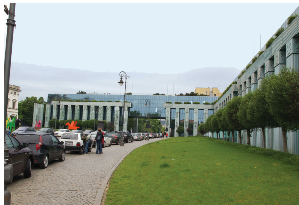
Il. 6. Budynek Sądu Najwyższego przy placu Krasieńskich w Warszawie (fot. K. Piętka-Rakowiecka, 2015)