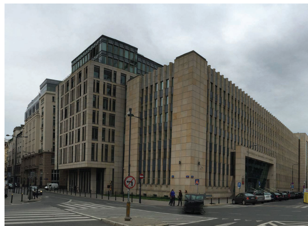
Il. 9. Budynek Naczelnego Sądu Administracyjnego w Warszawie

W latach 2006–2009 trwały prace nad rozbudową – według projektu warszawskiej pracowni S.A.M.I. – o nową część mieszczącą Wojewódzki Sąd Administracyjny [12]. Budynek liczy ponad 9500 m 2 powierzchni użytkowej. Kubaturę tworzą trzy bryły, jedna pięciokondygnacyjna i dwie dziewięciokondygnacyjne. Wejście główne do obiektu zlokalizowane jest od ul. Boduena. Forma kolumnady zwieńczonej napisem wrytym w kamieniu bezpośrednio nawiązuje do gmachu Sądu Grodzkiego przy al. Solidarności. Projektanci w ten sposób opisują architekturę budynku: Dwie ostatnie kondygnacje budynku wycofano do lica dwukondygnacyjnej bazy i wykończono fasadami przeszklonymi z kamiennymi i szklanymi aplikacjami. Budynek od strony ulicy Jasnej i Boduena ukształtowano w linii przebiegu pierzei ulicy. Od strony ulicy Szpitalnej, wysuwająca się bryła zamyka swym widokiem Plac Powstańców Warszawy [13]. Nowo powstała część sądu niczym się nie wyróżnia na tle innych budynków. Jest poprawna, ale nie porywająca (il. 9). Wpisuje się w kontekst, jednak nie niesie ze sobą żadnej