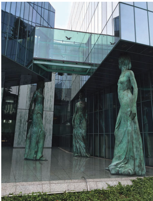
Il. 7. Kariatydy widoczne od strony ul. Nowiniarskiej

Fig. 7. Caryatids on Nowiniarska Street