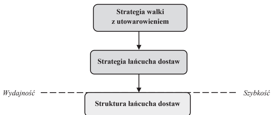
Rys. 2. Strategia walki z utowarowieniem a strategia łańcucha dostaw