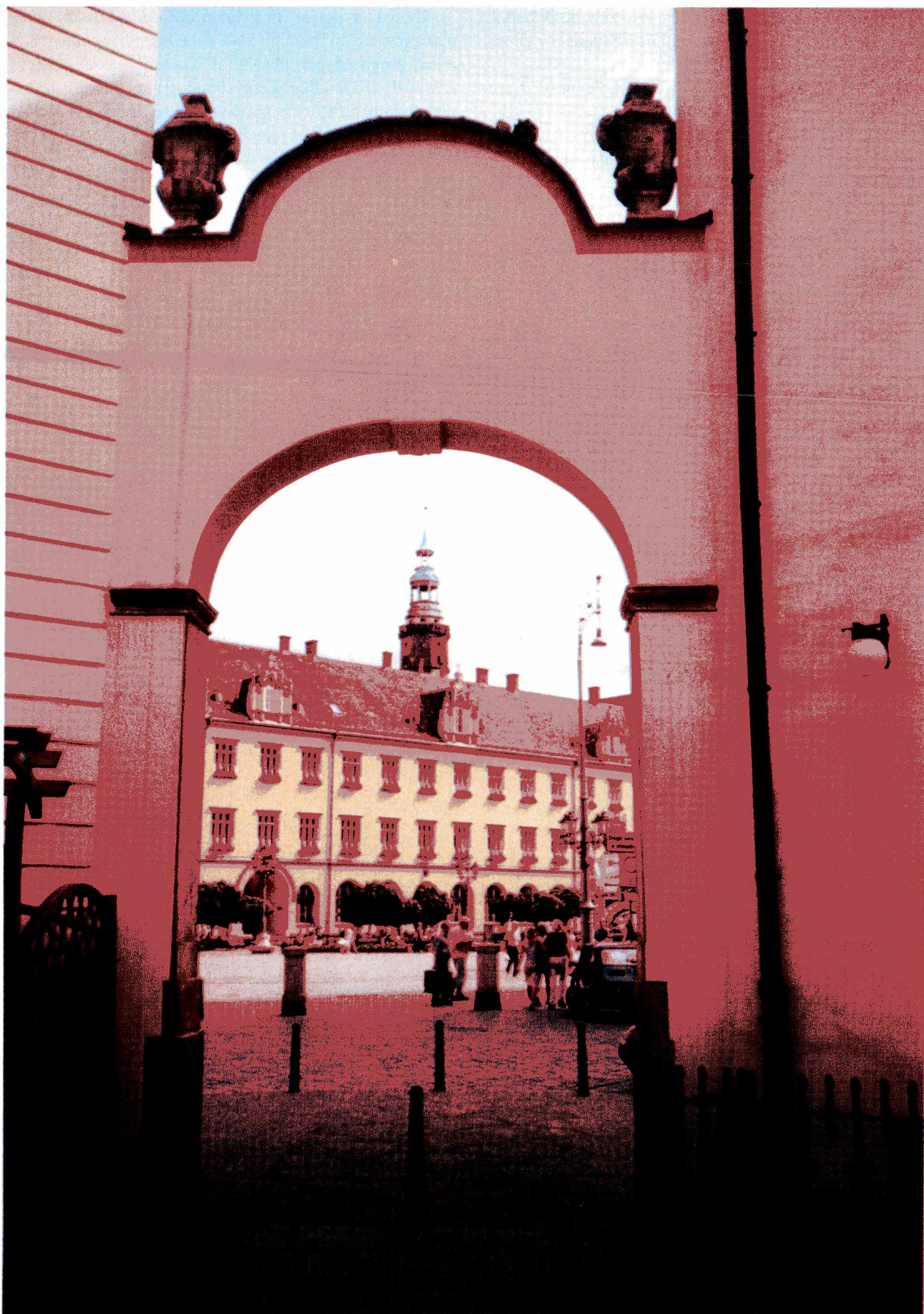
Krzysztof Hejmej. Bez tytułu (praca wyróżniona) Krzysztof Hejmej. Untitled (work distinguished)