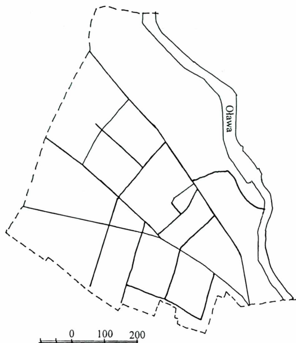
Ryc. 1. Schemat ulic