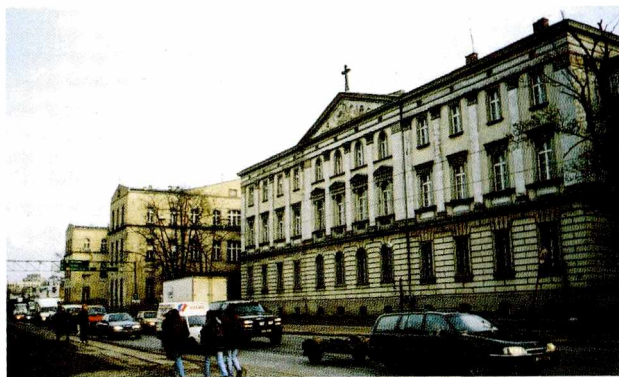
Ryc. 2. Ulica Kazimierza Pułaskiego Fig. 2. Kazimierz Pułaski street

ność według hierarchii ważności jest następująca: plac Zgody, Szpital im. T. Marciniaka – dominanta oraz teren przed nim, plac przed szpitalem o.o. bonifratrów z dominantą budynku szpitala oraz subdominantą – kościołem św. Łazarza, placiki przy zbiegu ulic Komuny Paryskiej i Kościuszki oraz Traugutta i Kościuszki, ulica Traugutta, ulica Kościuszki.