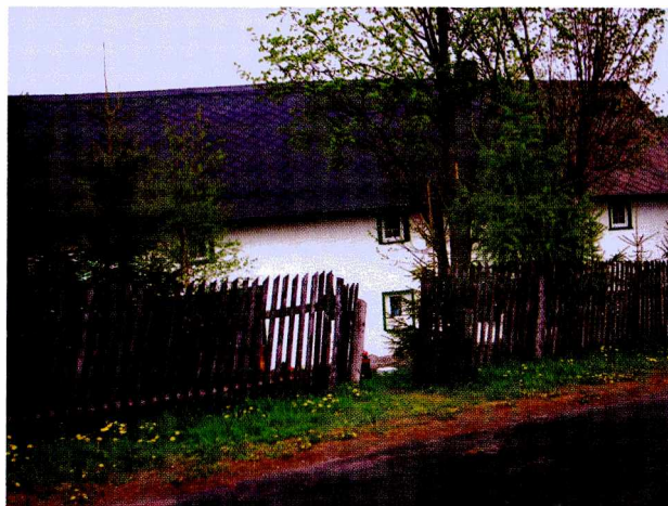
Ryc. 4. Gospodarstwo agroturystyczne „Nad Potokiem” w Gniewoszowie (bielony budynek murowany z dachem krytym łupkiem)

Fig. 3. “Sudecka Chata”, an agricultural tourism farm (wooden residential building with a mansard roof, pediment and dormer windows)