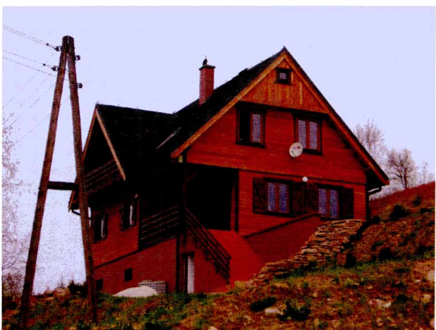
Ryc. 5. Współczesny dom mieszkalny z elementami sudeckiego regionalnego stylu architektonicznego w Mostowicach

Fig. 4. “Nad Potokiem”, an agricultural tourism farm in Gniewoszów (white-painted brick-building with slated roof)