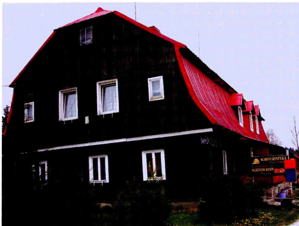
Ryc. 3. Gospodarstwo agroturystyczne „Sudecka Chata” w Lasówce (drewniany budynek mieszkalny z mansardowym dachem, naczółkiem i lukarnami)

Fig. 3. “Sudecka Chata”, an agricultural tourism farm (wooden residential building with a mansard roof, pediment and dormer windows)