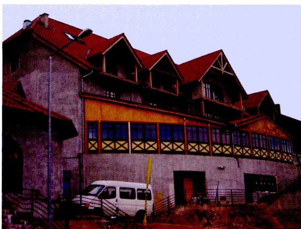
Ryc. 6. Obiekt turystyczny „Szarotka” w Zieleniecu nawiązujący do cech stylu regionalnego. Skala i kubatura budowli (120 miejsc noclegowych), niewspółmierna w stosunku do najbliższego architektonicznego otoczenia, stanowi wyraźną dominantę

Fig. 5. A contemporary residential house with elements of the Sudety regional architectonic style in Mostowice