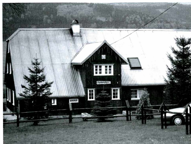
Ryc. 2. Jedno z gospodarstw agroturystycznych w Lasówce

Cechy sudeckiej architektury regionalnej, z różnym powodzeniem, wykorzystywane są również w budowlach wchodzących w skład turystycznej infrastruktury gastronomiczno-noclegowej. Jednym z zagrożeń dla zachowania odrębności architektonicznej górskiego regionu nie jest jednak, zdaniem autorki niniejszego opracowania, wprowadzanie współczesnej, „neutralnej” architektury, również turystycznej, lecz nieudolne kopiowanie rodzimego stylu regionalnego, które prowa-