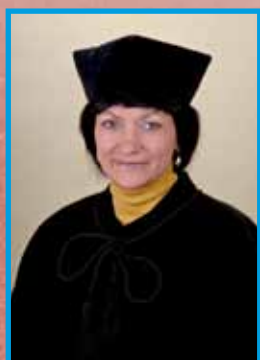
z-ca dyrektora Instytutu

stopnia studiów stacjonarnych i niestacjonarnych. Jest to najmłodszy kierunek studiów na Wydziale Wychowania Fizycznego i Fizjoterapii Politechniki Opolskiej, uruchomiony w 2001