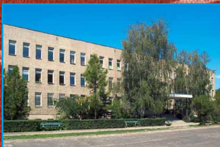
obiekt przy ul. Działkowej

Jednostka cieszy się ugruntowaną pozycją wśród podobnych wydziałów na innych uczelniach i akademiach wychowania fizycznego w kraju, o czym świadczą uzyskane oceny parametryczne. Jest także cennym partnerem dla wielu zagranicznych ośrodków naukowych, z którymi współorganizujemy liczące się w świecie naukowym konferencje, przygotowujemy wspólne projekty i publikacje. Przedstawiciele zagranicznych uczelni, zwłaszcza z sąsiednich Czech i Słowacji, wzmacniają naszą kadrę naukową, a nasi pracownicy realizują w partnerskich ośrodkach swoje prace naukowe, osiągając kolejne stopnie naukowej kariery. Wydział, jako nowoczesna jednostka, pochwalić może się świetnie rozwijającą się współpracą z innymi europejskimi ośrodkami, tu warto wymienić uczelnię La Coruna w Hiszpanii, w Braganicy (Portugalia), czy w rumuńskiej Suczawie, z którymi w ramach programu Erasmus realizowane były wymiany studentów i pracowników. Z uczelnią portugalską finalizowany jest proces uzyskiwania podwójnych dyplomów dla absolwentów. Bardzo ciekawie przedstawia-