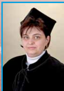
z-ca dyrektora Instytutu