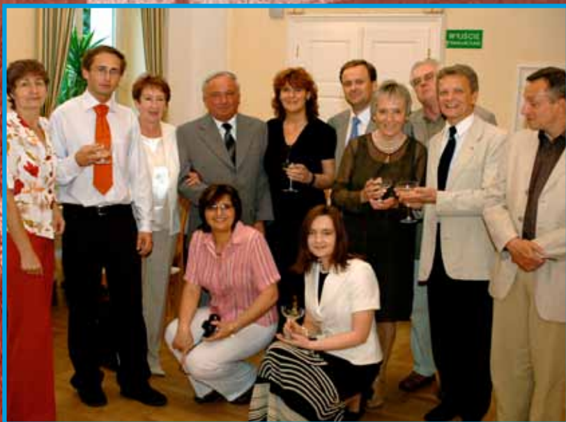
obchody 10-lecia WWFif

Niewątpliwy sukces odnieśliśmy również w obszarze badań naukowych. Świadczy o tym między innymi fakt, iż wydział uzyskał dostęp do europejskich funduszy naukowych. Wspólnie z uniwersytetem w Ołomuńcu pozyskaliśmy fundusze unijne na realizację projektu transgranicznego. Po raz pierwszy w historii wydziału została zorganizowana również pierwsza międzynarodowa konferencja naukowa. Wreszcie, z funduszy unijnych została wybudowana i oddana do użytku hala sportowa wraz z salą audytorijną. Ten nowy kompleks sportowy w istotny sposób zmienił naukowe i dydaktyczne funkcjonowanie wydziału. Jeżeli dodamy do tego otwarcie i wyposażenie w aparaturę naukową nowego laboratorium naukowego, to będziemy mieli zbliżony do rzeczywistości obraz wspólnych osiągnięć władz i pracowników wydziału w tym okresie.