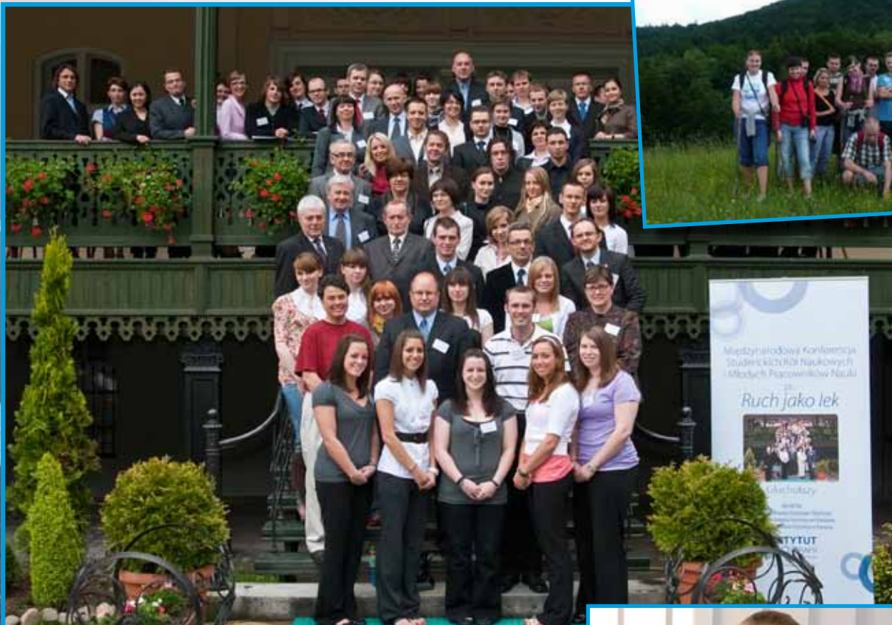
VIII Międzynarodowa Konferencja Studenckich Kół Naukowych i Młodych Pracowników Nauki „Ruch jako lek”, Gluchołazy 2010 organizowana od 2003 r. przez SKN Akton