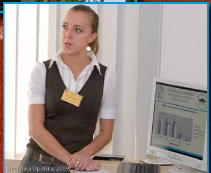
Seminarium „Badania nad zawodem nauczyciela, trenera i fizjoterapeuty” zorganizowane przez SKN PEDEUTES