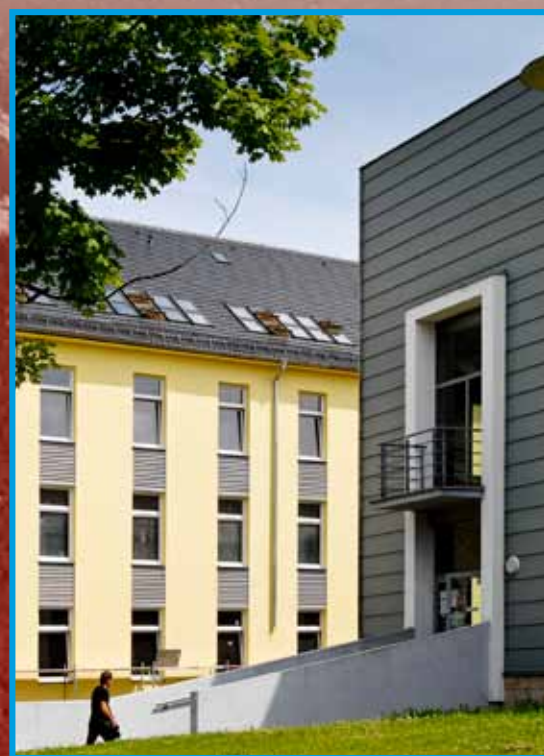
II kampus przy ul. Prószkowskiej