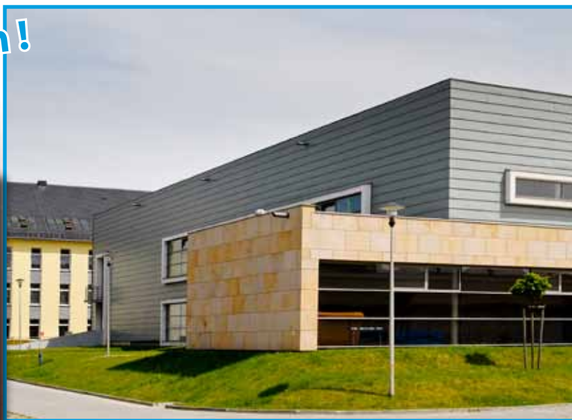
stan faktyczny, czerwiec 2010 r.