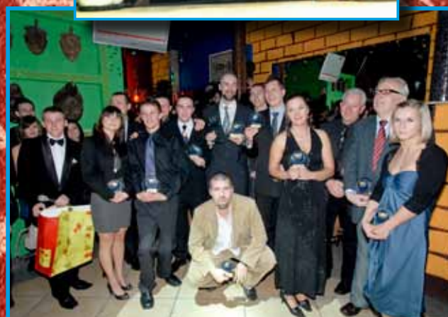
Najlepsi zawodnicy roku 2009 podczas Balu Sportowca