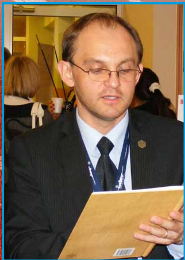
autor podczas I Kongresu Rehabilitacji, Warszawa 2009 r.

W działalności naukowo-badawczej władze wydziału starają się wprowadzić wydział do „Europejskiej Przestrzeni Badawczej” firmowanej przez Unię Europejską. Ponadto zwiększono koordynację procesu pozyskiwania środków finansowych na badania naukowe, poprzez zwiększenie aktywności młodej kadry naukowo-dydaktycznej w zakresie pozyskiwaniu grantów naukowych. Przewiduje się również rozbudowanie oferty studiów podyplomowych, m.in. promocja zdrowia, odnowa psychosomatyczna, odnowa biologiczna w sporcie, gimnastyka korekcyjna, turystyka uzdrowiskowa, kosmetologia, itp. Dotyczy to także poszerzenia oferty kursów: instruktor sportu, instruktor rekreacji, masaż, kursy przygotowujące do egzaminów wstępnych (sprawnościowych), kursy specjalistyczne skierowane do nauczycieli, fizjoterapeutów i innych grup zawodowych w zależności od potrzeb rynku. Ponadto podjęto starania w celu uzyskania przez Instytut Fizjoterapii akredytacji CMKP dotyczącej prowadzenia specjalizacji z zakresu fizjoterapii, a także uruchomienie przychodni rehabilitacyjnej