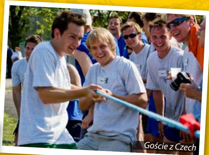
Goście z Czech