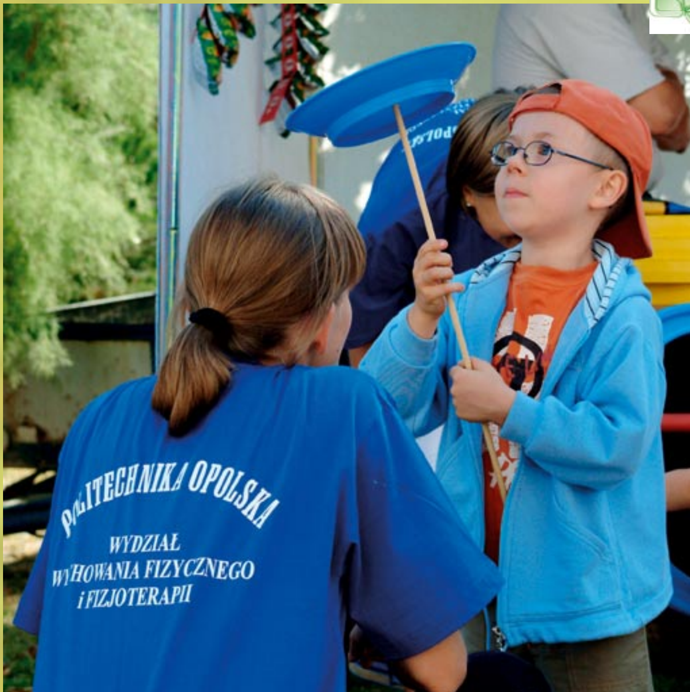
Fot. Sławoj Dubiel