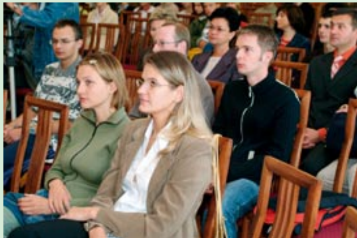
▲ Wśród uczestników pracownicy uczelni, studenci, młodzież szkolna.