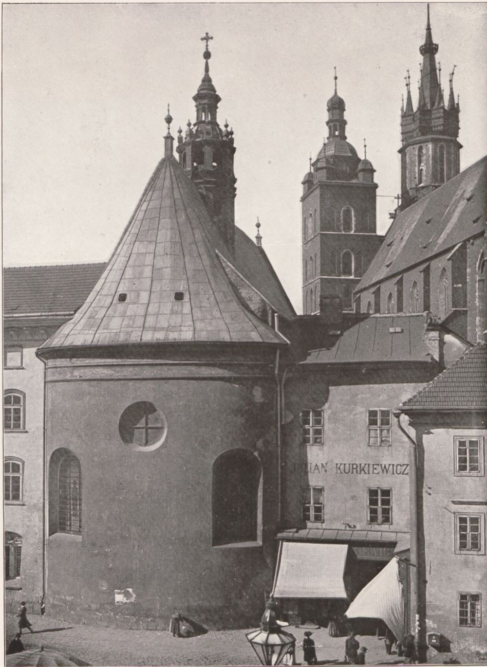
FOT. DR. FRANCISZEK KLEIN