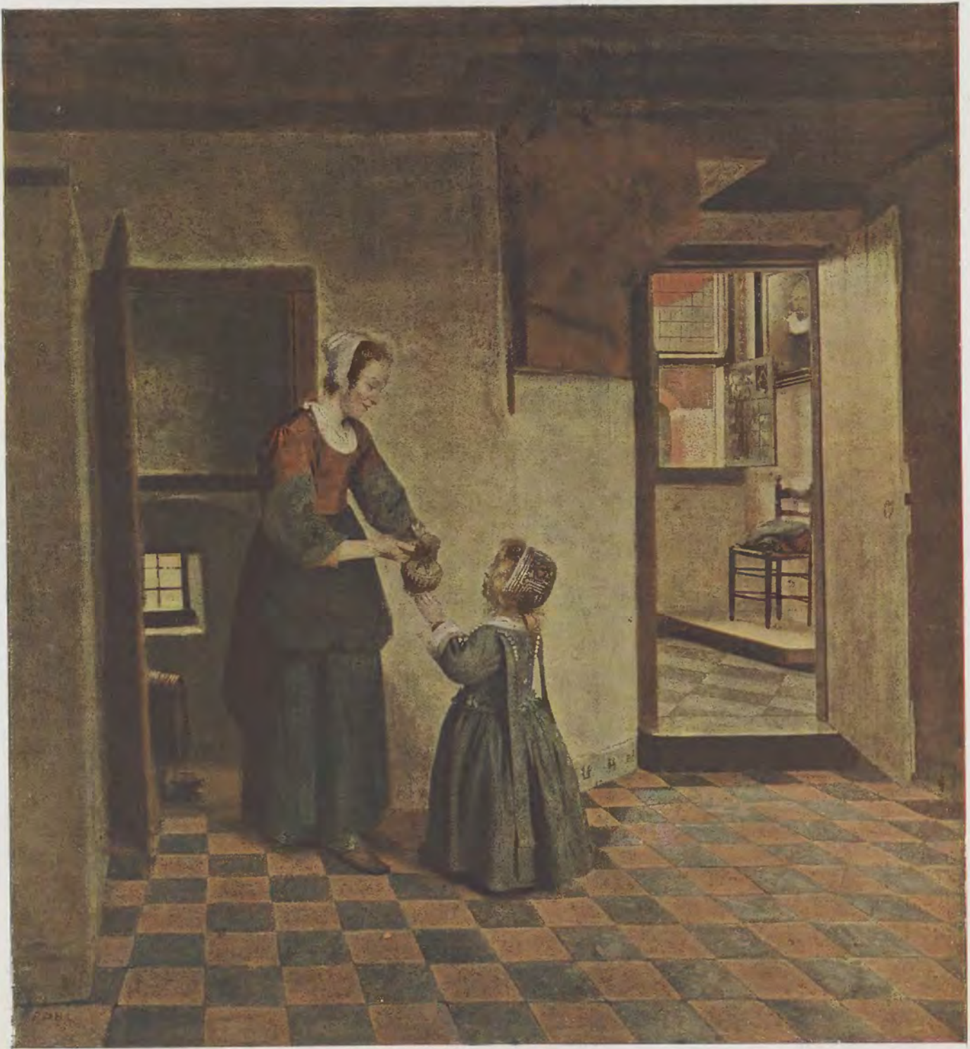
Pieter de Hooch / Die Vorratskammer Rijks-Museum, Amsterdam