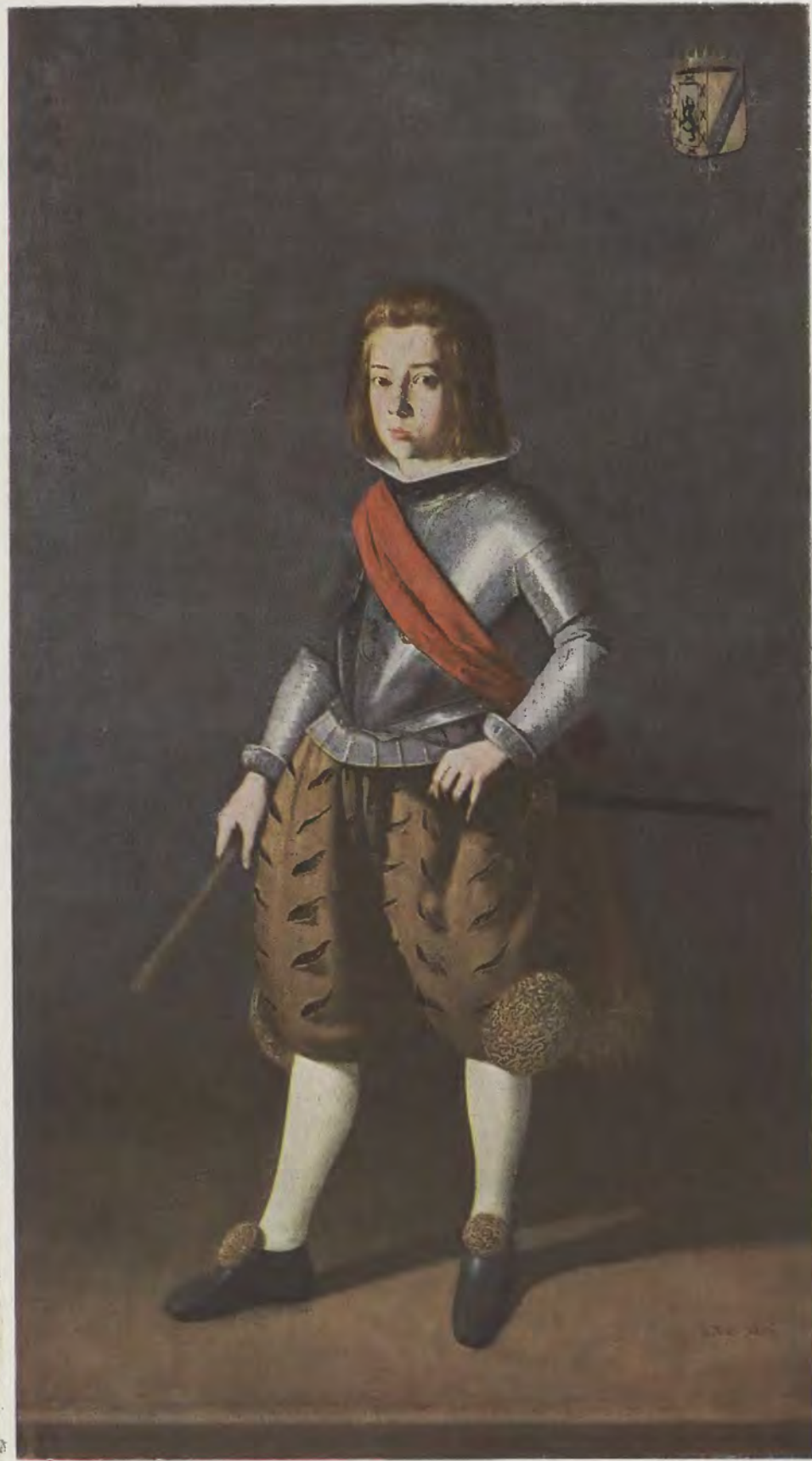
Francisco Zurbarán / Bildnis eines vornehmen Knaben Kaiser-Friedrich-Museum, Berlin