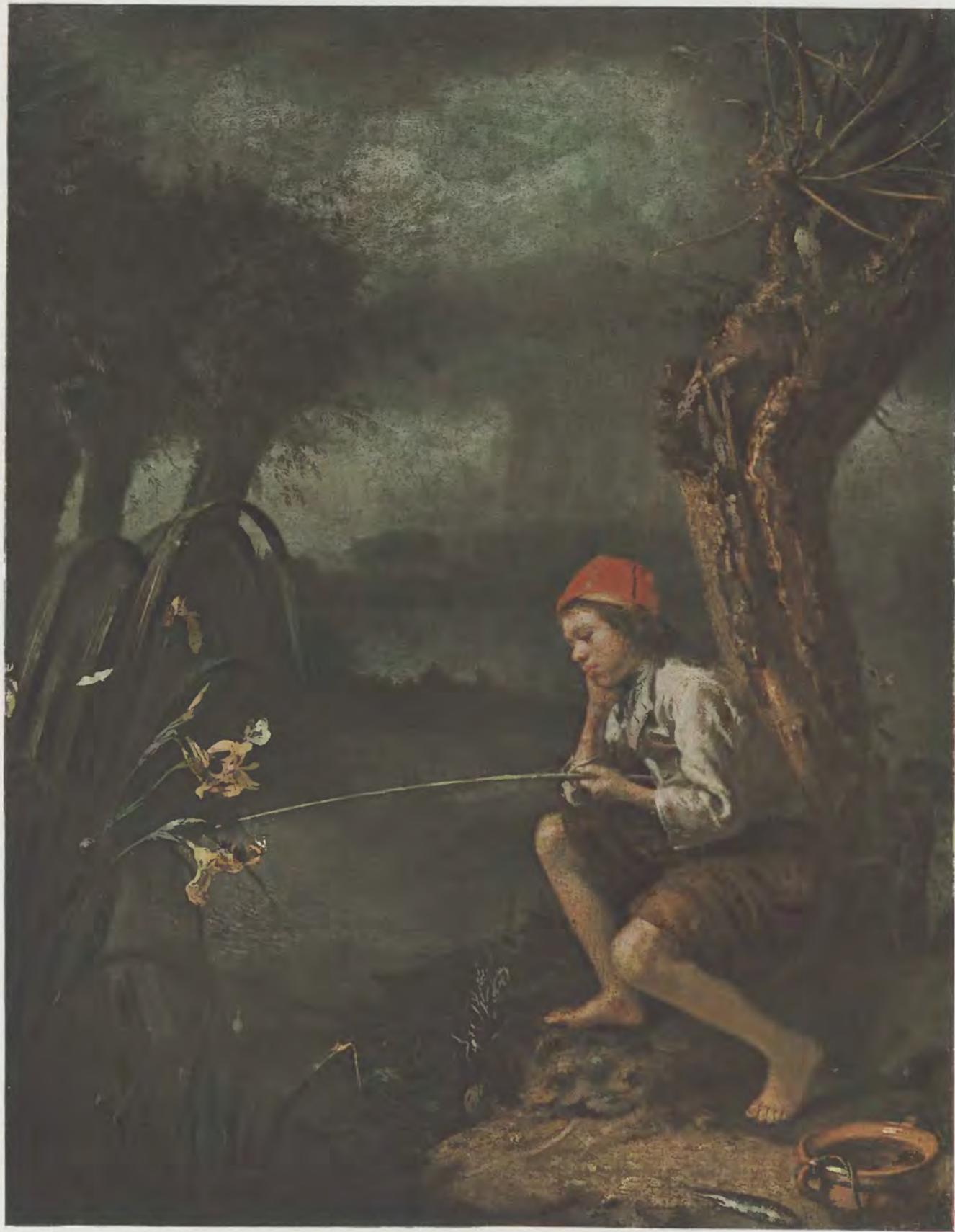
Gottfried Schalcken / Der Fischerknabe Kaiser-Friedrich-Museum, Berlin