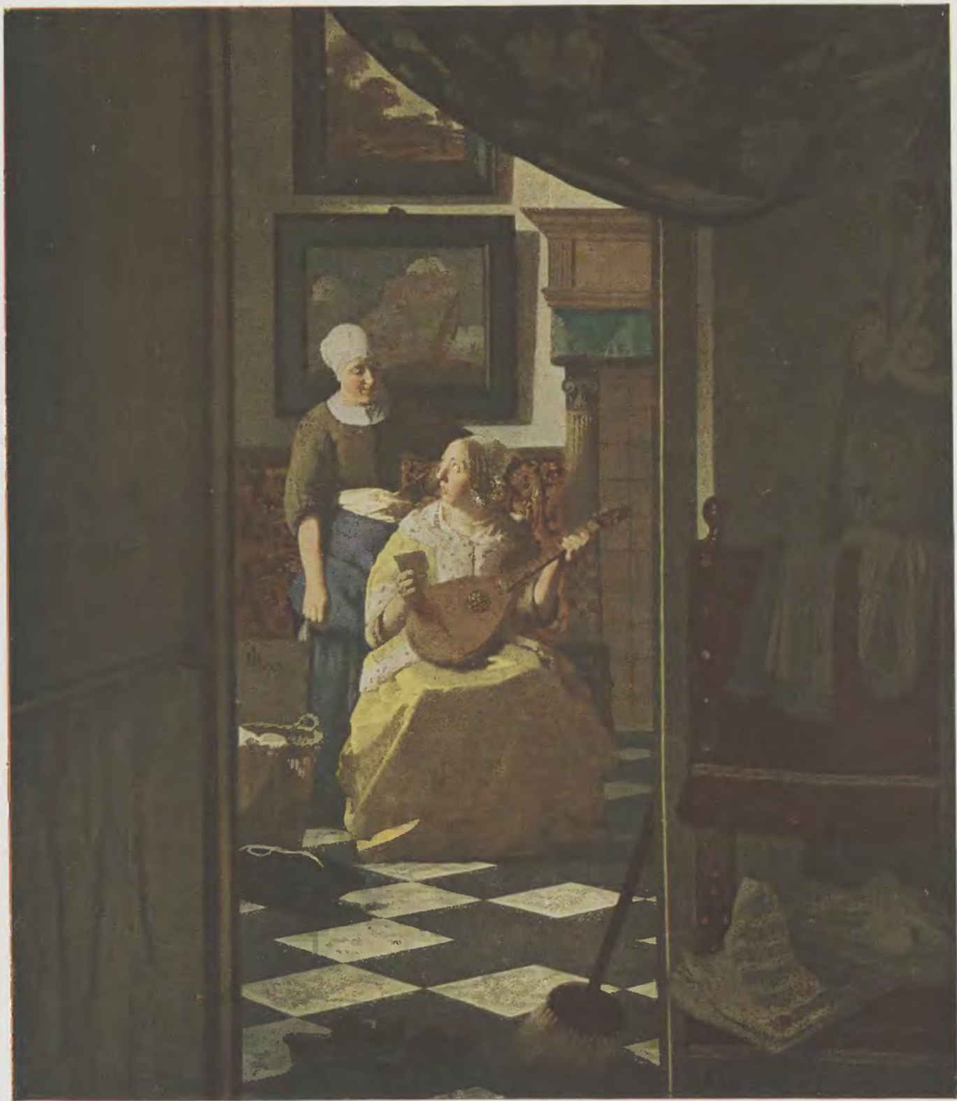
Jan Vermeer van Delft / Der Brief Rijks-Museum, Amsterdam