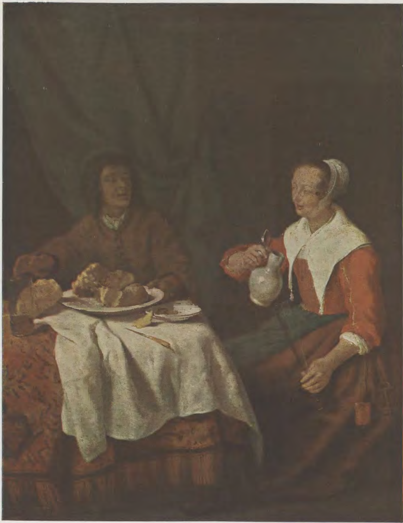
Gabriel Metsu / Das Frühstück Rijks-Museum, Amsterdam