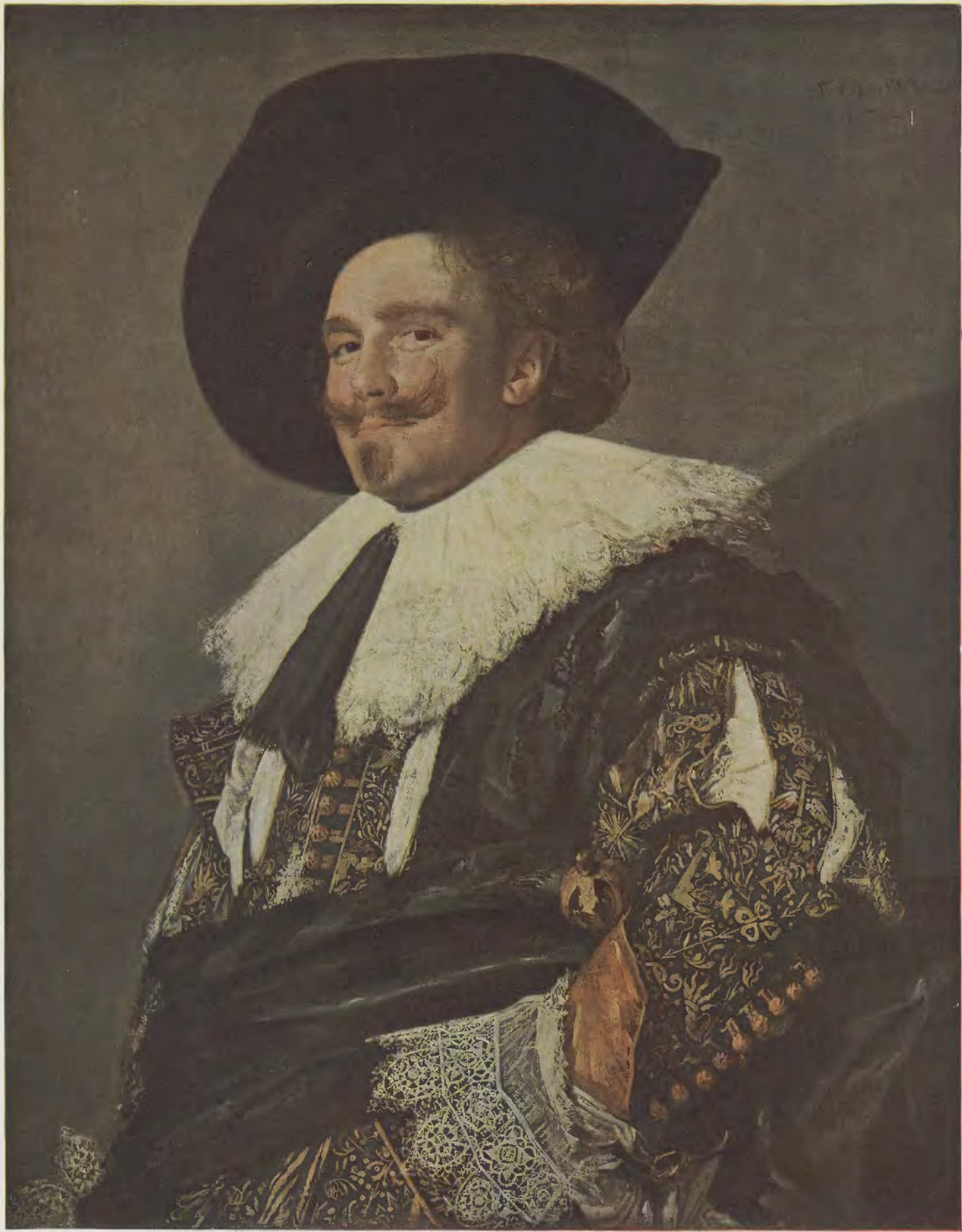
Franz Hals / Der lachende Kavalier Wallace-Collection, London