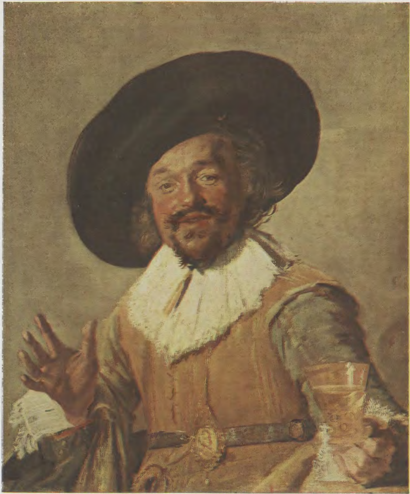
Franz Hals / Der lustige Zecher Rijks-Museum, Amsterdam