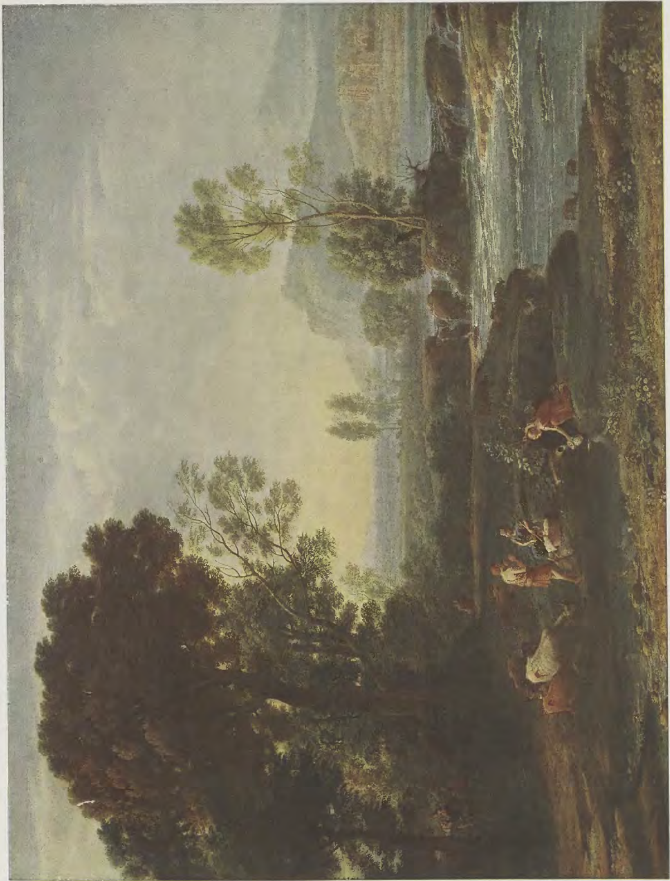
Claude Gellée le Lorrain / Die Flucht nach Ägypten Gemälde-Galerie, Dresden