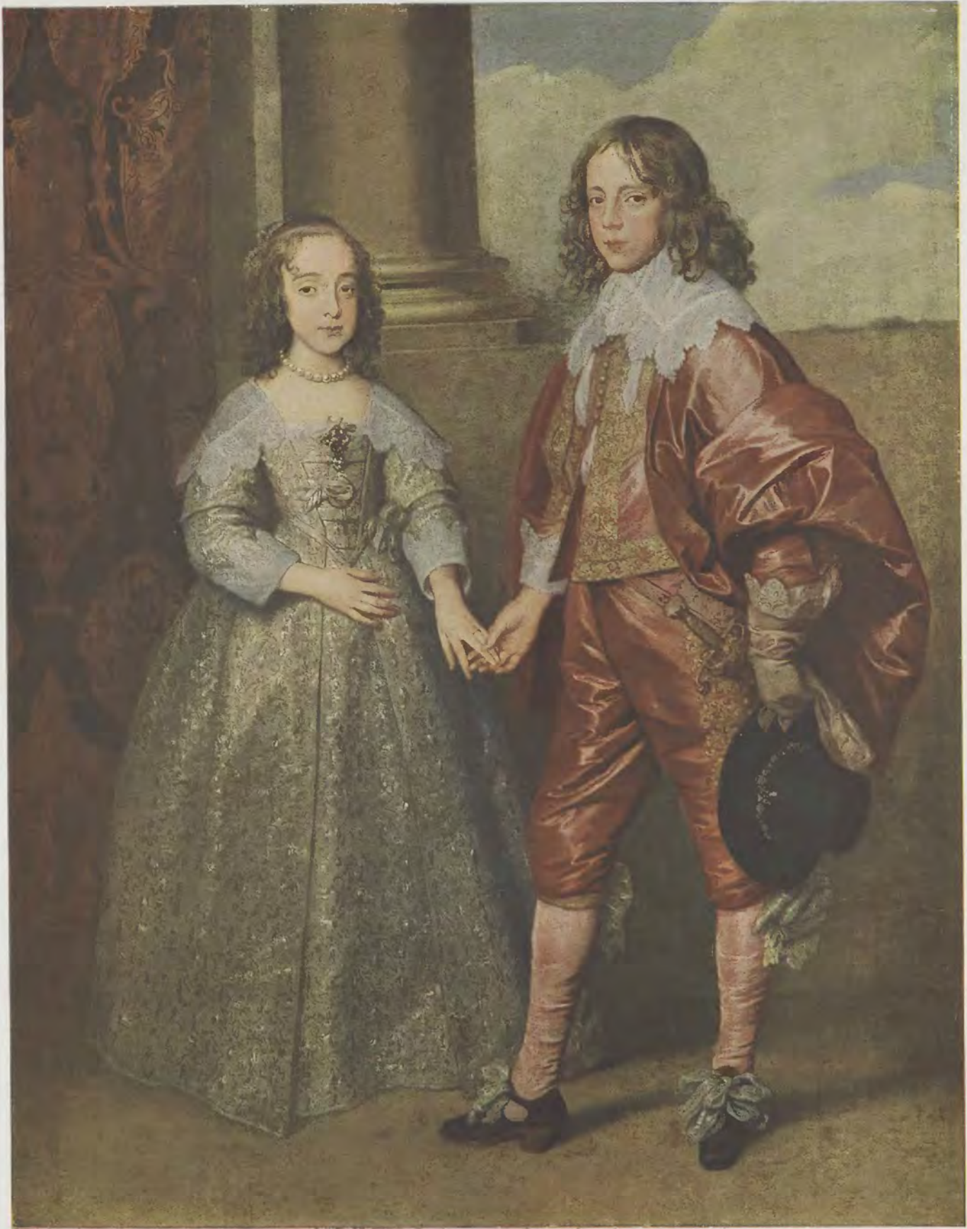
Anton van Dyck / Prinz Wilhelm II. von Oranien und seine Gemahlin Maria Stuart Rijks-Museum, Amsterdam