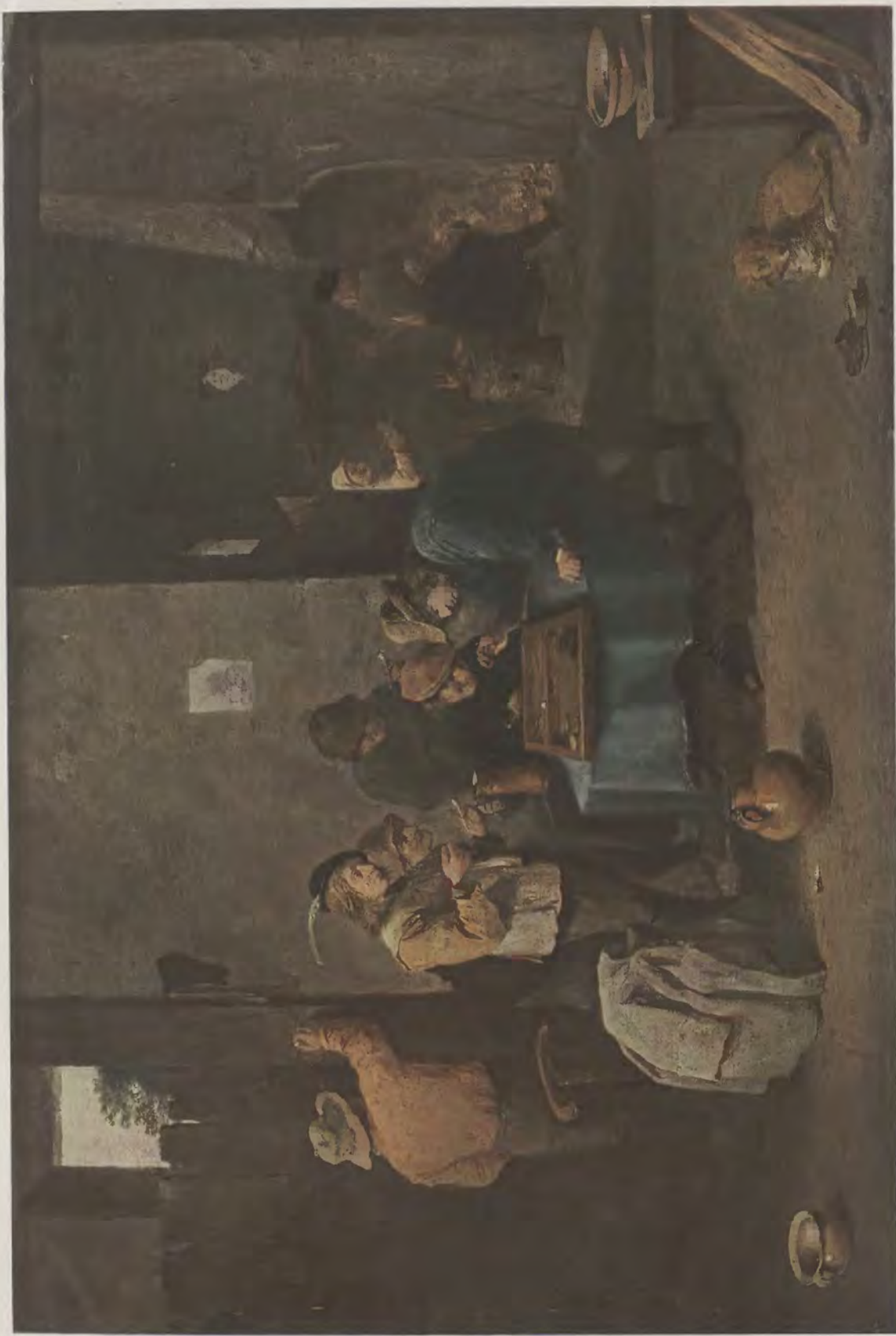
David Teniers / Die Puffspieler Kaiser-Friedrich-Museum, Berlin