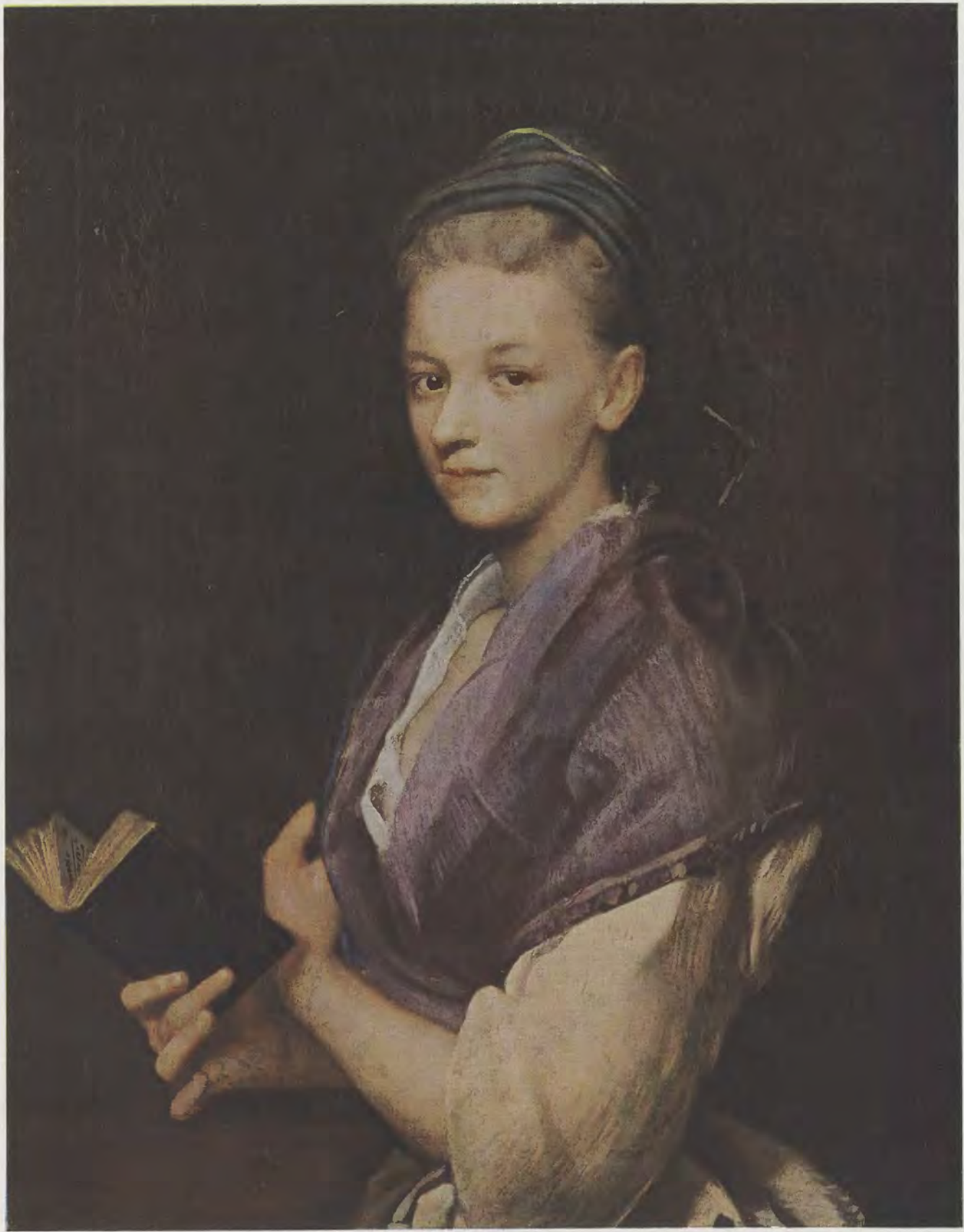
Johann Kupczyk / Weibliches Bildnis Alte Pinakothek, München