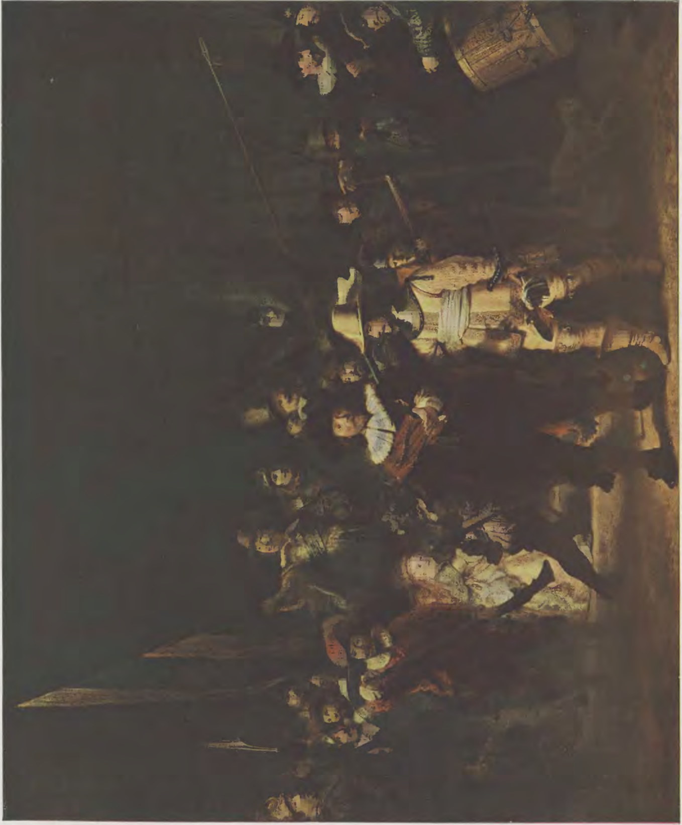
Rembrandt van Ryn / Die Nachtwache Rijks-Museum, Amsterdam