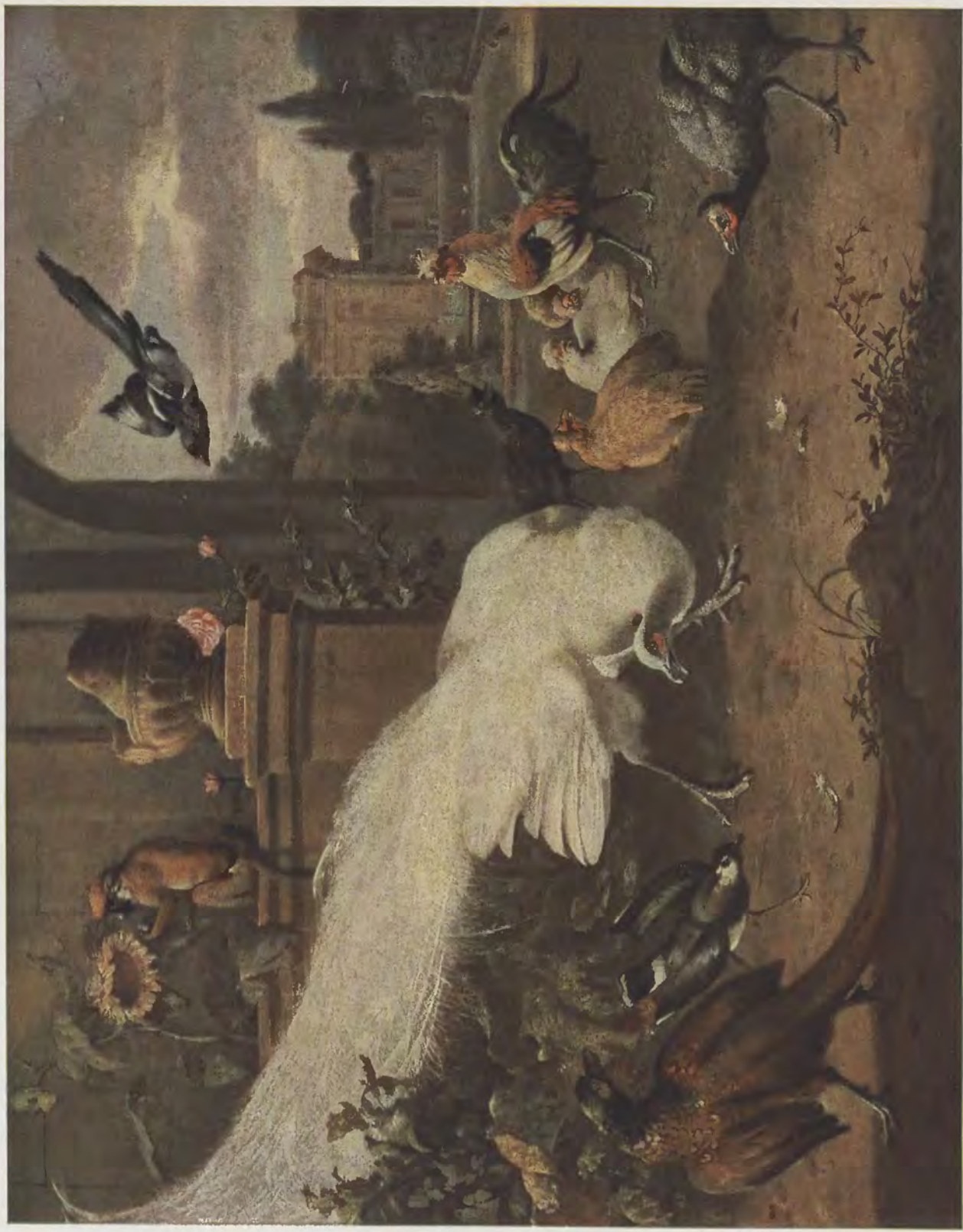
Melchior d'Hondecoeter / Der weiße Pfau Gemälde-Galerie, Kassel