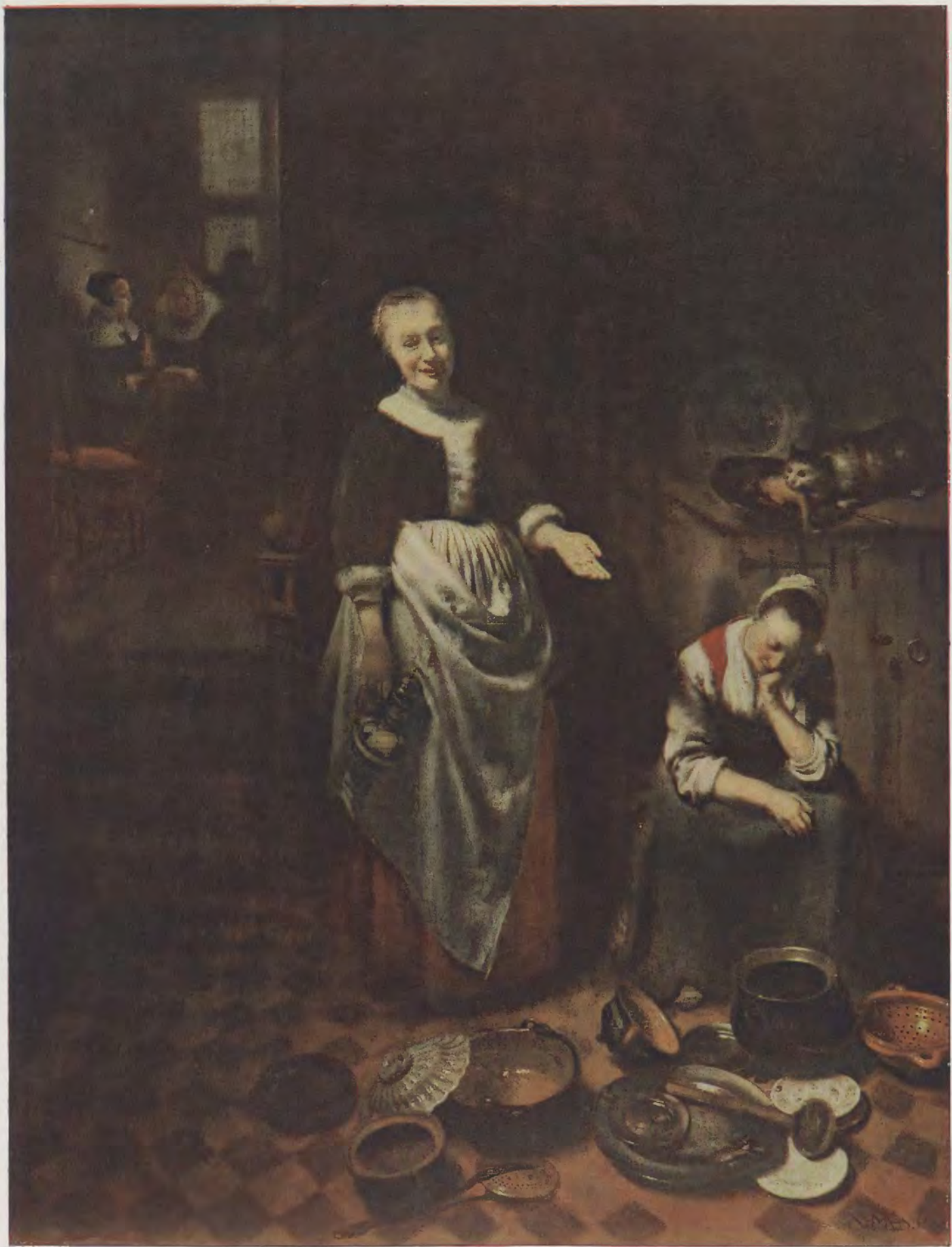
Nicolaas Maes / Die faule Magd National-Galerie, London