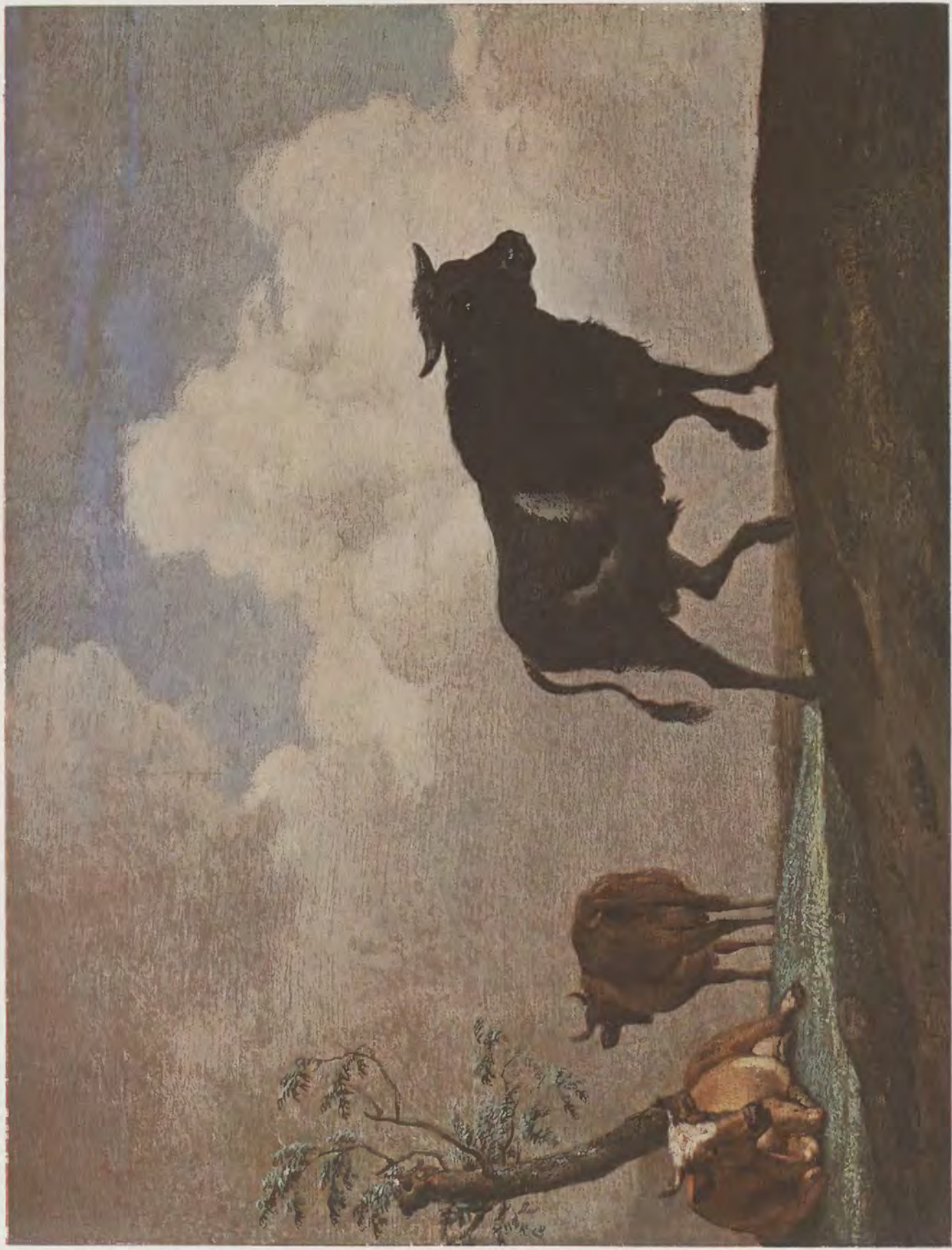
Paulus Potter / Der Stier Kaiser-Friedrich-Museum, Berlin