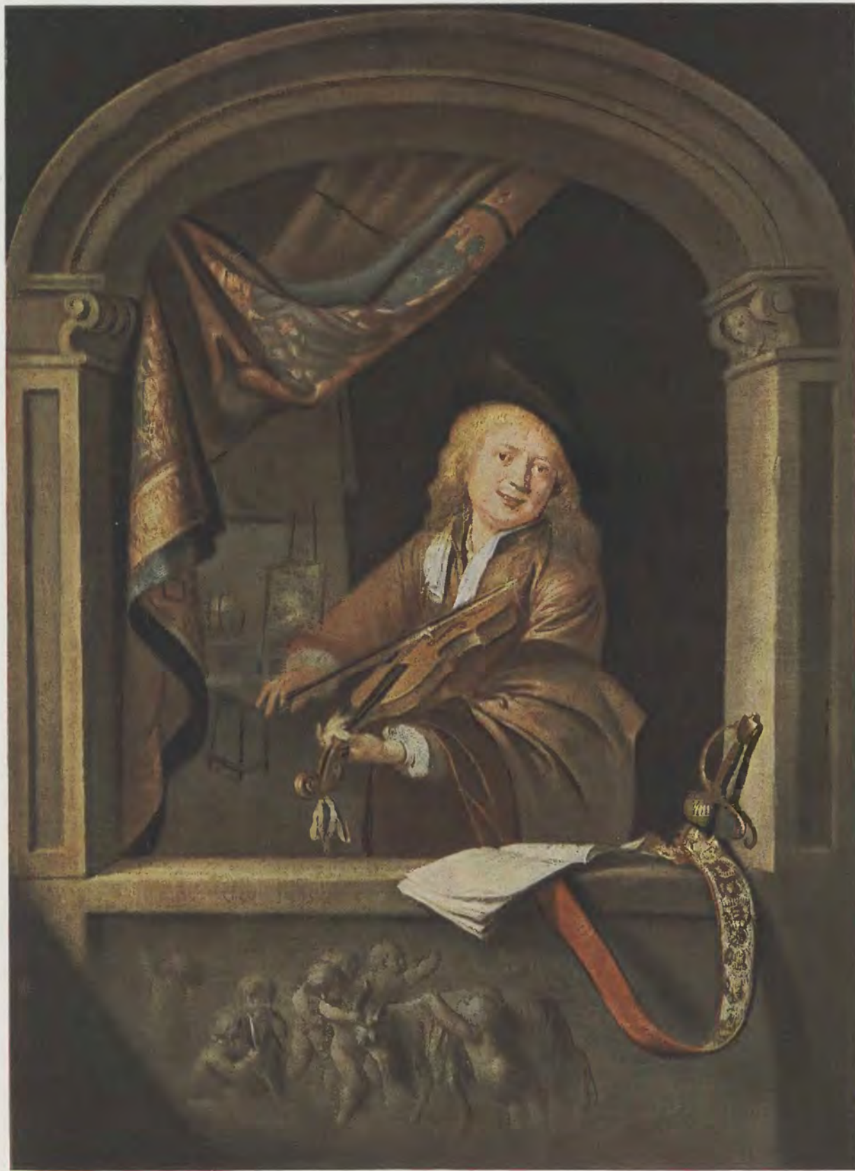
Gerard Dou / Der Geiger am Fenster Gemälde-Galerie, Dresden