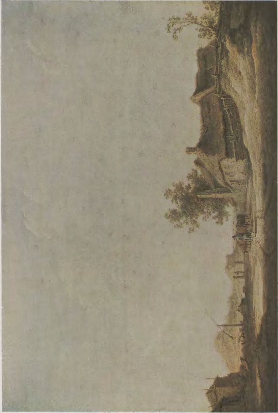
Albert Cuyp / Sonnige Dünenlandschaft Kaiser-Friedrich-Museum, Berlin