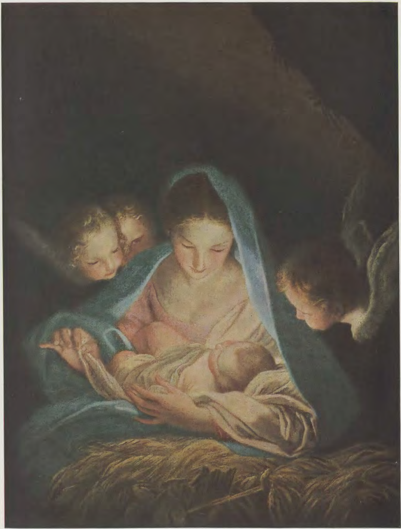
Carlo Maratti / Maria mit dem Kinde Gemälde-Galerie, Dresden