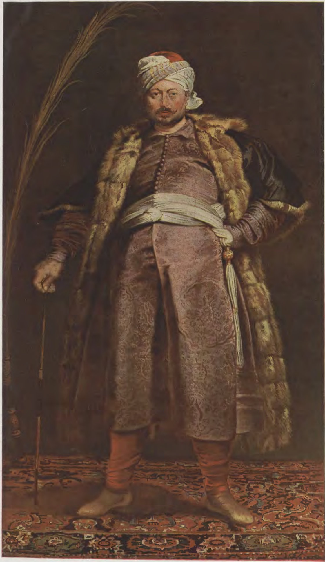
Peter Paul Rubens / Der Orientale Gemälde-Galerie, Kassel