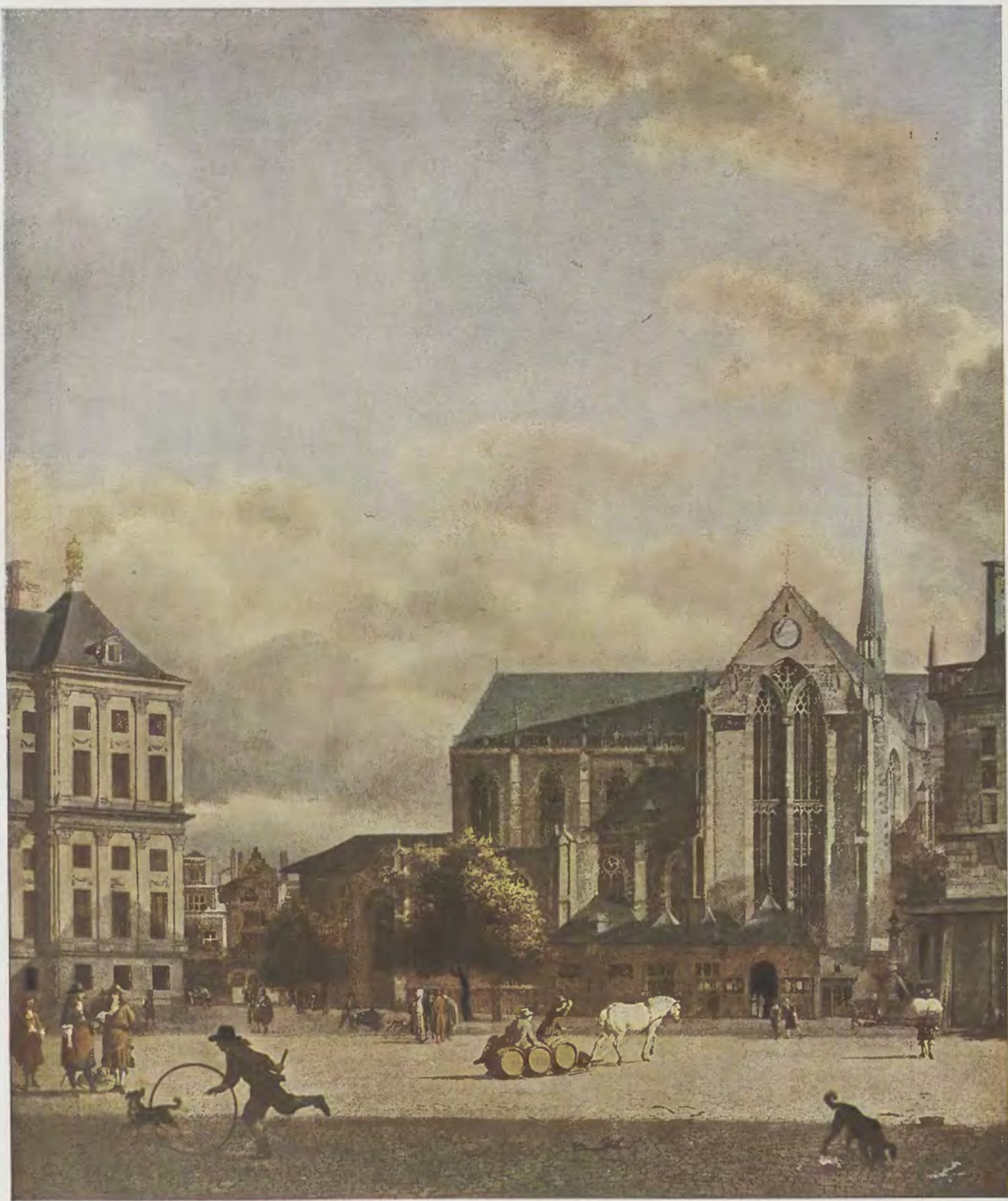
Jan van der Heyde / Der Dam zu Amsterdam Rijks-Museum, Amsterdam