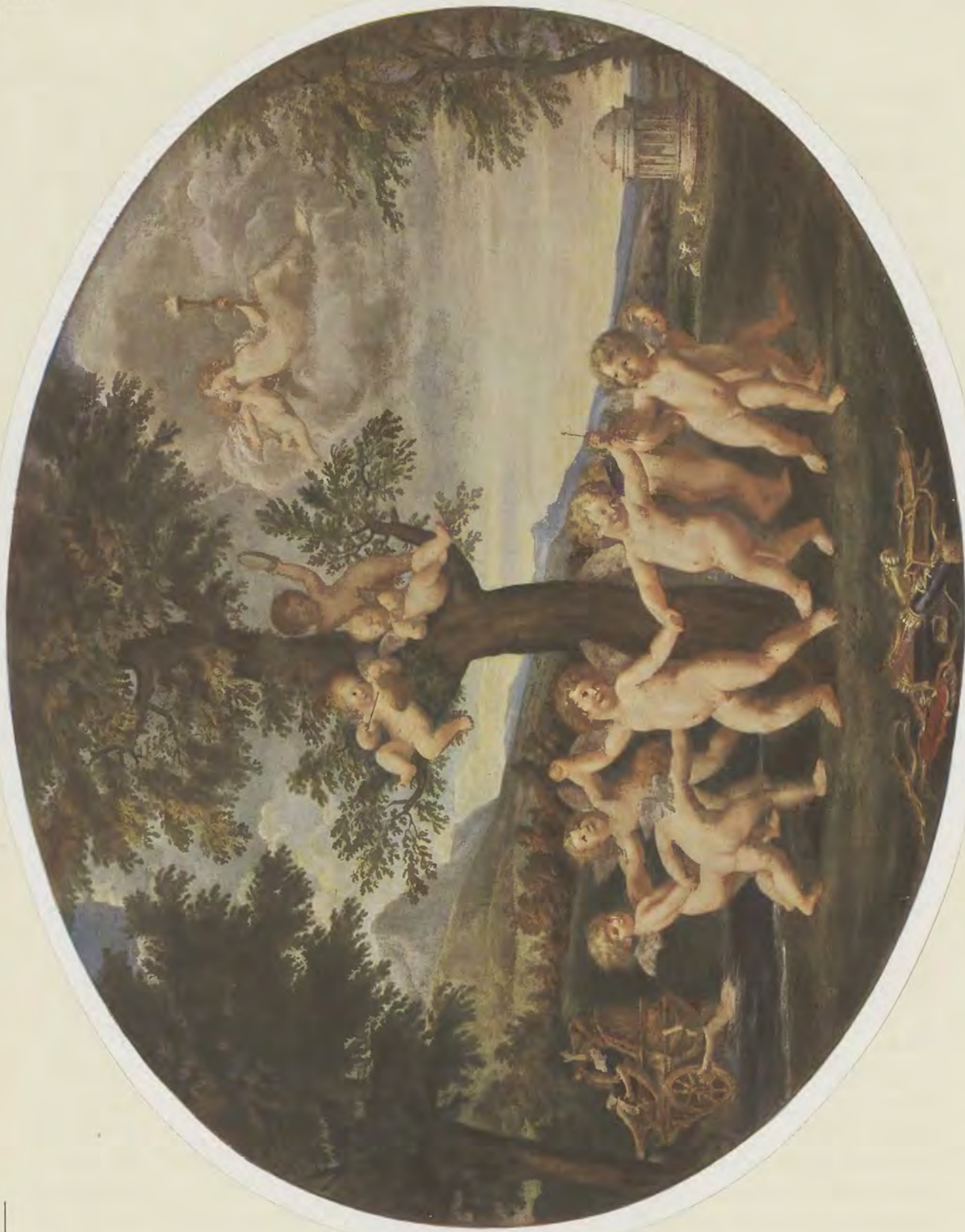
Francesco Albani / Puffentanz Gemälde-Galerie, Dresden