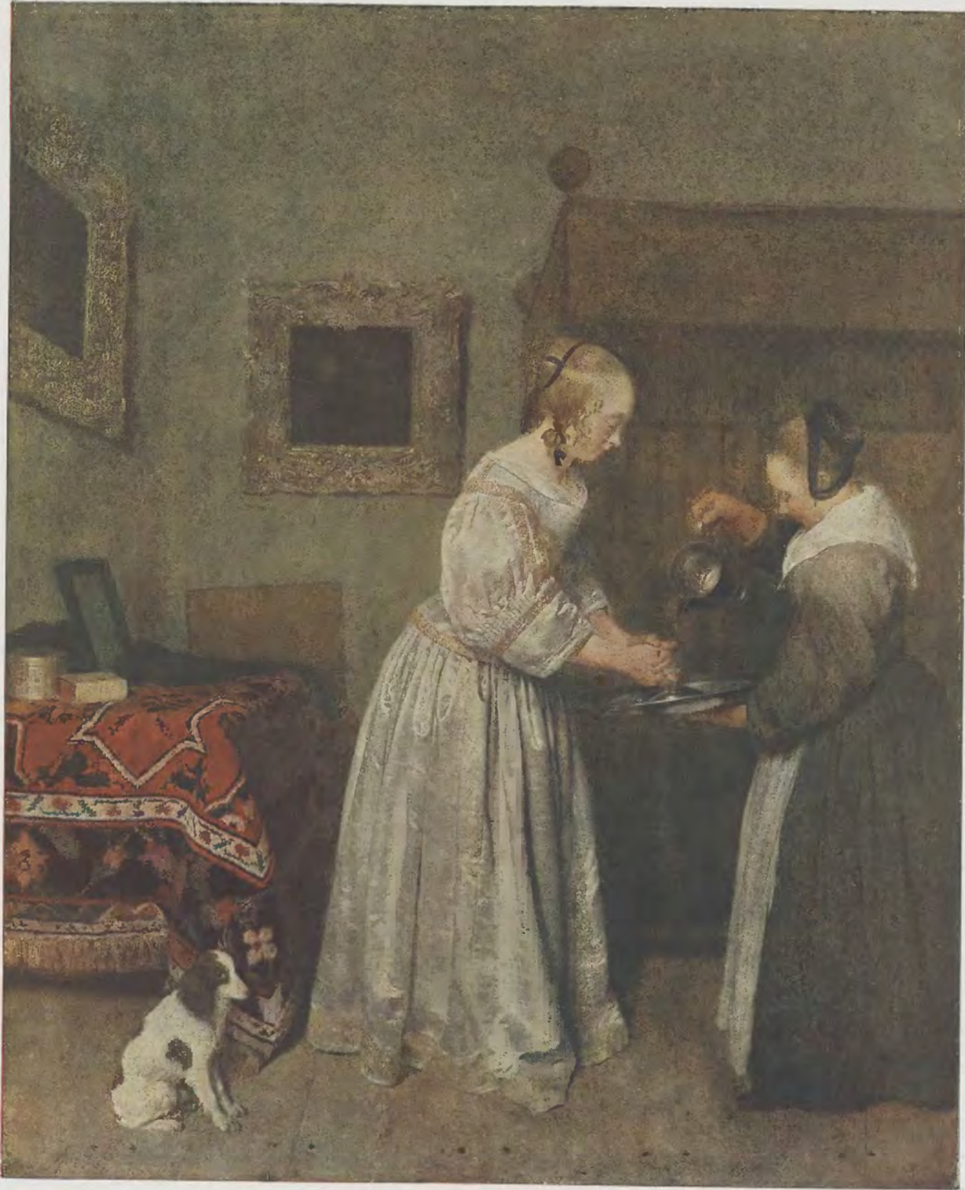
Gerard Terborch / Magd, die einer Dame die Schüssel reicht Gemälde-Galerie, Dresden