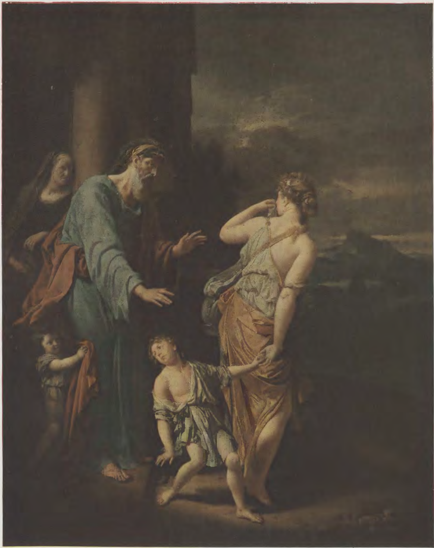
Adriaen van der Werff / Die Verstosung der Hagar Gemälde-Galerie, Dresden