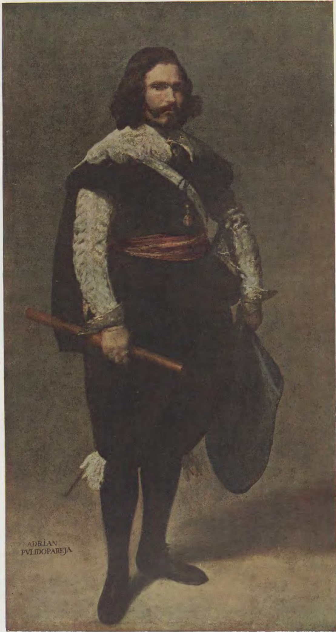
Velázquez / Admiral Pulido Pareja National Gallery, London