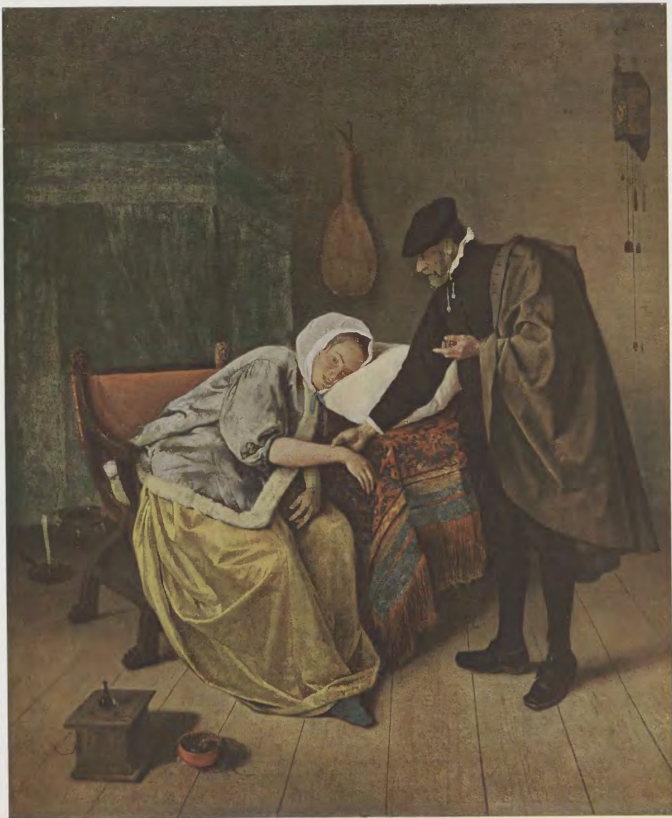
Jan Steen / Die Liebesranke Rijks-Museum, Amsterdam