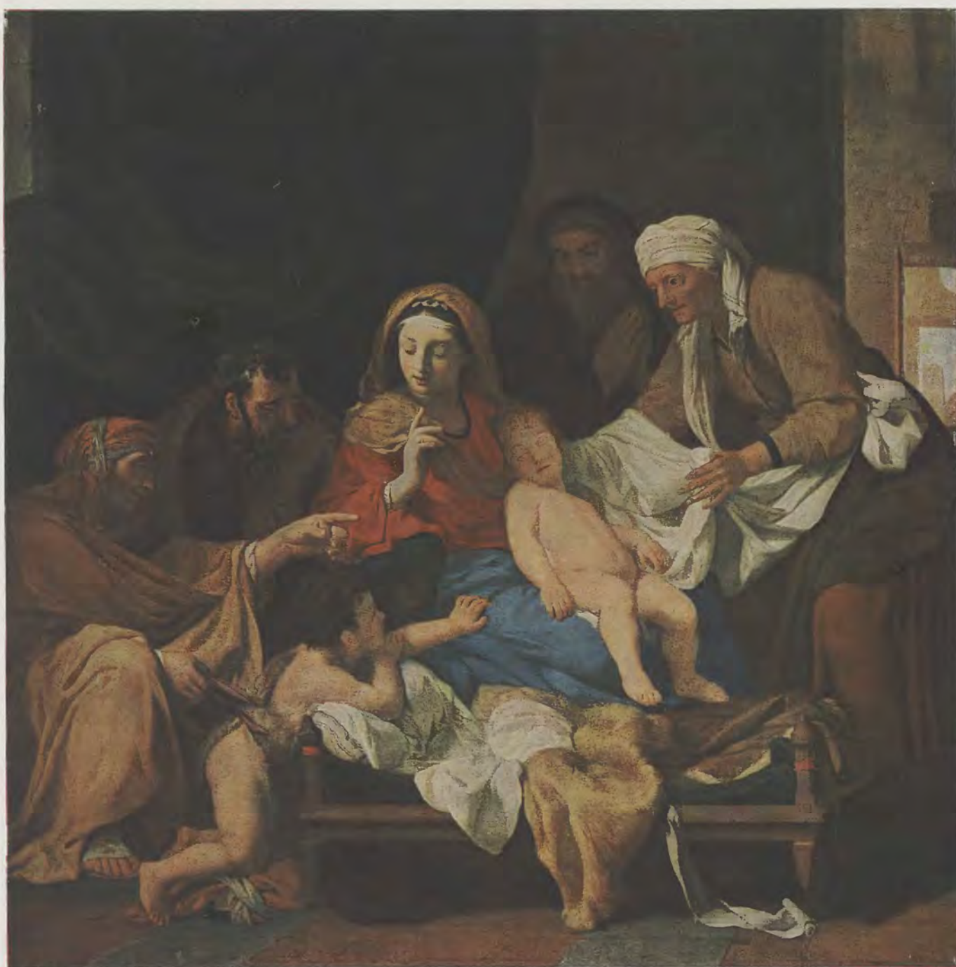
Charles Lebrun / Heilige Familie mit Joachim und dem kleinen Johannes Gemälde-Galerie, Dresden