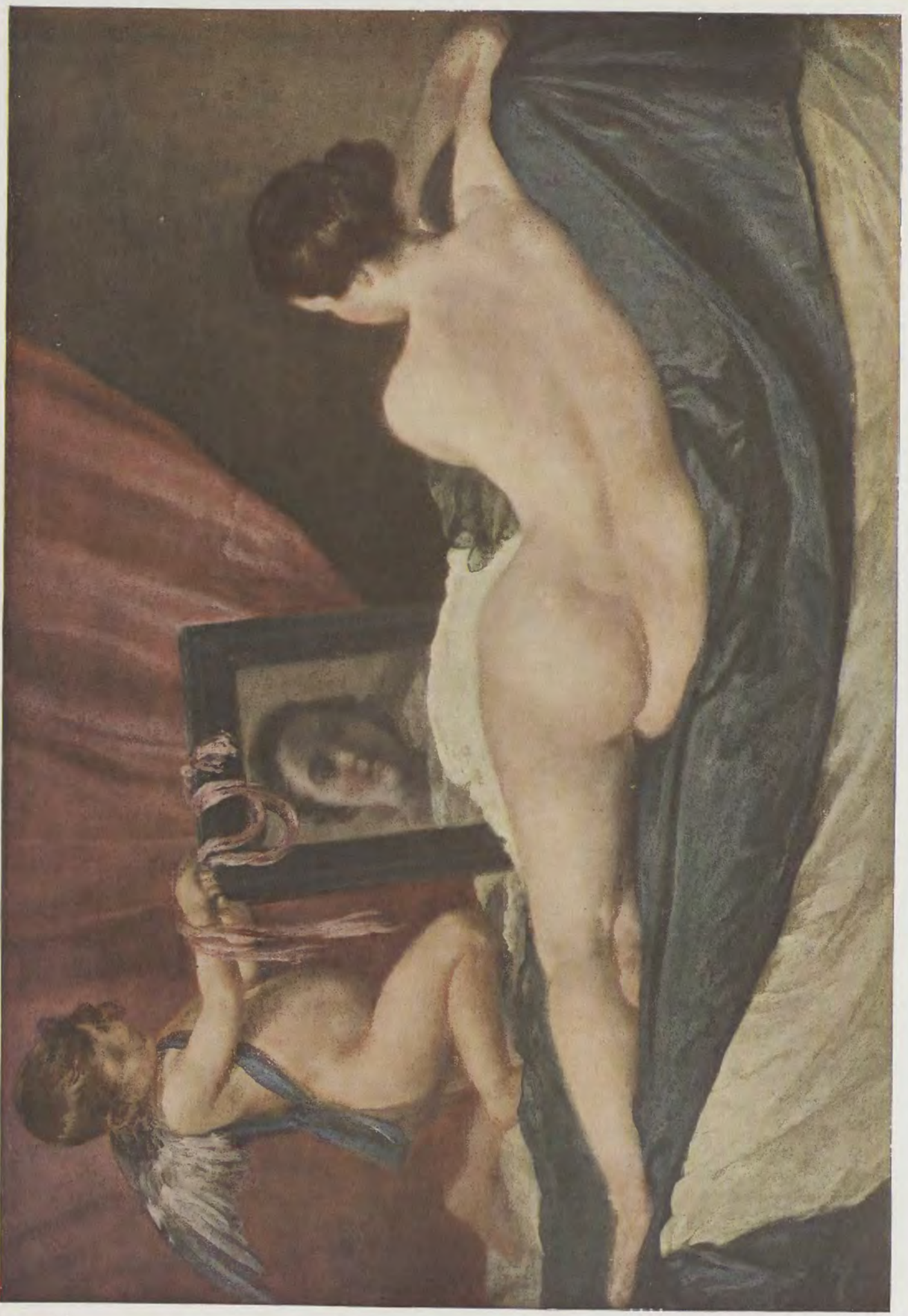
Jacob Jordaens / Der Apfelschimmel Gemälde-Galerie, Kassel