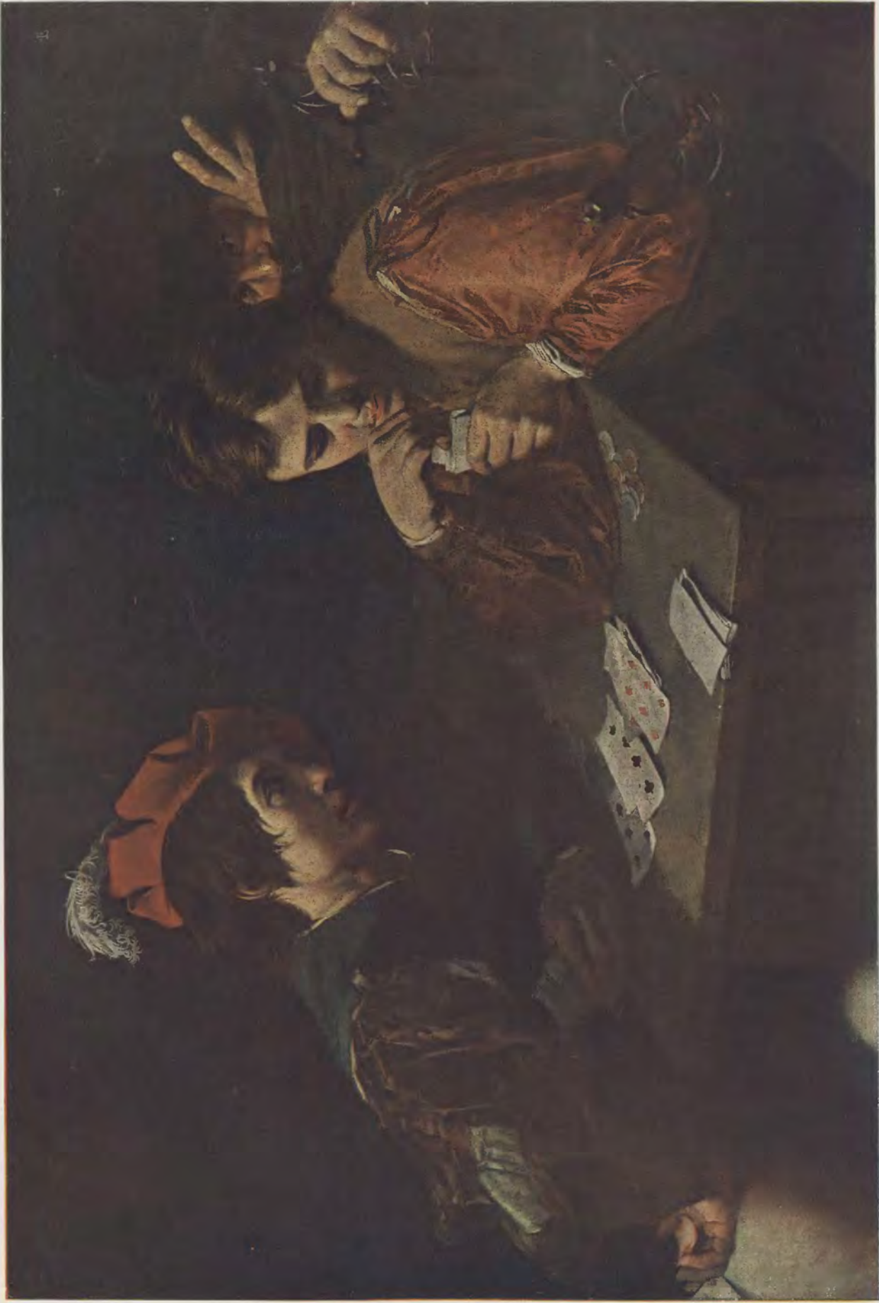
Michelangelo da Caravaggio / Der Fasschspieler Gemälde-Galerie, Dresden