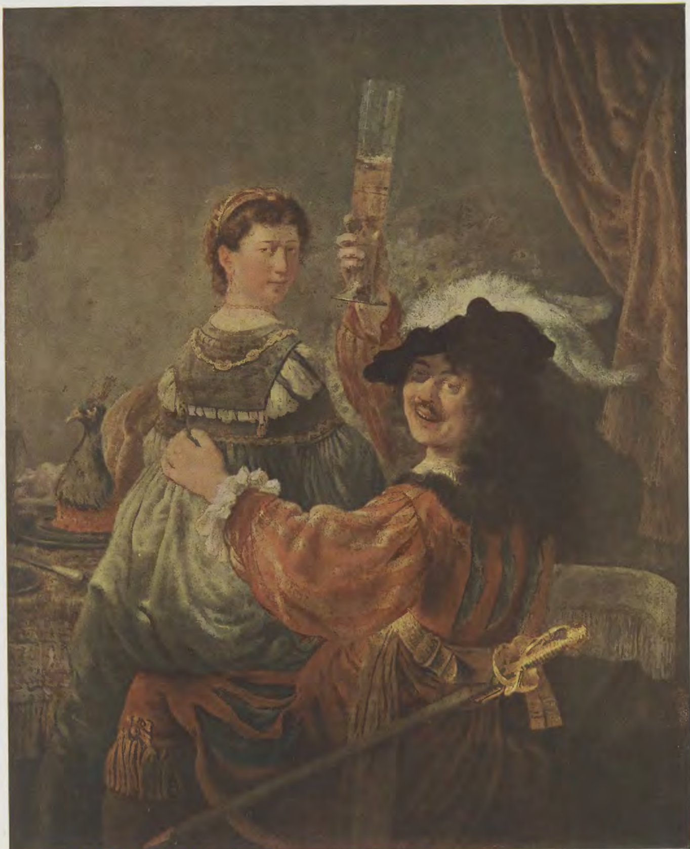
Rembrandt van Ryn / Selbstbildnis mit der Saskia Gemälde-Galerie, Dresden