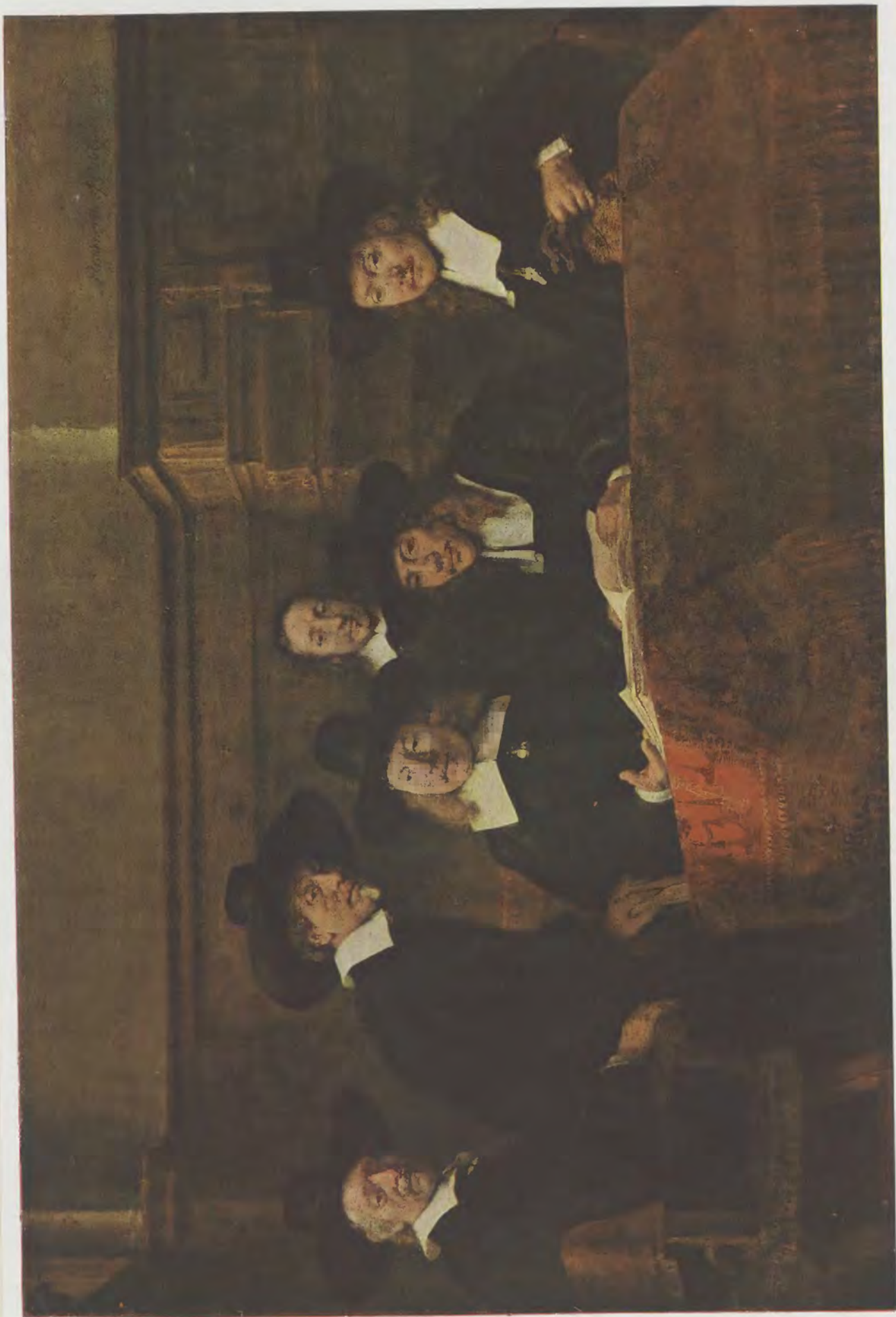
Rembrandt van Rijn / Die Staalmeesters Rijks-Museum, Amsterdam