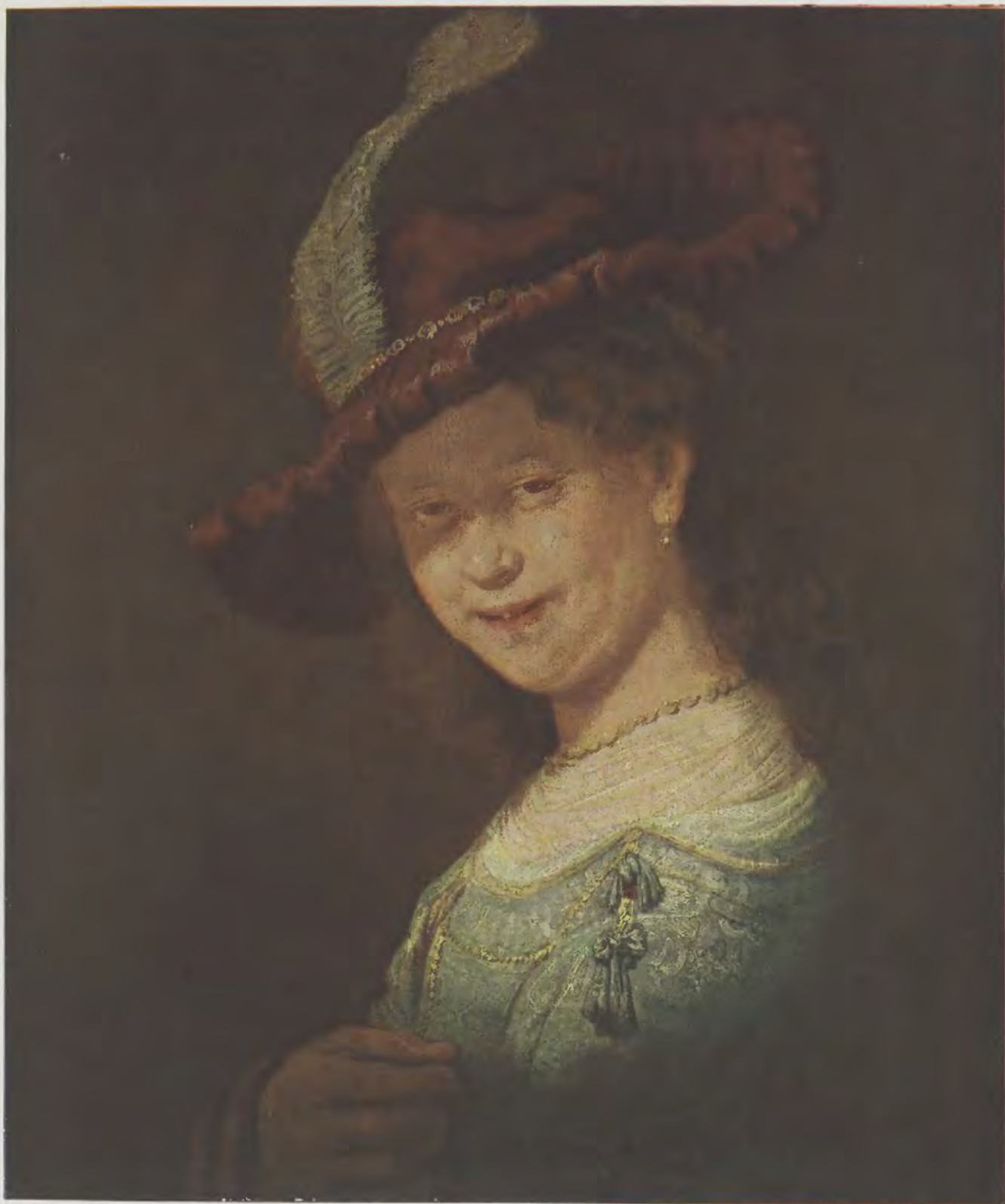
Rembrandt van Ryn / Saskia Gemälde-Galerie, Dresden