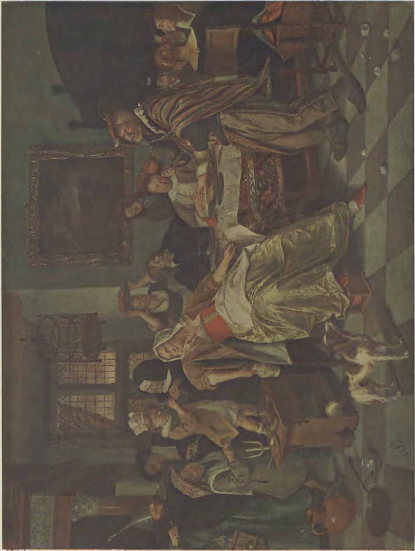
Jan Steen / Das Bohnenfest