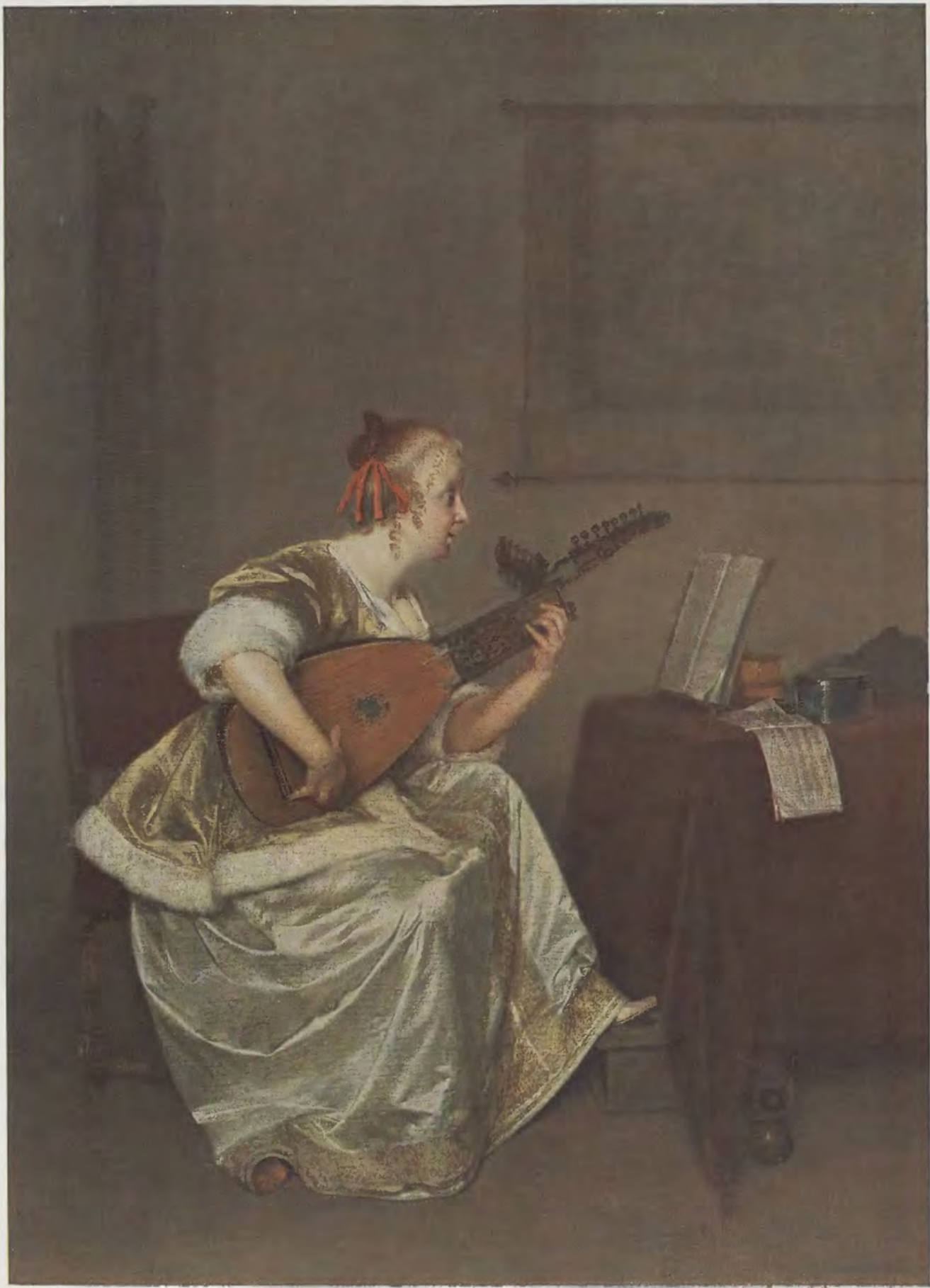
Gerard Terborch / Die Lautenspielerin Gemälde-Galerie, Kassel