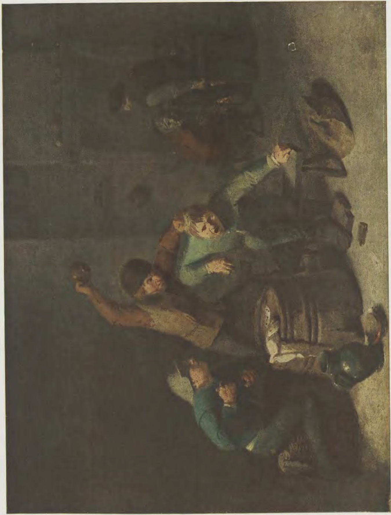
Adriaen Brouwer / Kaufende Bauern Gemälde-Galerie, Dresden