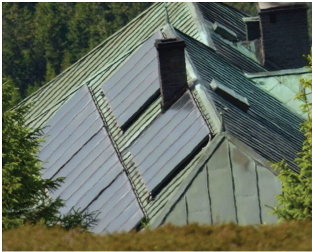
Il. 7. Kolektory słoneczne na dachu schroniska Strzecha Akademicka