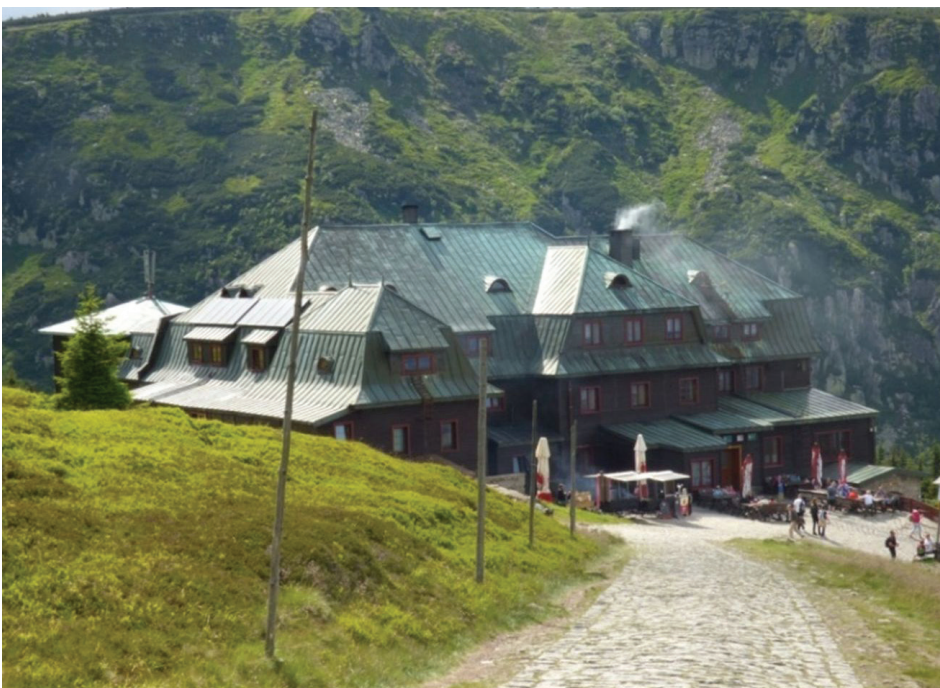
Il. 5. Schronisko Strzecha Akademicka – dach wielospadowy z mansardami pokryty blachą

After the war, Strzecha Akademicka shelter was taken over by the Jagiellonian University and then by students of Cracow's universities (Central Academic Sports Association), and its present name comes from this period. During renovations which were carried out after 1945, the colours of the facades were changed, and the roof was covered with sheet metal which was preserved until today (Fig. 5). The form and significant elements of the building have not been changed.