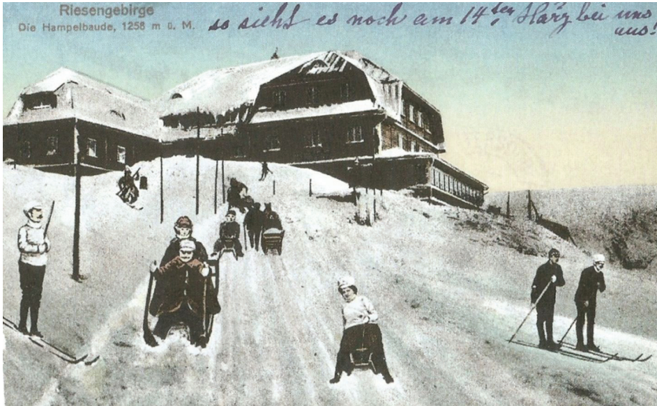
Il. 4. Zjazd sani rogatych spod Hampelbaude (dziś Strzecha Akademicka), pocztówka barwna około 1917, Wyd. Männich and Höckerdorf, Hirschberg