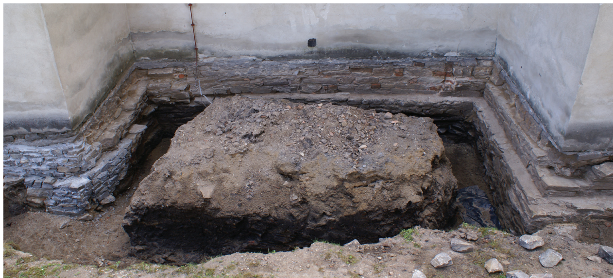
Il. 3. Relikwiarz kaplicy dostawianej od północy do trzeciego od zachodu przeszle północnej nawy bocznej kościoła (fot. E. Łużyńska, 2008)

Kolejnym odkrytym elementem było lico muru odsłoniętego w północnym profilu wykopu drenażowego, zlokalizowanego przy czwartym od zachodu przeszle omawianej wcześniej północnej nawy bocznej kościoła. Mur ten został wzniesiony z niechlujnie ułożonych kamieni i stanowił prawdopodobnie część obudowy zniszczonego kanału.