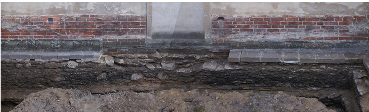
Il. 2. Północna ściana północnego ramienia transeptu z relikw porta mortuorum

The third sub-type of the wall along with the plinth was preserved in the first western bay of the northern aisle. At