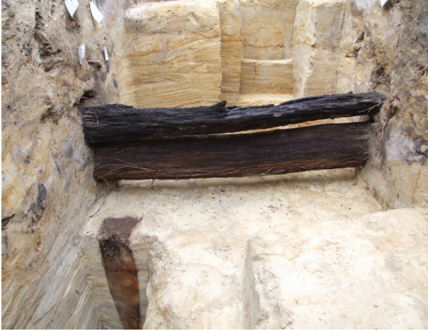
Il. 6. Zamek w Chudowie. Relikty cembrowiny ograniczającej wyspę zamkową od strony południowo-wschodniej oraz słupa podtrzymującego jej konstrukcję – odkryte w toku badań archeologicznych

Fig. 6. The castle in Chudów. Relics of the casing limiting the castle island from the south-eastern side and the pole supporting its construction – discovered during the archaeological research