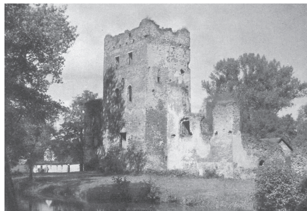
Il. 8. Ruiny zamku w Chudowie około 1910 r., w tle browar zamkowy [18]

Wczesnonowoczesny zamek zbudowany został przez Jana Gierałtowskiego około połowy XVI w. w miejscu spalonej w pierwszych dekadach tego stulecia siedziby Chudowskich. Jego dominantą (i pierwszy etap inwestycji) stanowiła wieża. Interesującą obserwacją może być to, że w pełni realizowała ona program późnośredniowiecznych