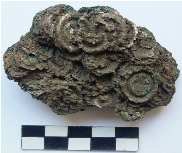
Il. 4. Zamek w Chudowie. Skarb brakteatów przed pracami konserwatorskimi