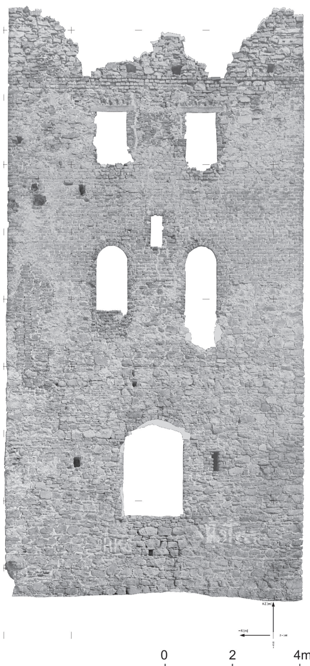
Il. 5. Zamek w Chudowie. Dokumentacja fotogrametryczna południowo-zachodniej elewacji wieży przed odbudową – widoczne XIX-wieczne okna kaplicy, na którą zaadaptowano pierwotną trzecią i czwartą kondygnację wieży (oprac. J. Gołka, J. Haliński, A. Misterek, J. Szafarczyk, 2000)

20 W XIX w., za czasów Bally'ego, zamek chudowski został znacznie przebudowany, tracąc renesansową formę. W wieży rozebrano strop ponad trzecią kondygnacją, łącząc w ten sposób trzecią oraz czwartą kondygnację i tworząc wysokie pomieszczenie. Urządzono zamkową kaplicę, całą wieżę podwyższono o jedną kondygnację (szóstą). Zmianie uległa również dotychczasowa komunikacja między piętrami oraz rozplanowanie okien wieży. Wejście na piątą kondygnację prowadziło najpewniej z zewnętrznego, drewnianego ganku. Prawdopodobnie w tym czasie przebudowane zostały również budynki mieszkalne na dziedzińcu. Wspominają o tym dokumenty z 1838 r., gdzie mowa jest o zmianach dokonanych przez nowego właściciela, w tym również o realizacji i poświęceniu kaplicy [6, s. 71].