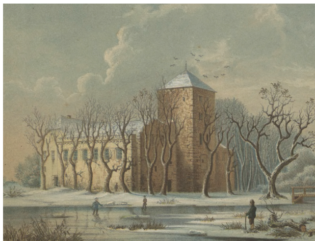
Il. 7. Zamek w Chudowie około 1860 r. – po odbudowie Aleksandra von Bally’ego (litografia A. Dunckera – zbiory Muzeum Zamku w Chudowie) [17]

Fig. 7. The castle in Chudów in circa 1860 – after the reconstruction by Alexander von Bally (a lithograph by A. Duncker – collections of the Castle Museum in Chudów) [17]