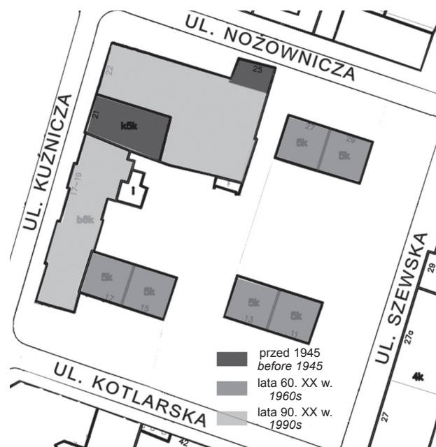
Il. 5. Przekształcenia urbanistyczne kwartału Nożownicza–Szewska–Kotlarska–Kuźnicza w II połowie XX w. (oprac. E. Grodzka)