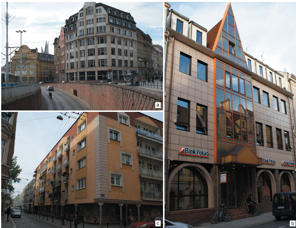
Il. 4. Realizacje z lat 70. i 80. XX w.:

a) trasa W–Z, b) Pomorski Bank Kredytowy, c) budynek narożny na skrzyżowaniu ul. Nożowniczej i Jodłowej