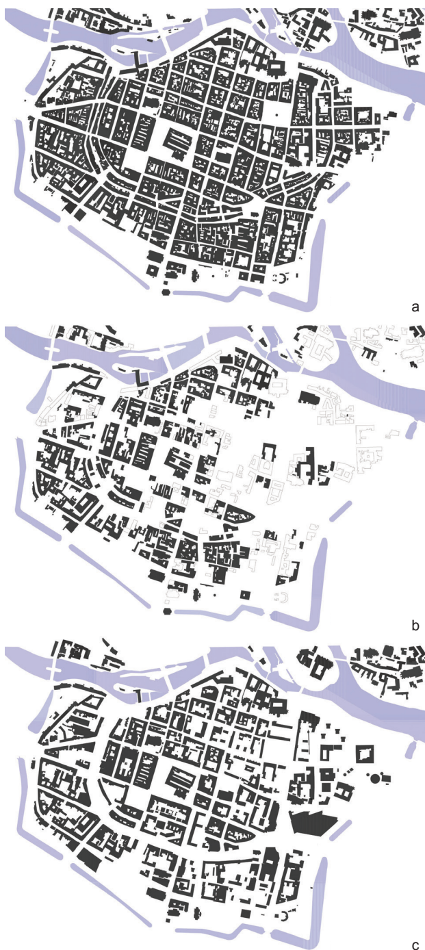
Il. 1. Schwarzplan Starego Miasta we Wrocławiu: a) 1935 r., b) 1945 r., c) 2015 r. (oprac. E. Grodzka)